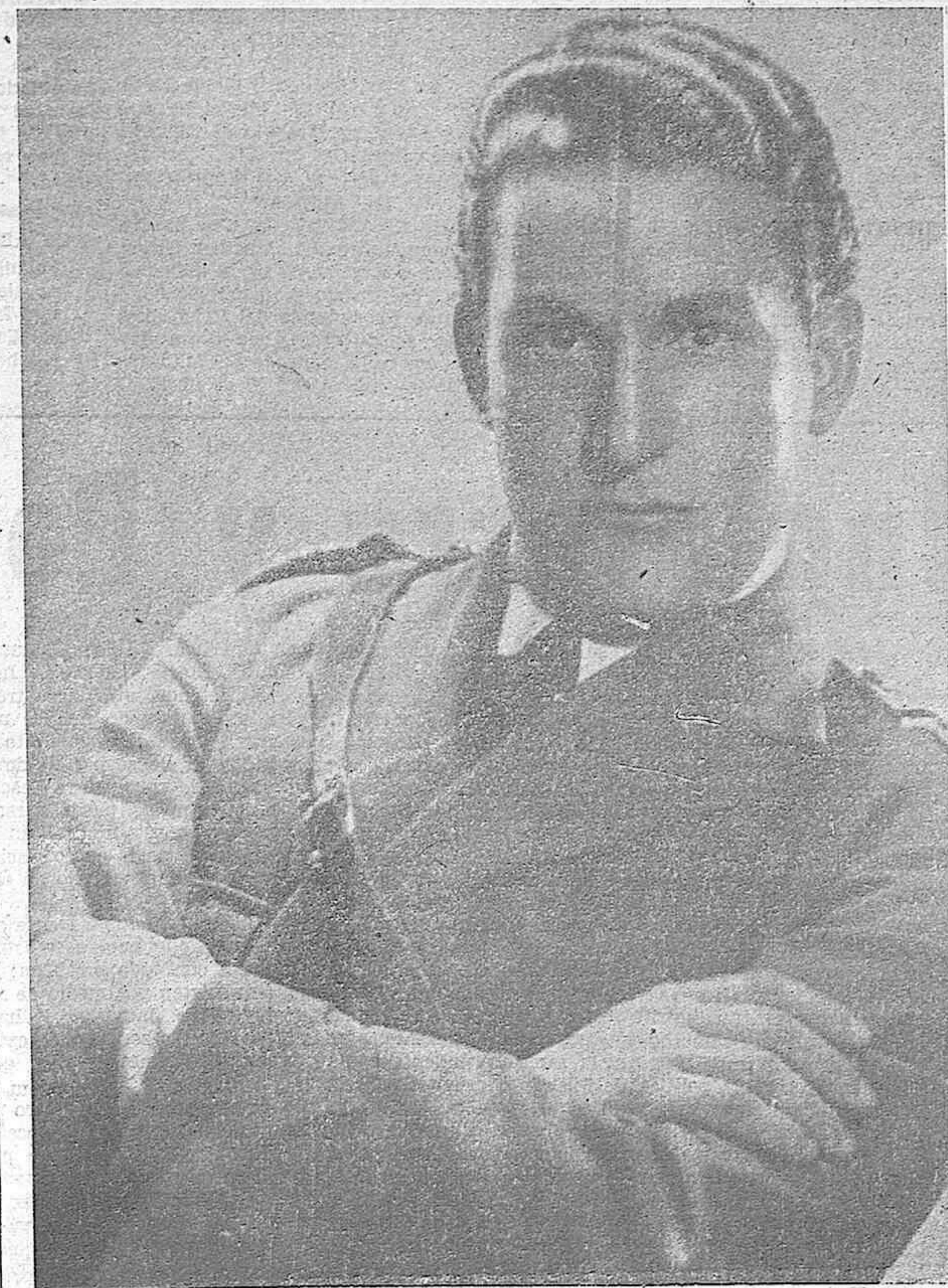
PEDRO TEROL, DIVO BARITONO POPULARISIMO Y ADMIRADO