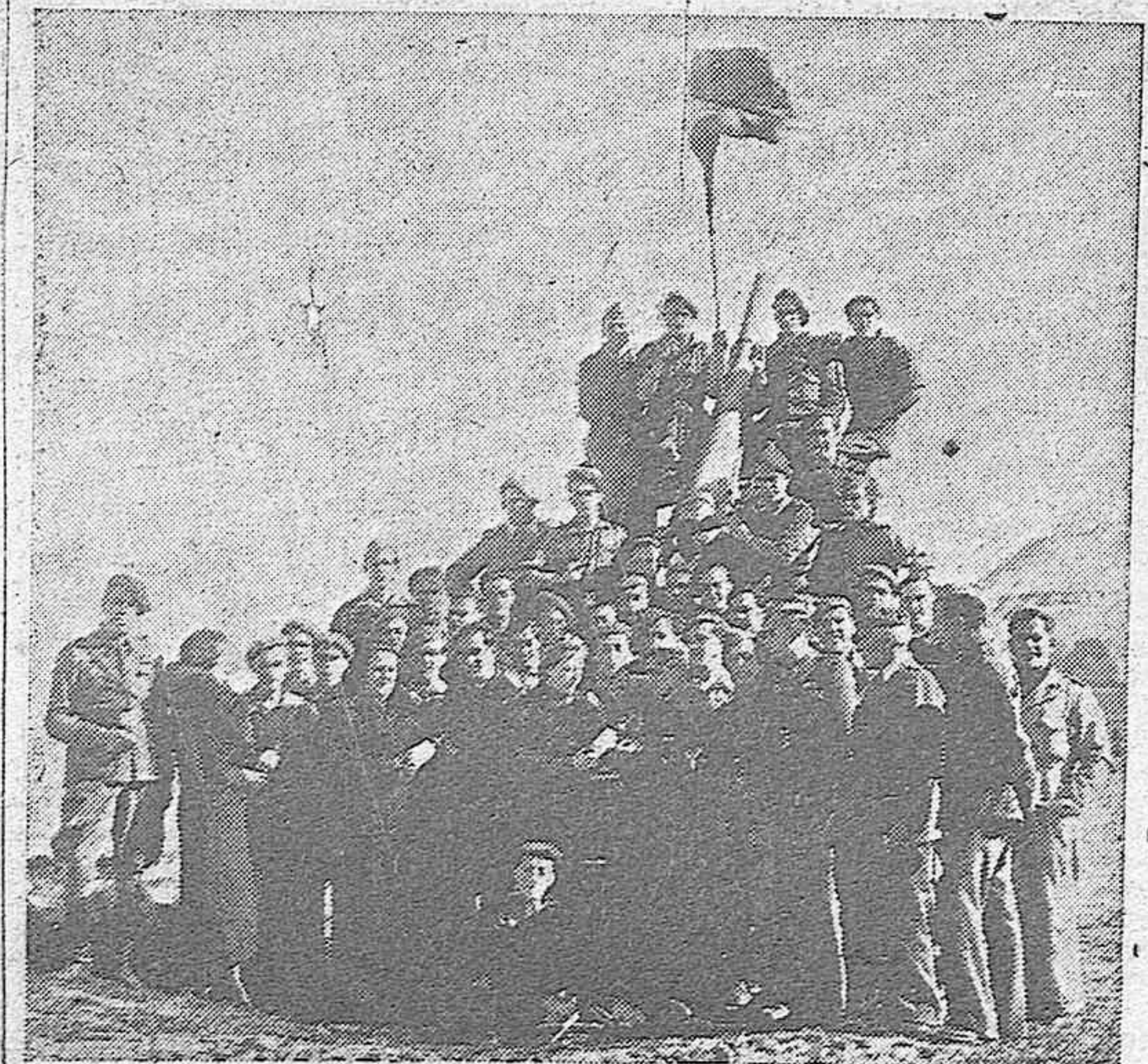
En el mismo campo donde están instaladas las piezas antiaéreas, los muchachos que las sirven fueron obsequiados el domingo por una representación de Fraternidad y Hospitales