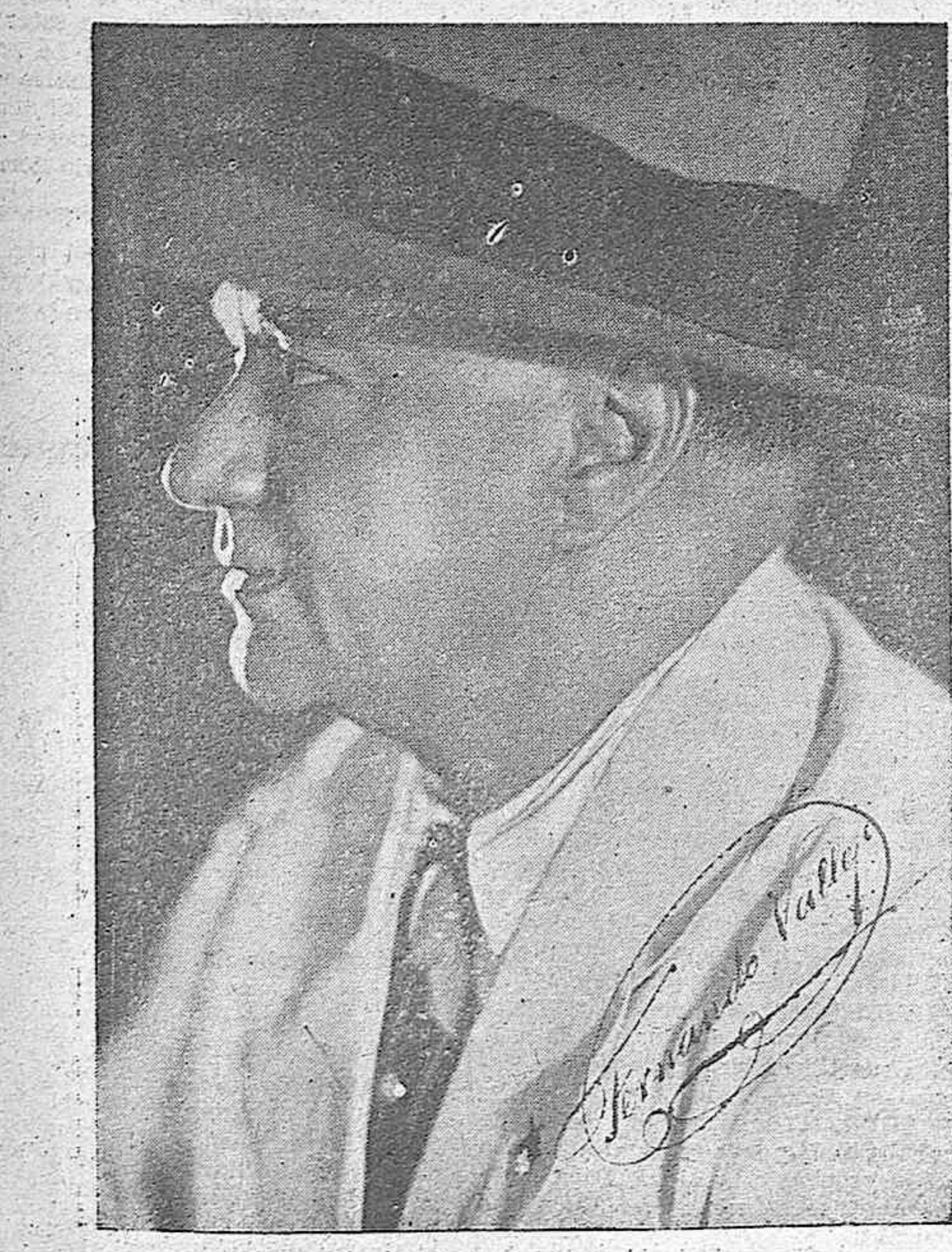
EL GRAN ACTOR FERNANDO VALLEJO