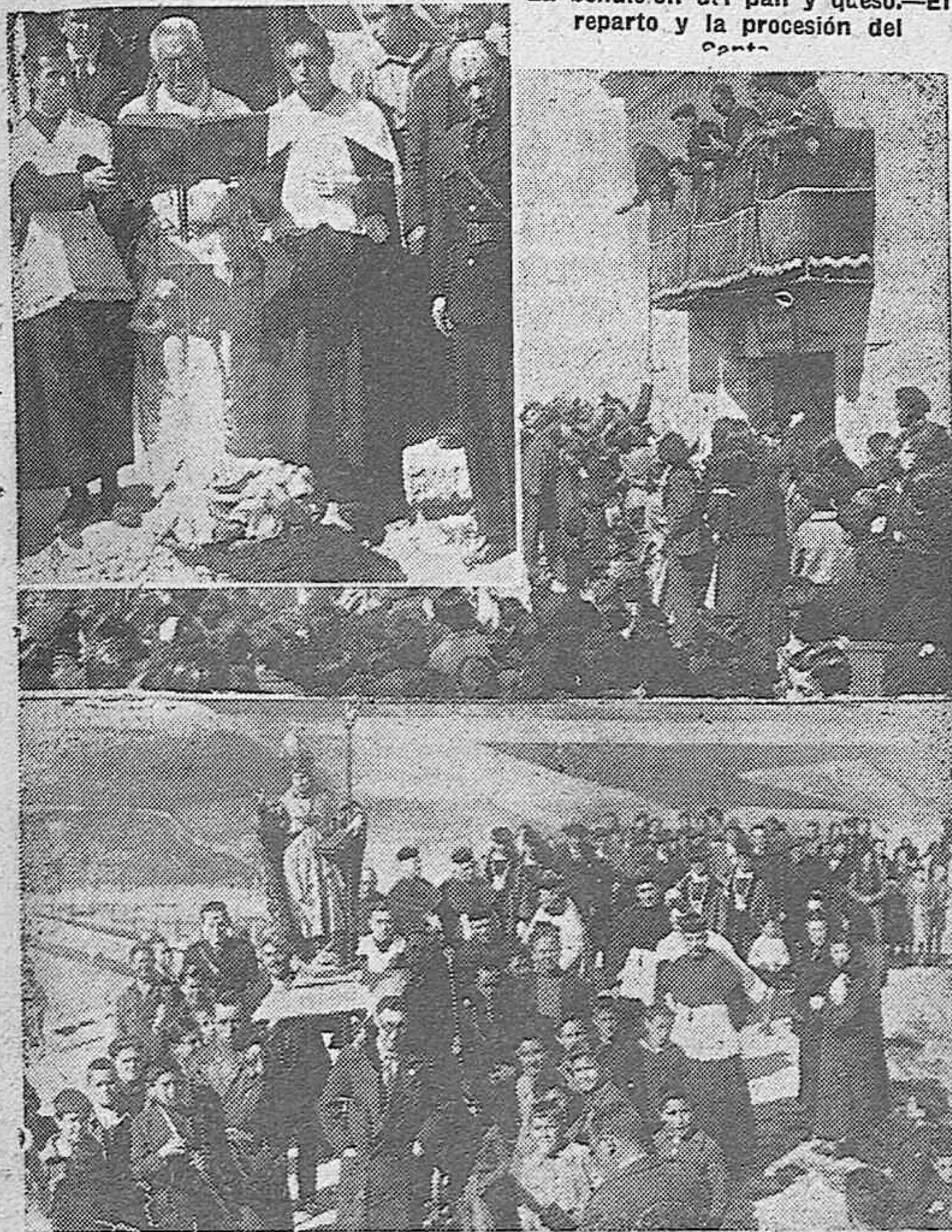
La bendición del pan y queso.—El reparto y la procesión del Santo