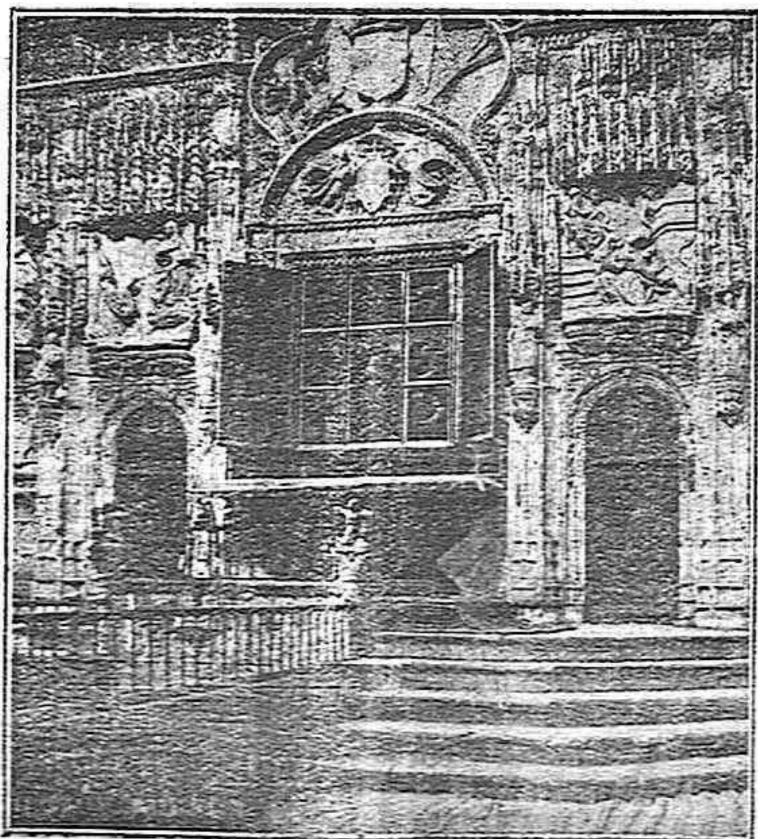
Catedral.— Su Trascoro

De esperar es que con el tiempo y cuando la situación del Ayuntamiento lo permita, se lleve a cabo obra de tanta importancia.