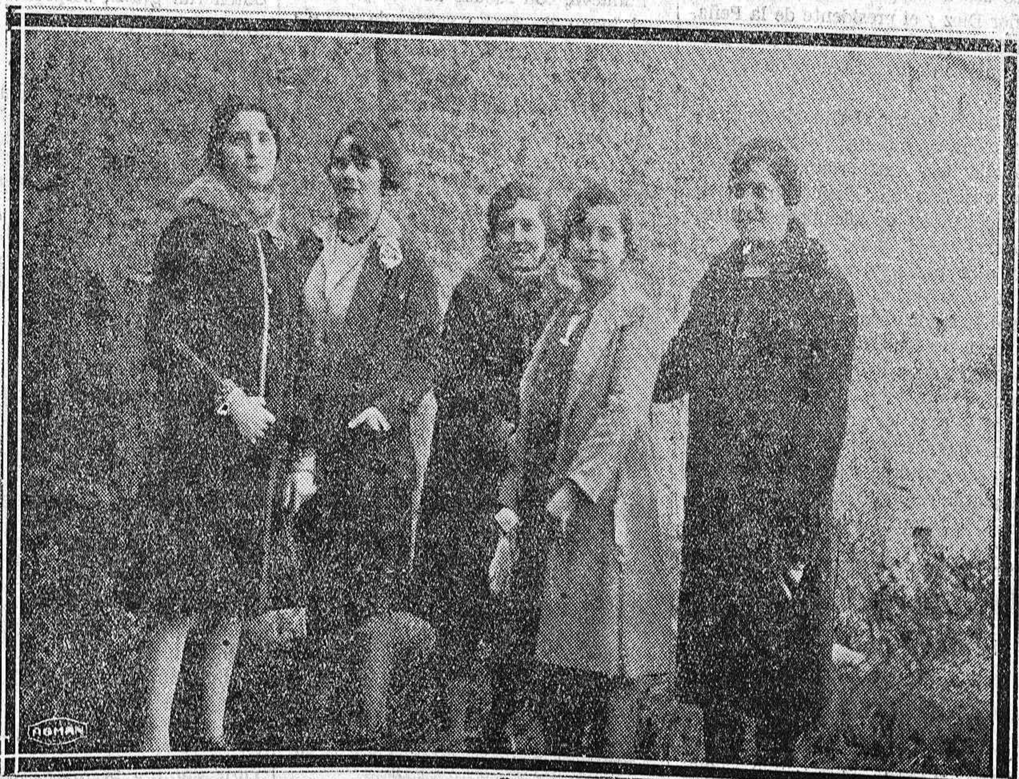
Grupo de distinguidas y bellas señoritas de Becerril

Y nosotros nos cansamos de pedir, por desgracia, vanamente, que se pusieran los medios para hacer que mereciera la pena cultivar trigo, asegurando al agricultor un precio que compensara su trabajo. Porque el secreto de todo está aquí. El trigo, al precio a que se le sujetó, en vez de negocio es ruina.