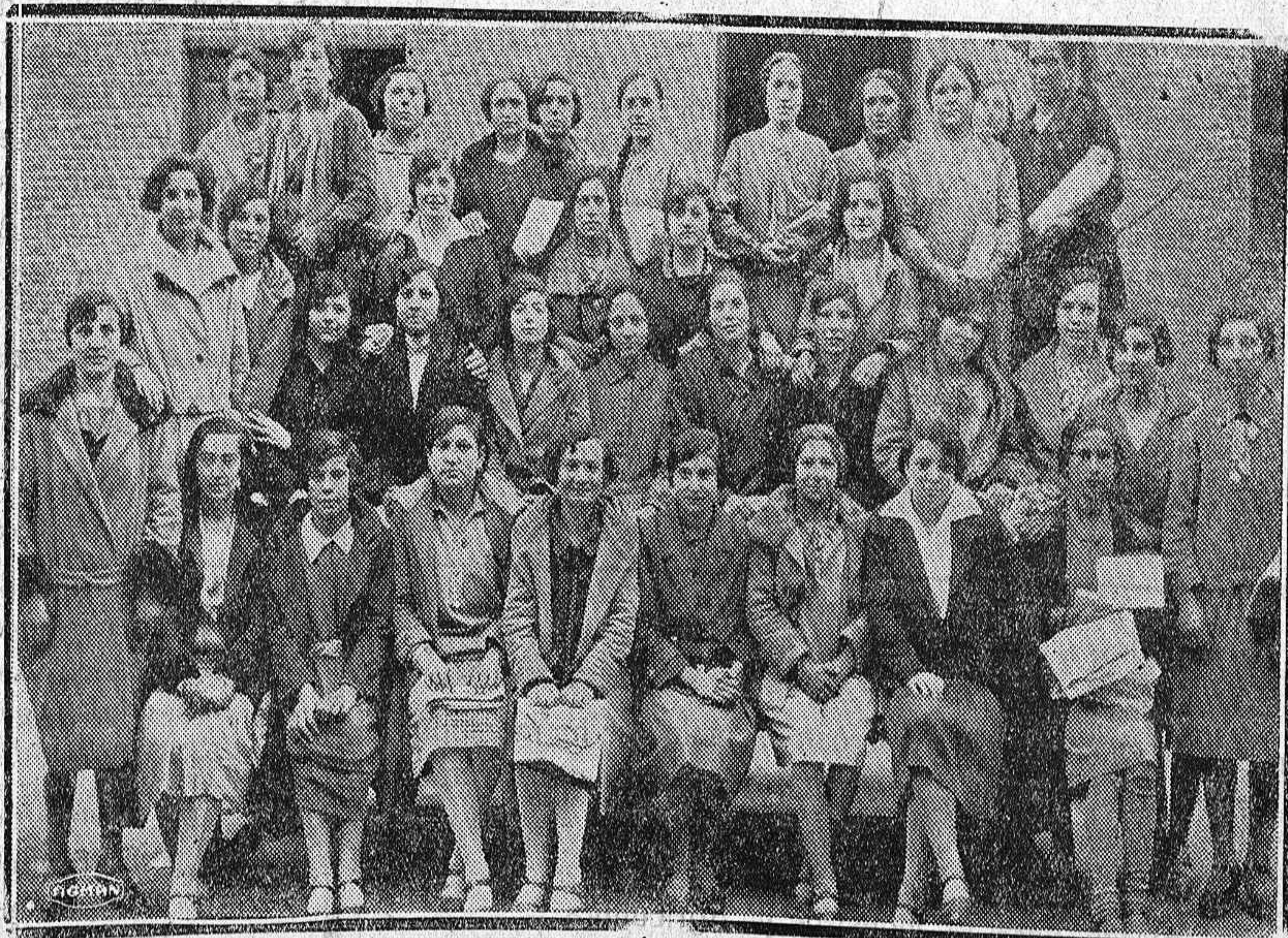
Grupo de alumnas premiadas que concurren a las Escuelas de San Miguel.

Situación de los sembrados, buenos, pero están sufriendo con las heladas y hace falta agua para las labores de alzada.