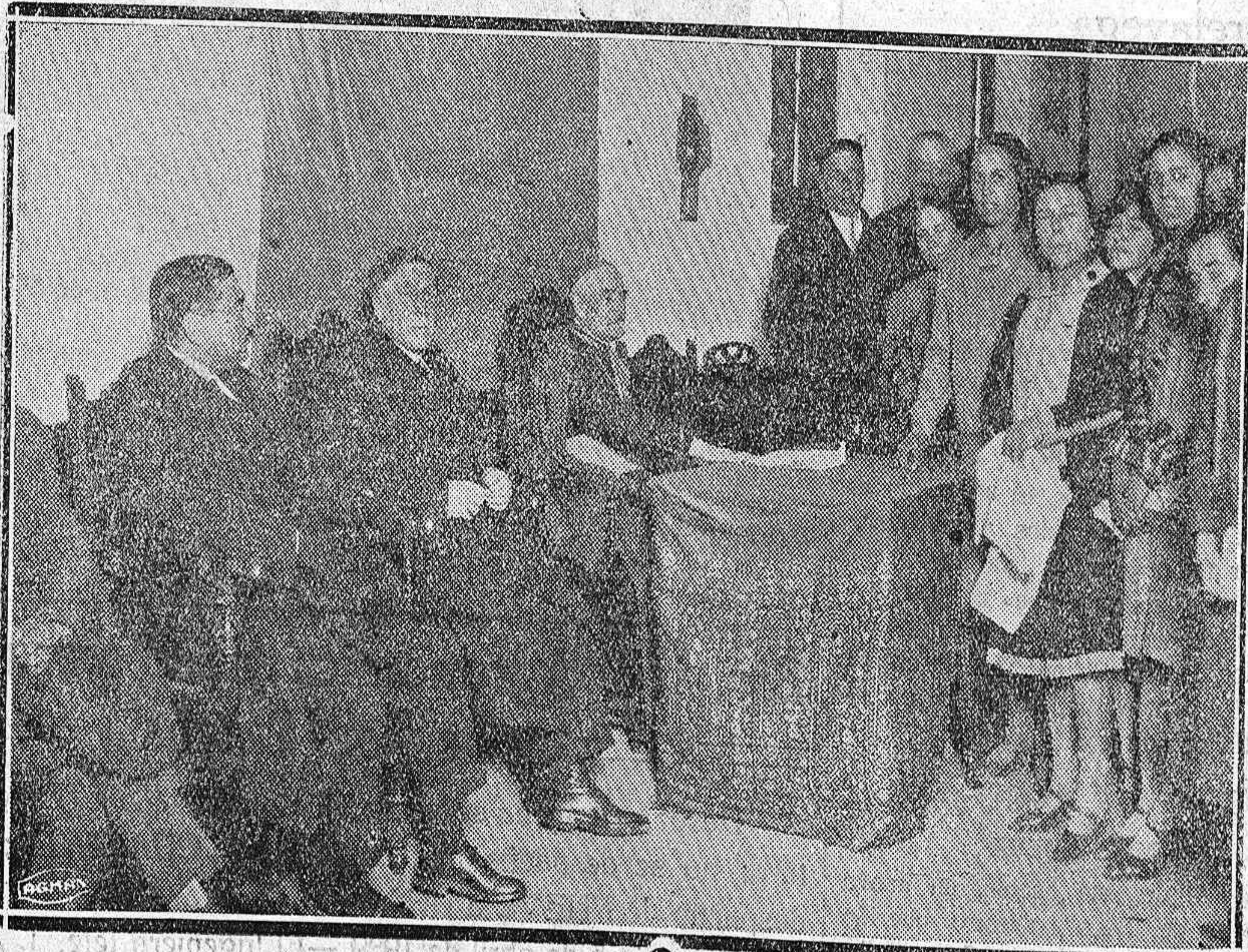
Un momento del reparto de premios en las Escuelas de San Miguel.

Calle Don Sancho, esquina a Mayor Principal, Palencia.