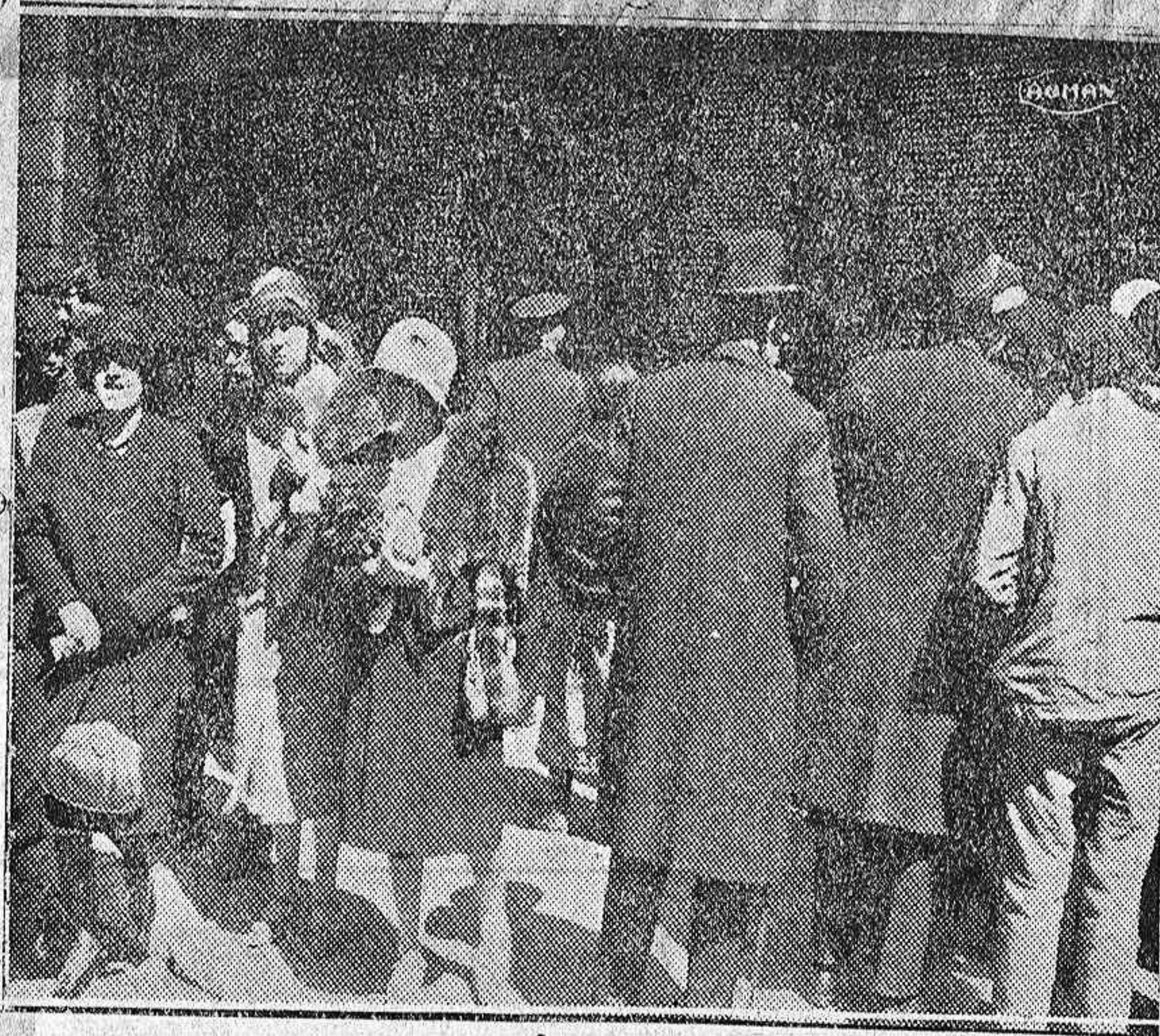
La protesta contra la campaña antiespañola.—Público estacionado ante las puertas del Gobierno civil para firmar.

Ah, claro está, los periódicos...! Richet, que se atreve a tanto, que siempre se atrevió a tanto, no se atreve a asegurar que en la clase periodística abundan demasiado los bribones. Nos atrevemos nosotros, que hemos convivido desgraciadamente con periodistas yanquis, suramericanos, franceses, portugueses, españoles, indignos de ostentar un título que siempre entendimos que debía envolverse en las mayores perezas. Unas veces el ansia de «epatar», otras la de atraer la atención, otras la de alcanzar alguna beca y otras la de juntar algún dinero, apartan al periodista del camino rectilíneo de escrupulosa honradez y de absoluta sinceridad a que le obligan las sagradas responsabilidades de su cargo. Detrás de los periodistas, se agolpan infinitas sugerencias que intentan arrastrarle a la claudicación; el resistirlas, el pasar sobre ellas, el latiguarlas, si preciso fuese, exige eso que ahora escasea tanto, que cuesta tantos disgustos y que condena anticipadamente a la mediocridad torva y oscura; exige el tener carácter.