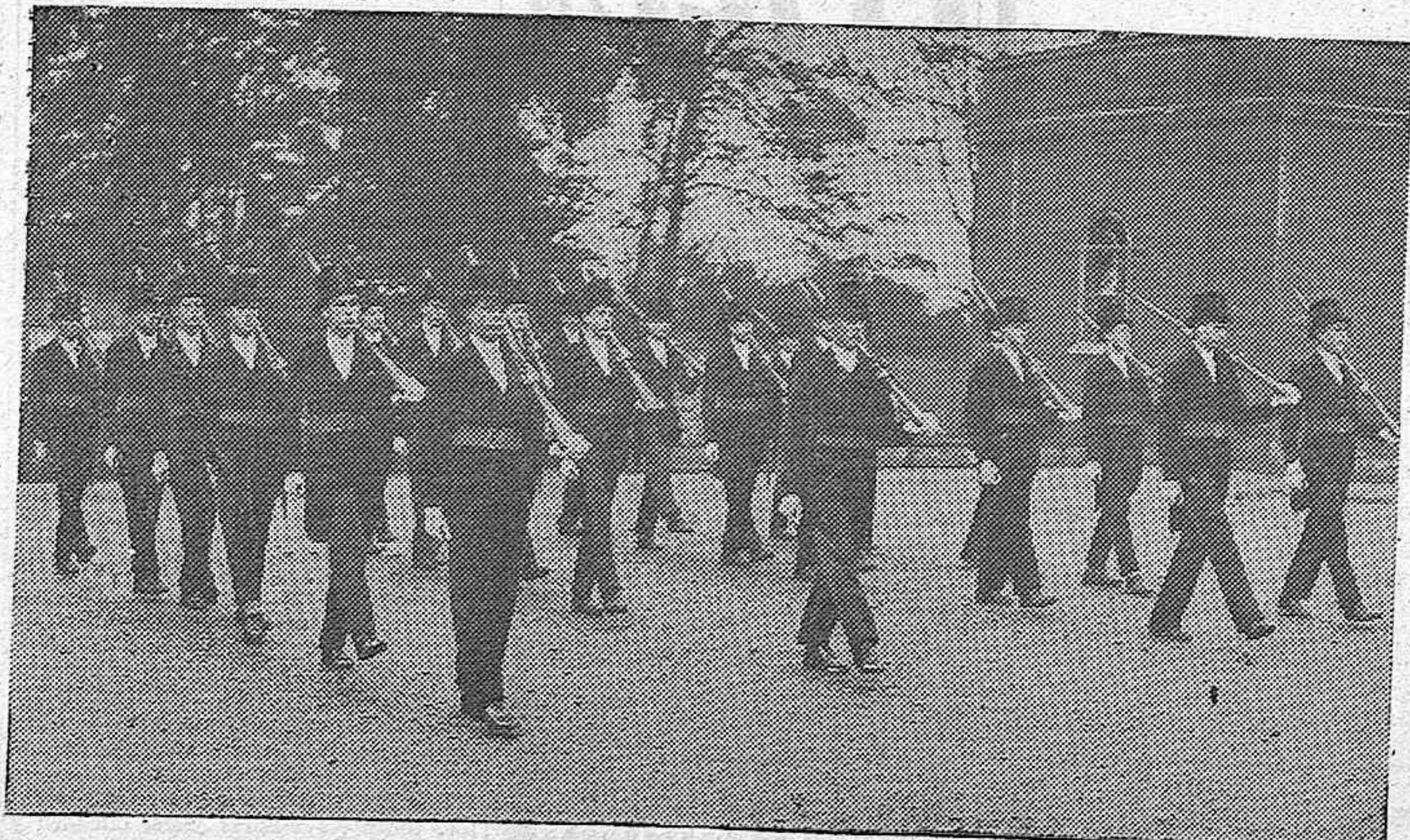
Mientras los confeccionan sus uniformes correspondientes, los alumnos del aristocrático colegio inglés de Eton, que inician la instrucción militar ofrecen en su pintoresco establo el singular contraste que forman la clásica chistera y el imprecindible fusil