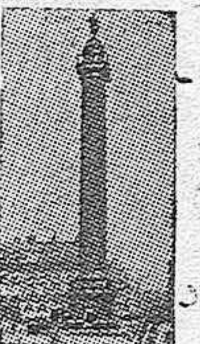
La columna Vendôme

El monumento quedará cubierto por quince mil sacos de treinta kilos de arena cada uno.—EFE.