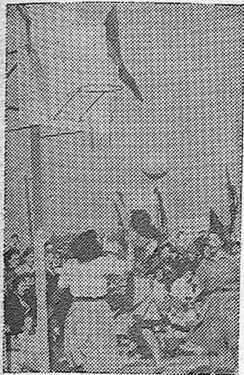
Un momento del partido final de baloncesto (Sección Femenina), en el que el equipo de San Sebastián batió al de Madrid.

Se autoriza la ratificación del tratado anglo-franco-turco