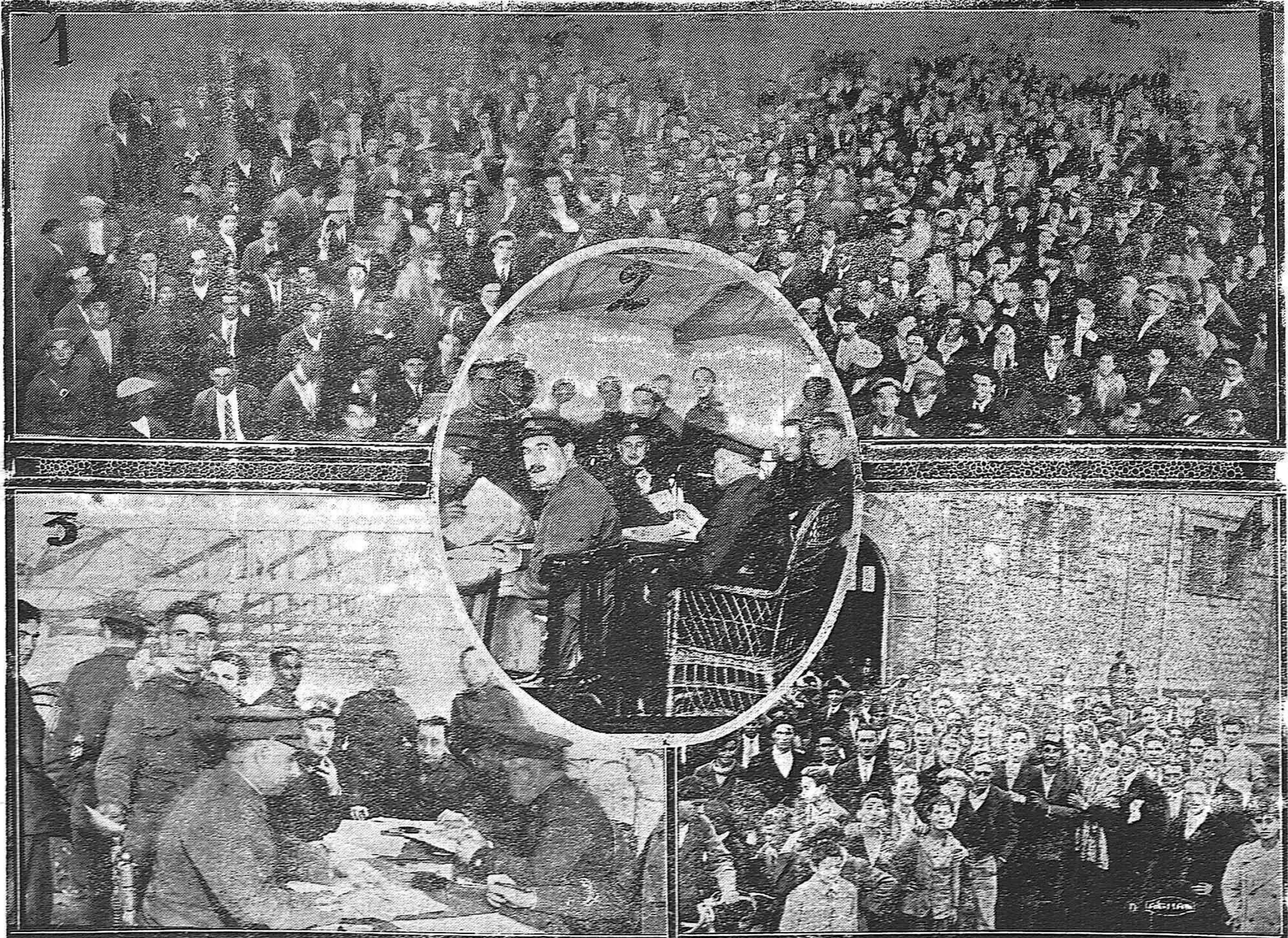
EL SORTEO DE RECLUTAS.—Jefes y Oficiales que presidieron el acto.—El momento de la "sortea".—Los reclutas presencian ansiosamente el sorteo.—Un grupo de mozos a la salida del cuartel de Alfonso VIII después de verificado el acto.