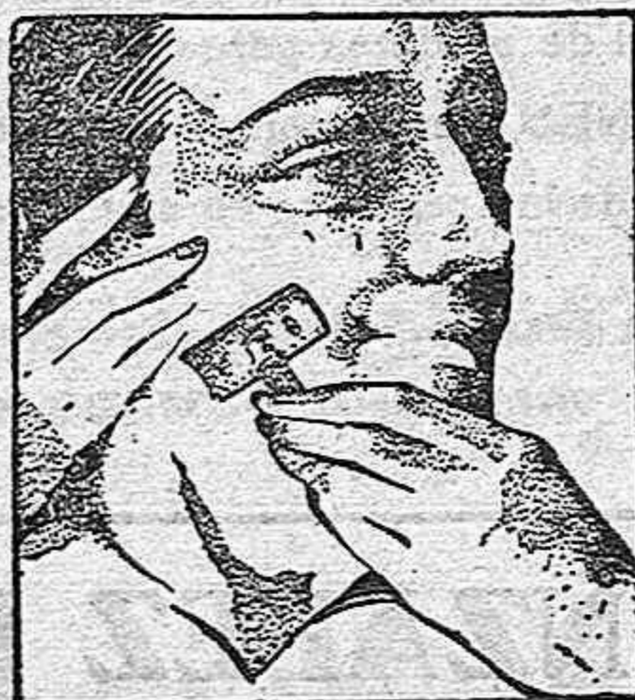
Una rápida pasada y listo para el día

LA PERSONALIDAD es un factor esencial en todos los órdenes de la vida. Para todos los que descuellan, el afeitado diario es tan importante como cualquier otro detalle de la higiene personal. ¿Es blanda su barba o dura? Use hojas Gillette legítimas y obtendrá un afeitado rápido y suave.