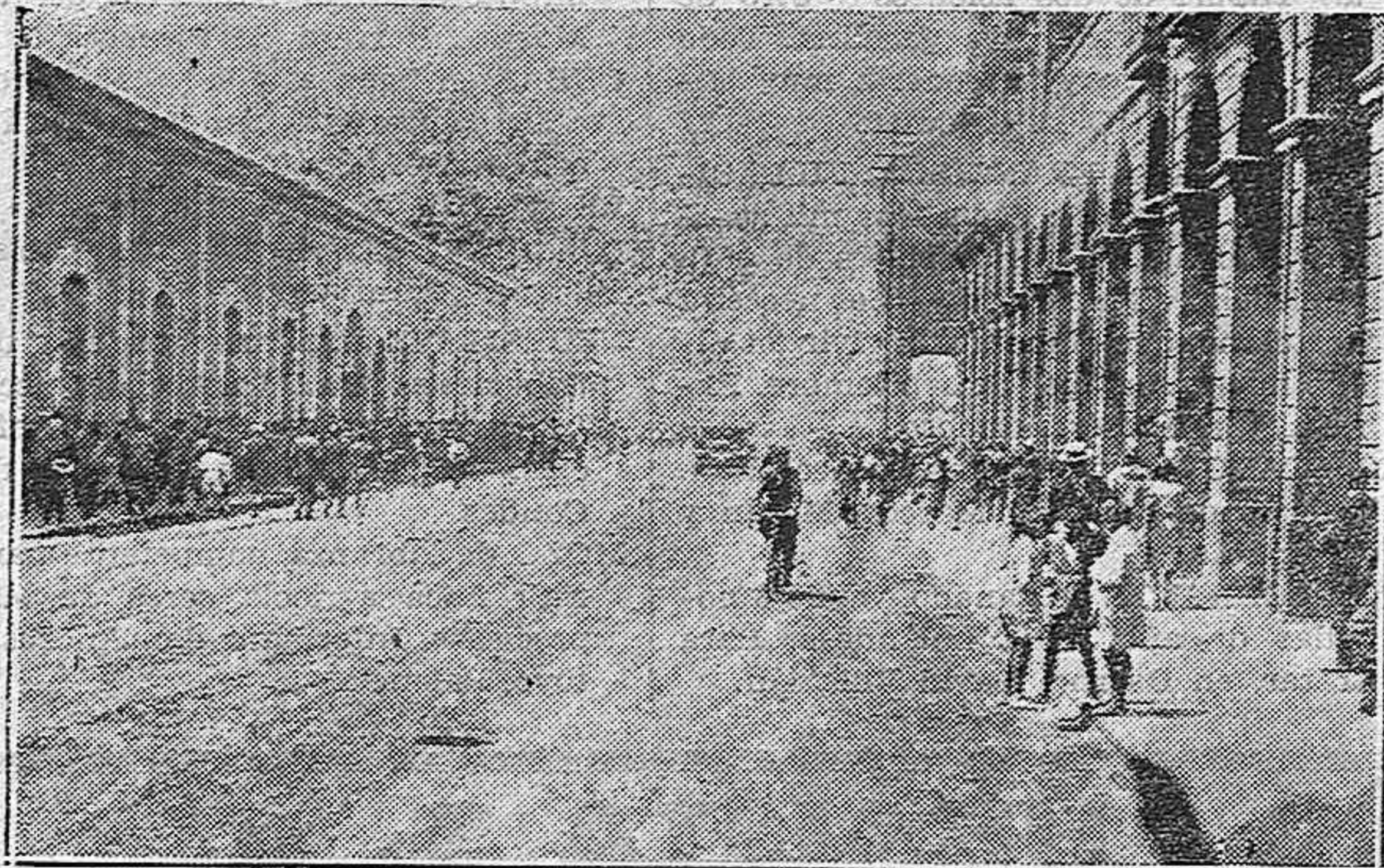
Gijón.—Desfile de viajeros del tren especial por la calle del Marqués de San Esteban

Entre los festejos que se proyectan, habrá corridas de toros, festivales deportivos y verbenas en la Huerta de Guadián y Plaza Mayor, iluminándose la fachada del Ayuntamiento con profusión de bombillas eléctricas.