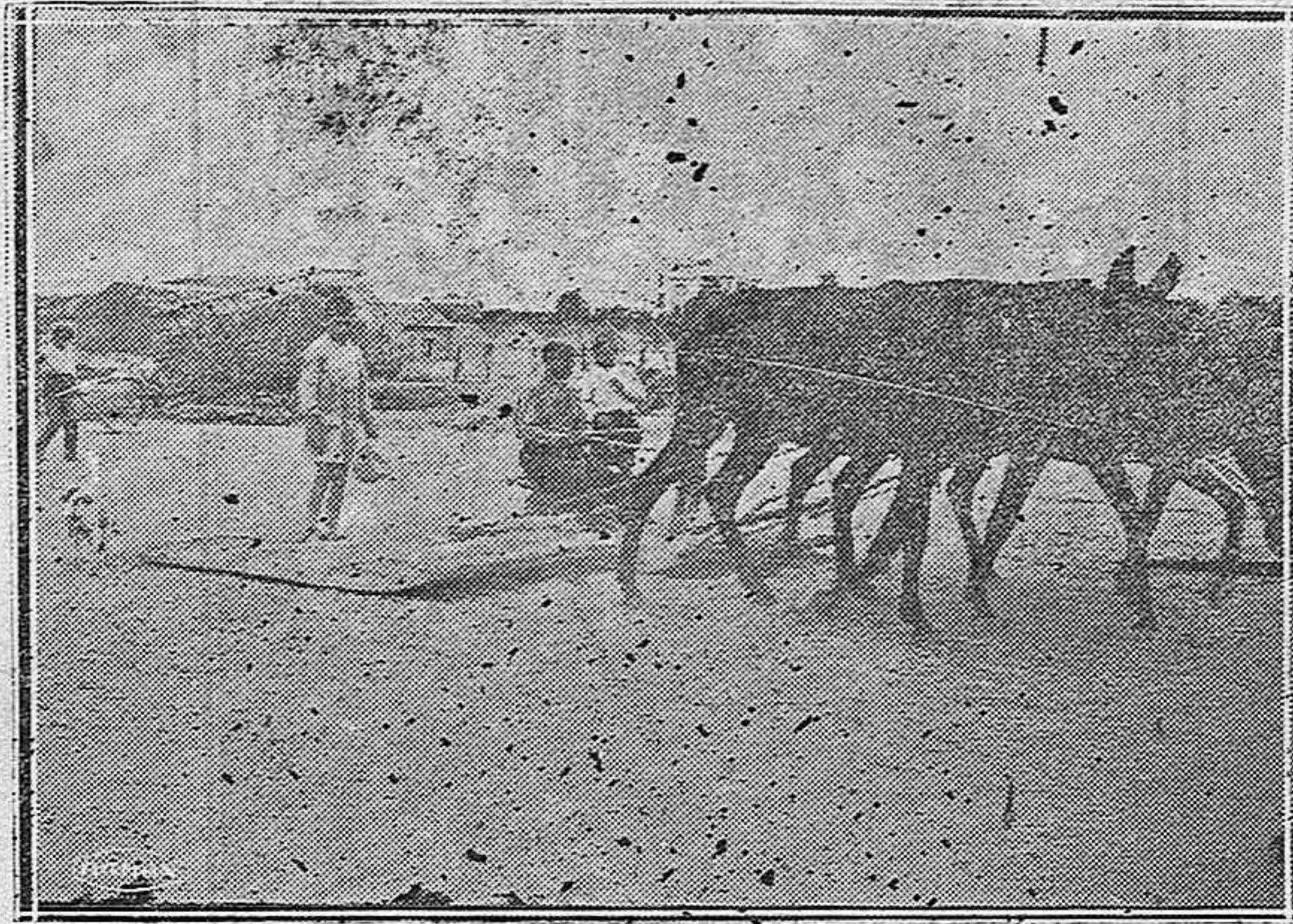
Del campo.—La trilla.