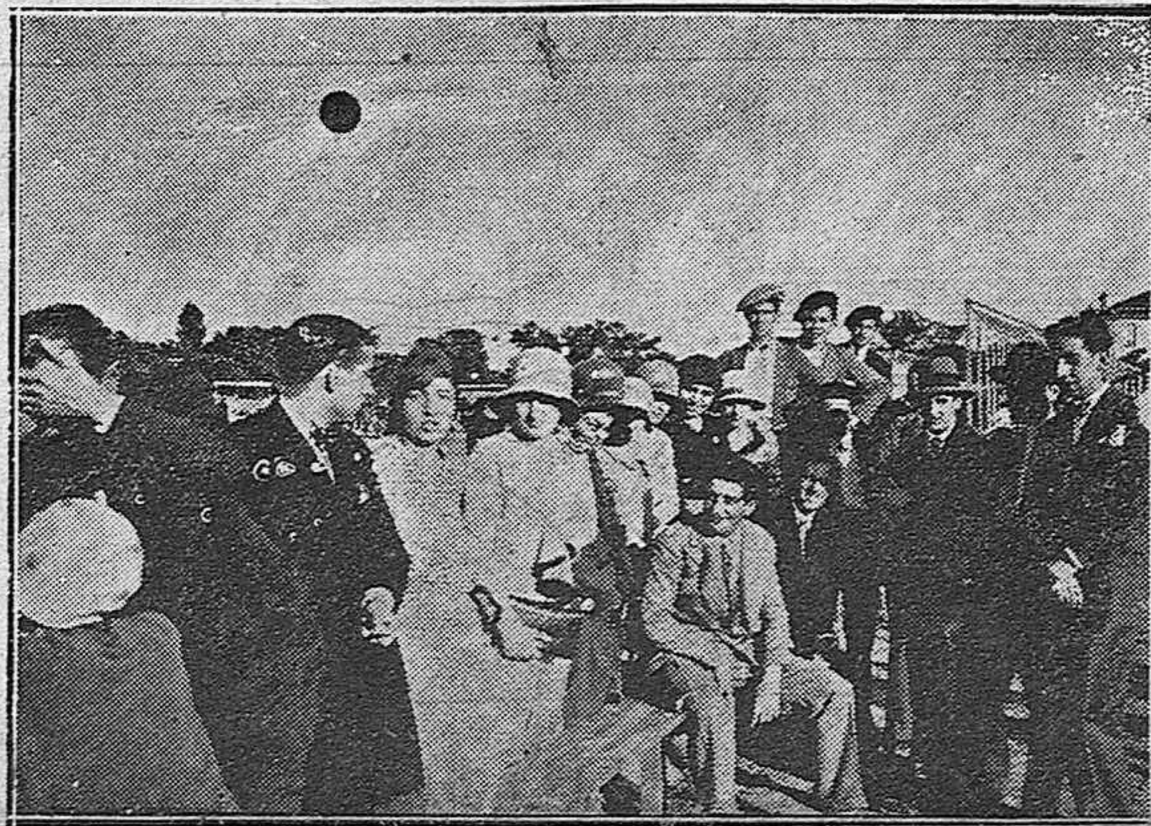
Del partido del domingo.—Un aspecto de las tribunas.

—Por Cervantes...! Por amor...! Y no fué comprendido Don Quijote cuando apareció en su tiempo; de si se le comprende en este tiempo, hemos de tener la prueba en esta suscripción que se va a abrir.