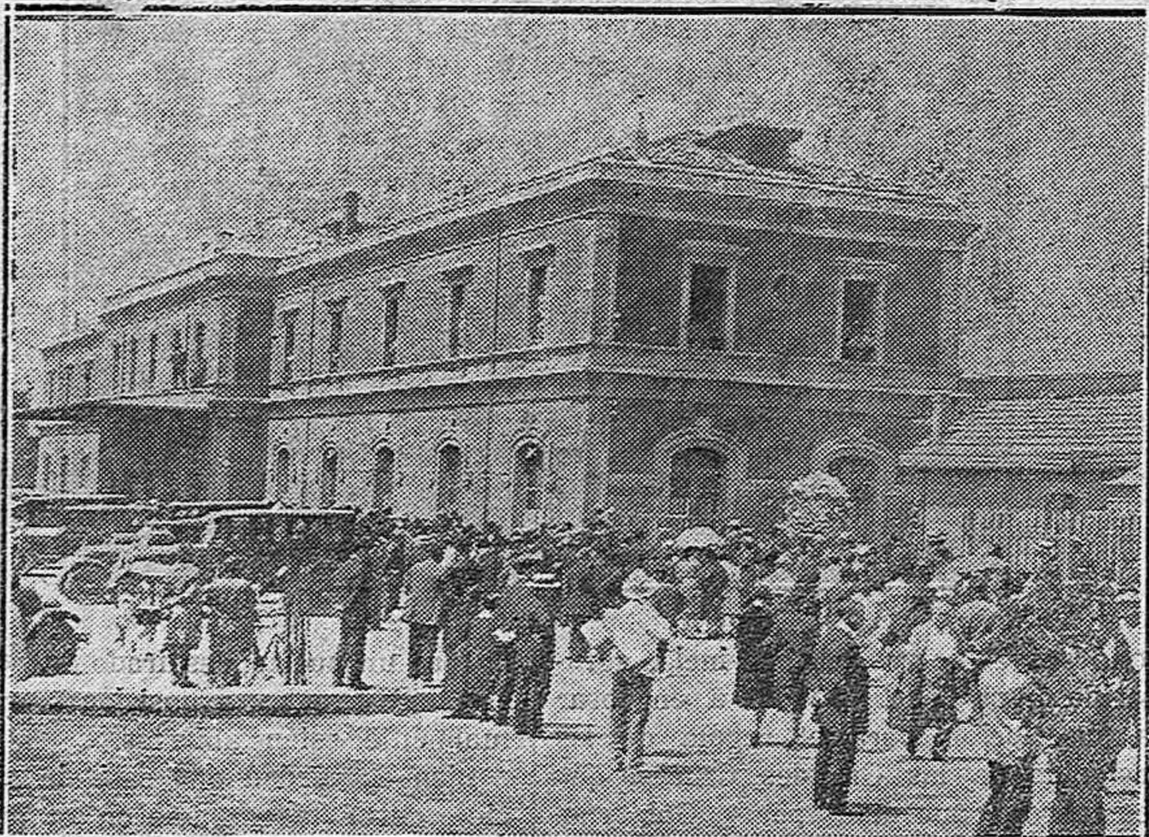
Gijón.—Llegada de un tren especial, en el que fueron varios palentinos