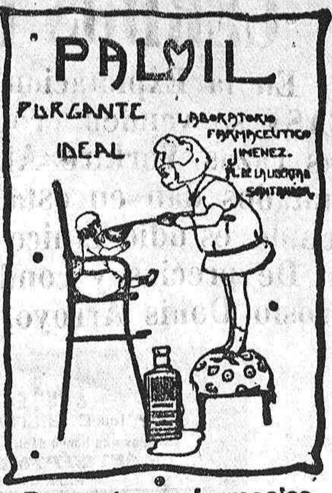
De venta en farmacias y droguerías.