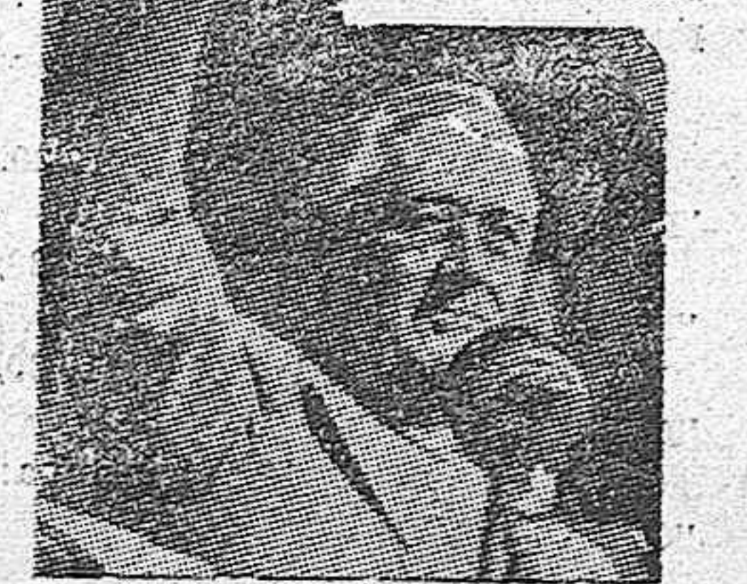
ROOSEVELT EN UNO DE SUS CARACTERISTICOS DISCURSOS PACIFISTAS Y DEMOCRATICOS

El Presidente Norote americano que hace unos días se encuentra enfermo y que ha tenido que suspender el banquete que tenía preparado en honor del ministro brasileño, Arnanhat