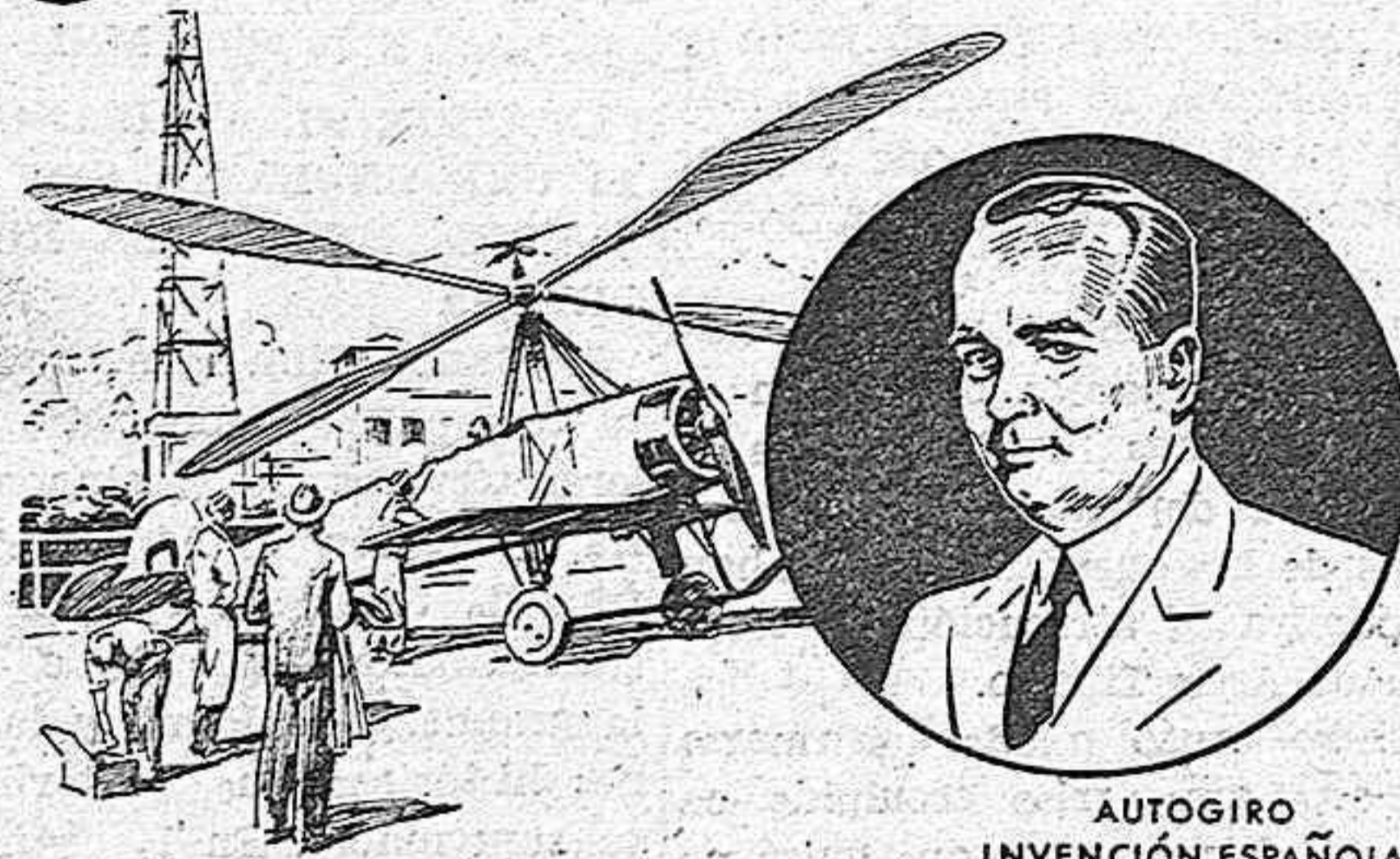
AUTOGIRO INVENCIÓN ESPAÑOLA JUAN DE LA CIERVA 1895-1936

Todos los grandes inventos son fruto de ideas luminosas. Existen en el universo materias y energías, que utilizadas con el acierto de una feliz idea producen efectos asombrosos. He aquí el secreto de la INSTANTINA, combinación especial de eficacísimos elementos terapéuticos, inocuos y seguros, que cortan con la máxima rapidez los resfriados y sus consecuencias así como toda clase de dolores.