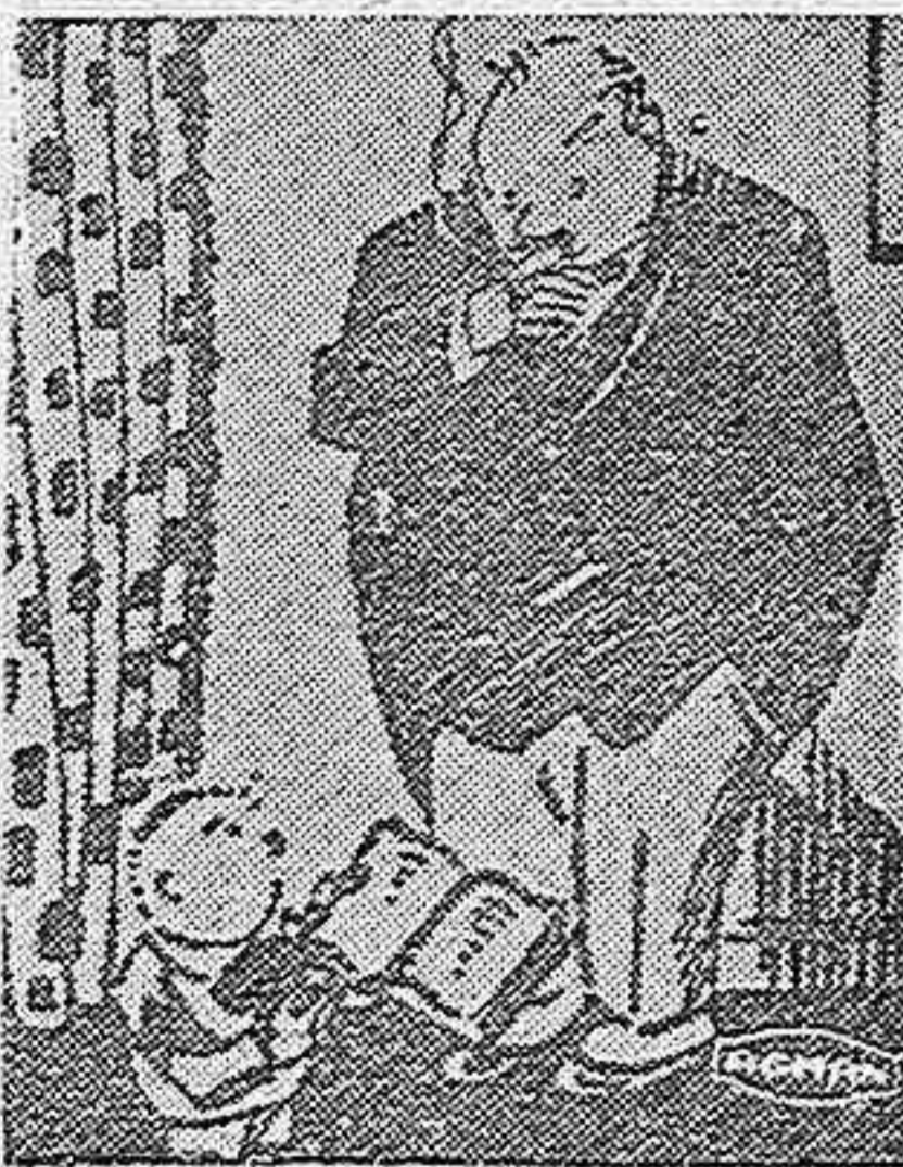
EN LA ZONA ROJA

HORIZONTALES: 1. Pueblo de esta provincia de Palencia. 4. Papagayo que da gritos agudos y desagradables. 5. Avenir bien una persona con otra. 7. Ciudad de Francia a orillas del Mediterráneo. 8. Pequeño valle. 9. Renacuajo de Guatemala. VERTICALES: 1. Pueblo también de esta provincia de Palencia. 2. Divinidad pagana griega. 3. Plato vistoso de dulces que forman un conjunto elevado. 4. Armadura del pecho. 6. División interior de ciertas frutas. 8. Hembra de mamífero rumiante.