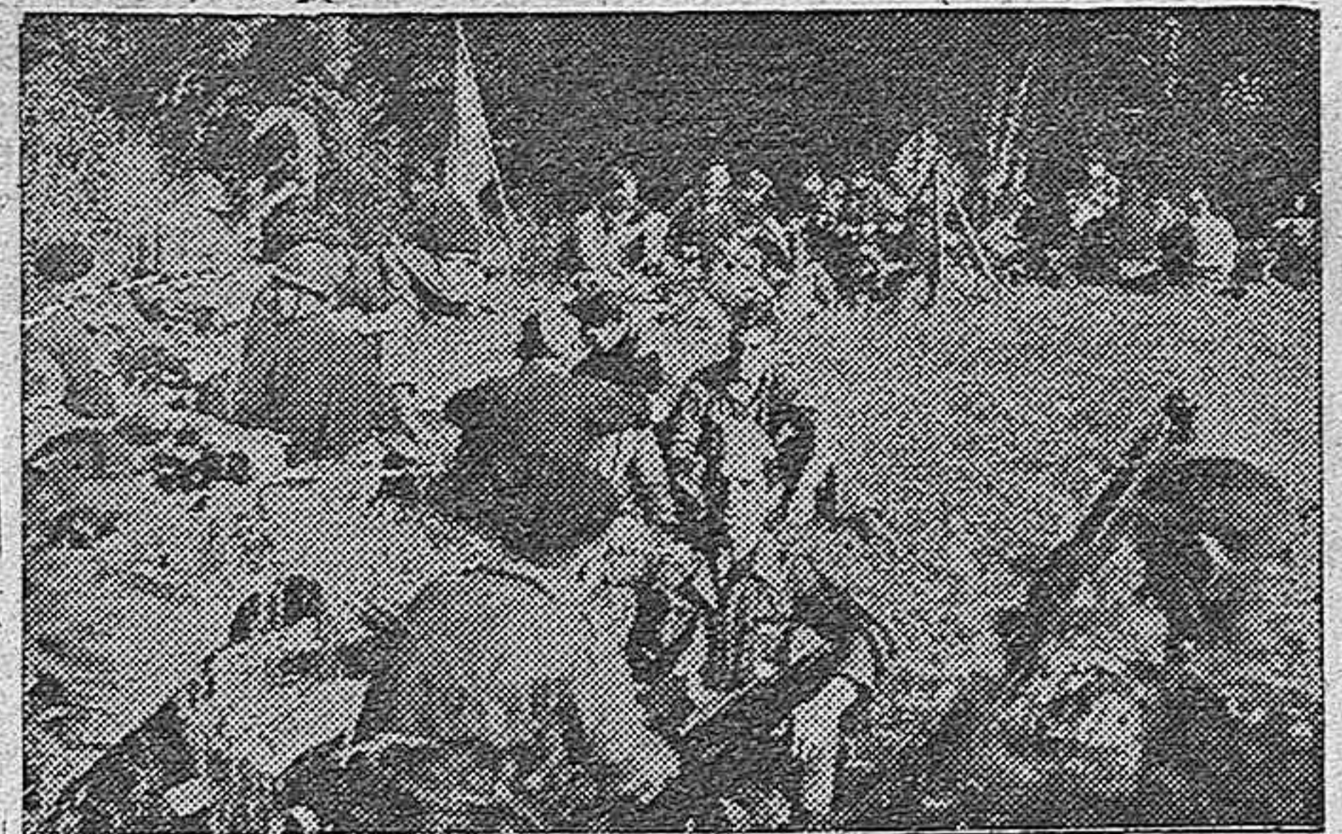
NUESTRAS BRIGADAS NAVARRAS DESCANSAN UNAS HORAS PARA CONTINUAR SU ARROLLADOR AVANCE POR TIERRAS DE CATALUÑA