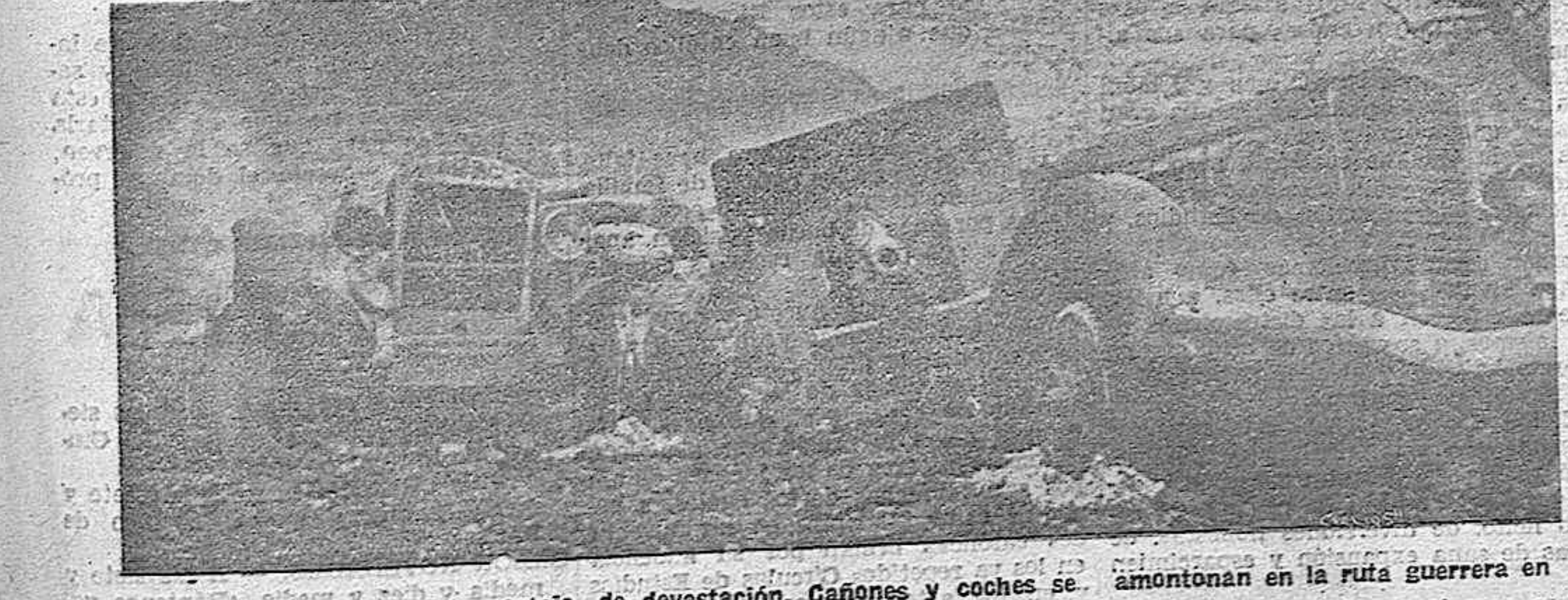
Ha pasado la guerra con su cortejo de devastación. Cañones y coches se amontonan en la ruta guerrera en informe montón de chatarra