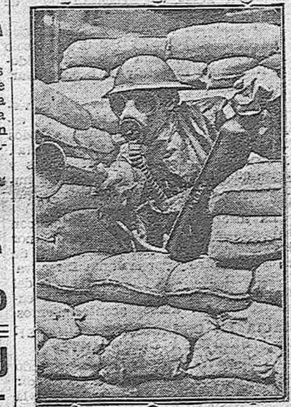
Fuerzas inglesas provistas de caretas antiguas acechan los movimientos del enemigo, provistas de los novísimos lanzallamas