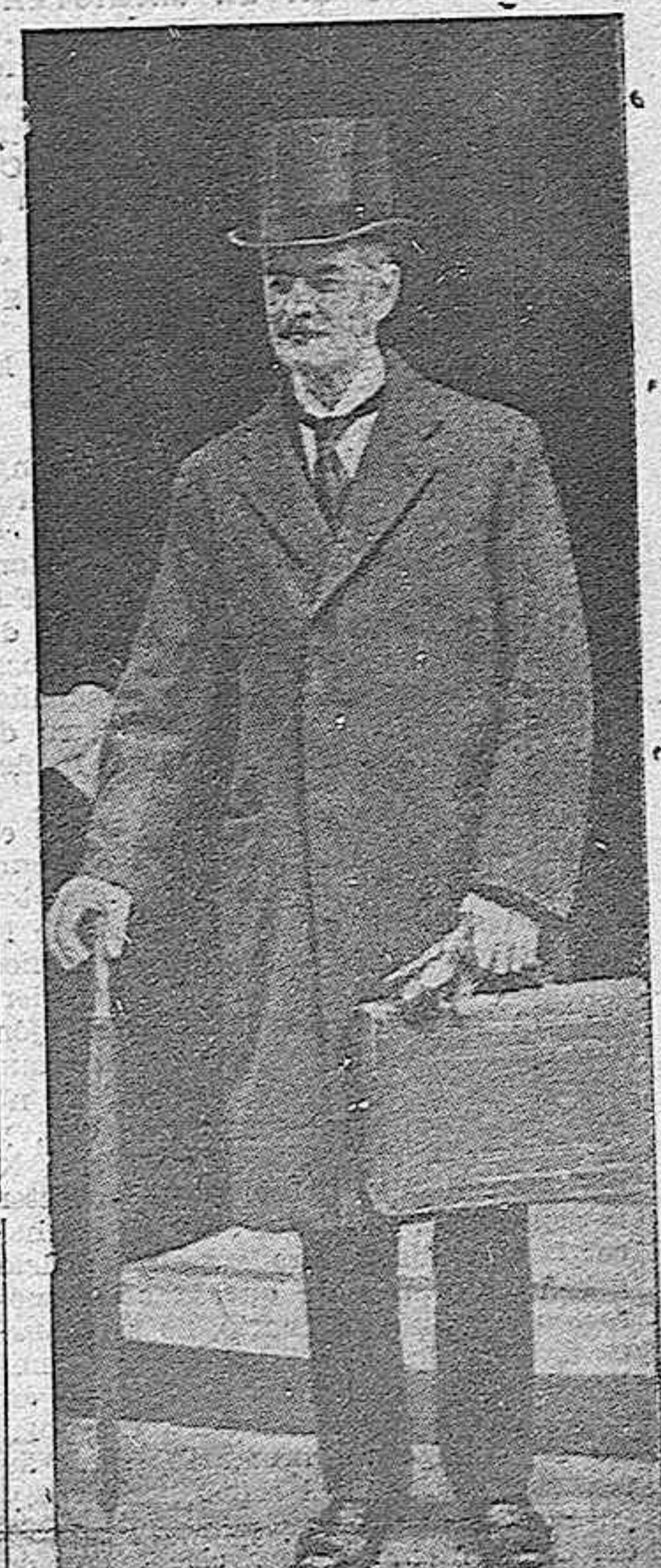
ROMA, 27.—Llegan informaciones de Londres diciendo que en los centros políticos y parlamentarios se discute abiertamente la posibilidad de que dimita su cargo el jefe del Gobierno Chamberlain, y que se reorganice el Gabinete británico.

MOSCU, 27.—Anunciase que la visita de von Ribbentrop a la capital rusa durará hasta el sábado próximo día 30, teniendo en cuenta que tratará de cuestiones muy complejas, que requieren tiempo considerable para resolverlas.