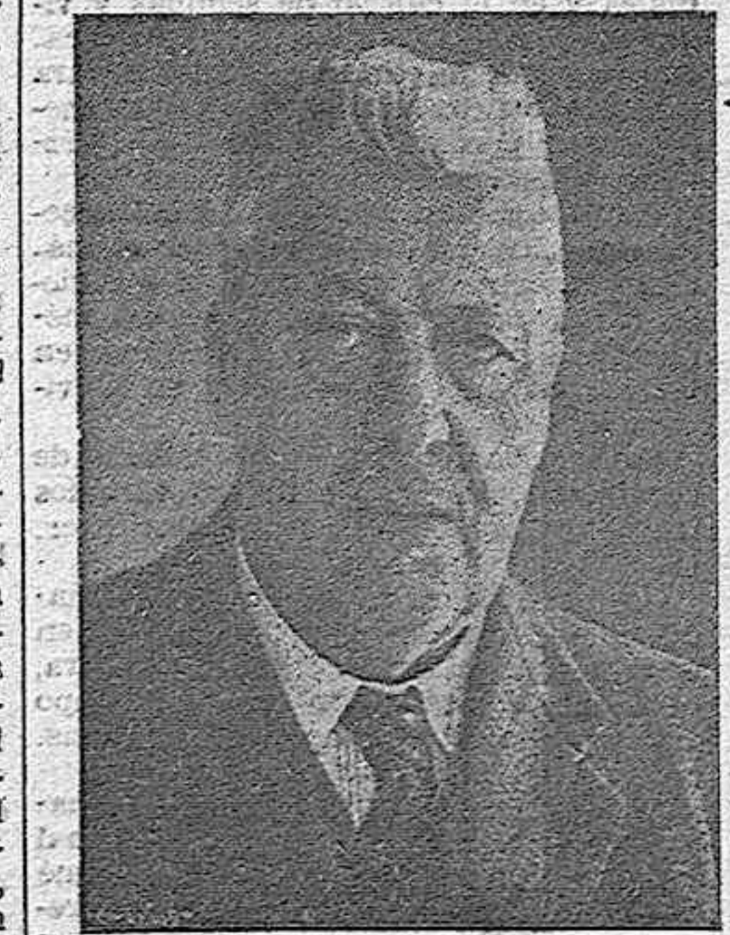
El doctor Eckener, jefe de los astilleros de Zeppelin, donde está acelerándose la construcción de estos titanes del aire. Entre el fragor de la guerra, el Zeppelin tiene un importante papel. ¿Cuál será en el conflicto actual?