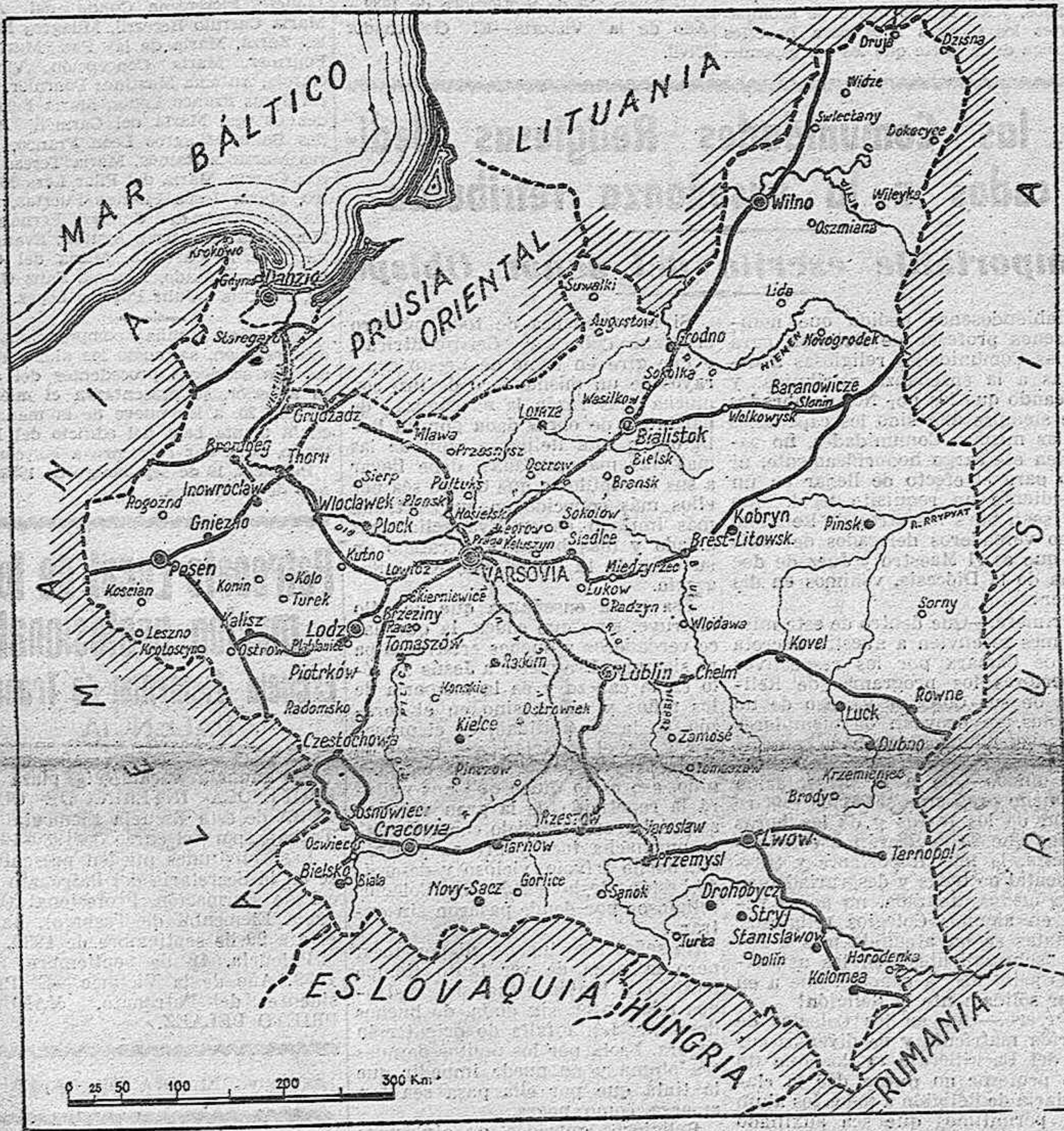
A punto de ser vencidas las resistencias aisladas que el Ejército polaco opone, pueda darse por concluida la guerra germano-polaca. Observemos en el gráfico que las tropas rusas, habiendo rebasado las fronteras, han ocupado Wilna, sin que las noticias recibidas acusen oposición polaca. En el Sur, los Ejércitos alemán y ruso han establecido contacto en Lvov, quedando así cerrada toda posible comunicación con Hungría y Rumania. El Ejército polaco, no obstante su comportamiento, queda en el interior a merced de los vencedores. Ni un soldado, ni un cañón podrá escapar.

El discurso de Hitler es un llamamiento a la paz