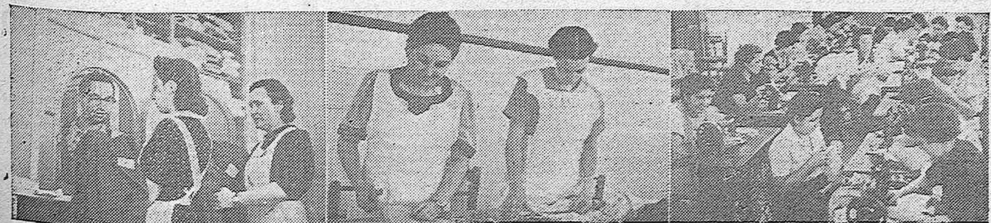
Las camaradas de la F. E. T. y de las JONS desempeñan los más diversos cargos. He aquí tres aspectos de las mujeres de la Nueva España.