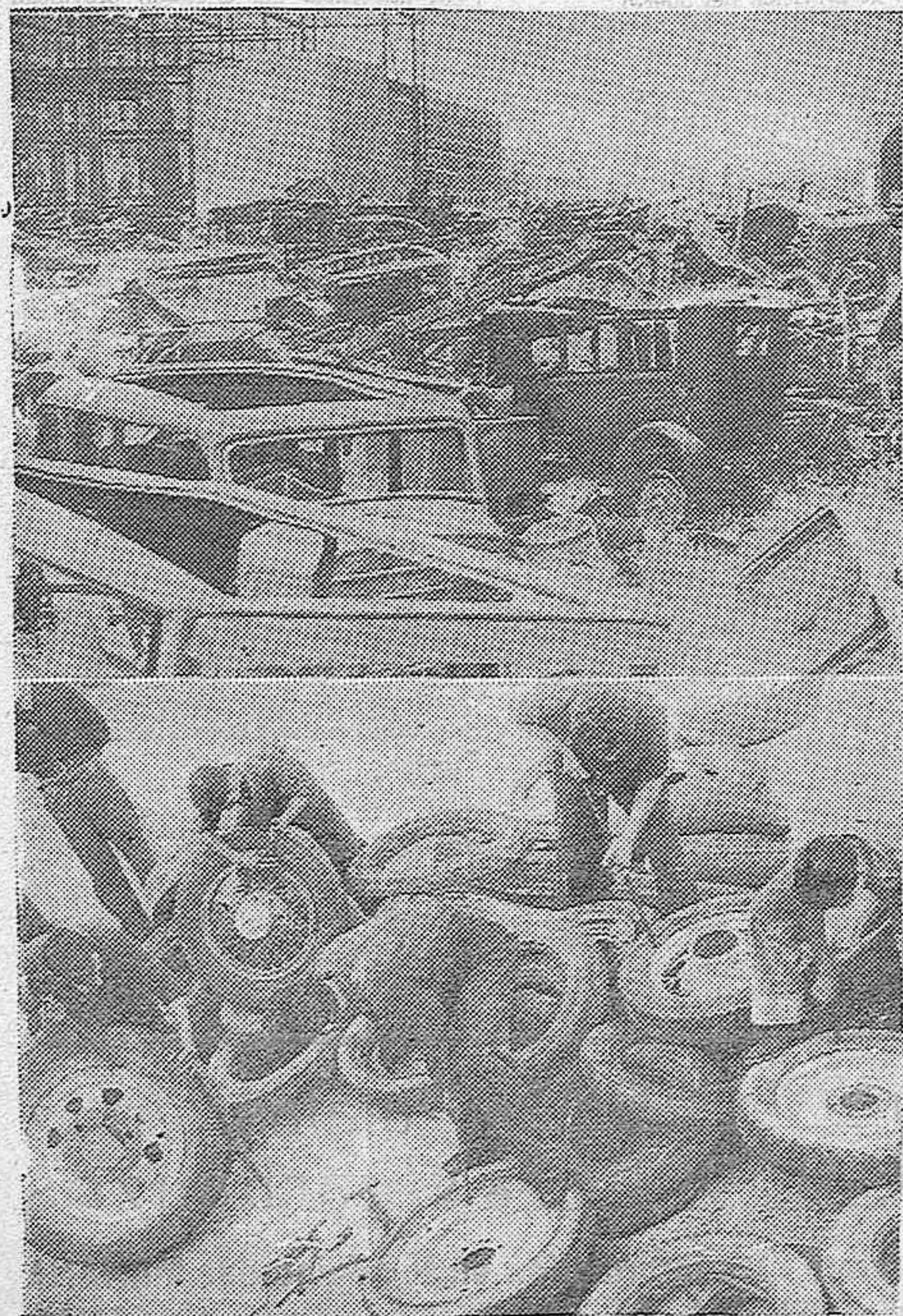
Un aspecto del Parque Militar de las fuerzas rojas