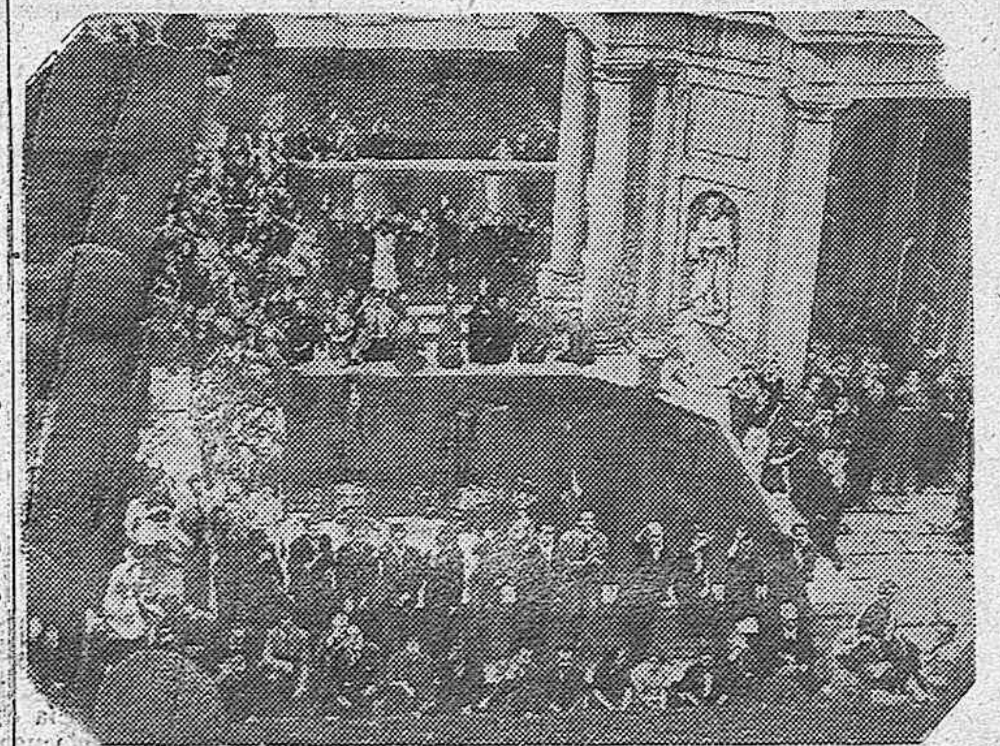
Antes de clausurar en Madrid su Asamblea los arquitectos españoles, hicieron una visita al Monasterio de El Escorial como término de sus trabajos. La presente fotografía recoge un momento del acto en el que tomó parte la Orquesta Clásica.