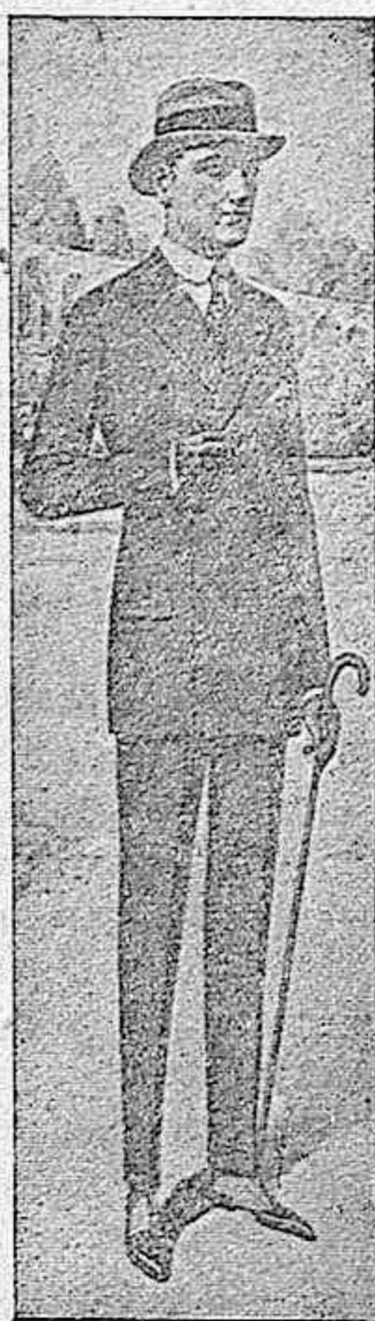
Casa PAISÁN PALENCIA