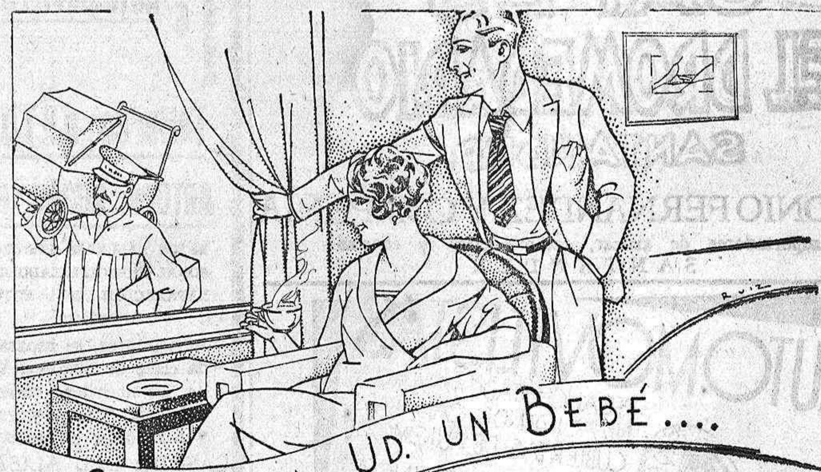
SI ESPERA UD. UN BEBÉ...

congregaciones. (Fuertes rumores). La opinión española es católica. (Siguen los rumores). Pide se retire el proyecto de la discusión de las Cortes. En el banco azul—termina diciendo—domina el espíritu de Torquemada. (Risas y rumores). El señor Gomáriz, defiende el dictamen de la comisión, pidiendo al señor Arranz retire su voto particular. El señor Arranz rectifica y mantiene su proposición. (Continúa la sesión)