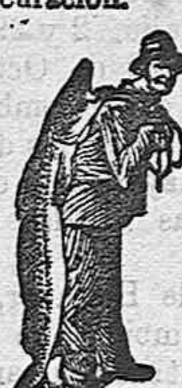
El Pescador y el Pescado

es la única emulsión á base de los ingredientes más puros y eficaces convertidos en crema agradable y digerible lograda por el procedimiento original perfeccionado de SCOTT. 3. La Emulsión SCOTT es la única emulsión autorizada para llevar sobre el paquete la marca del «pecador y el pescado» ó sea la marca que garantiza una curación.