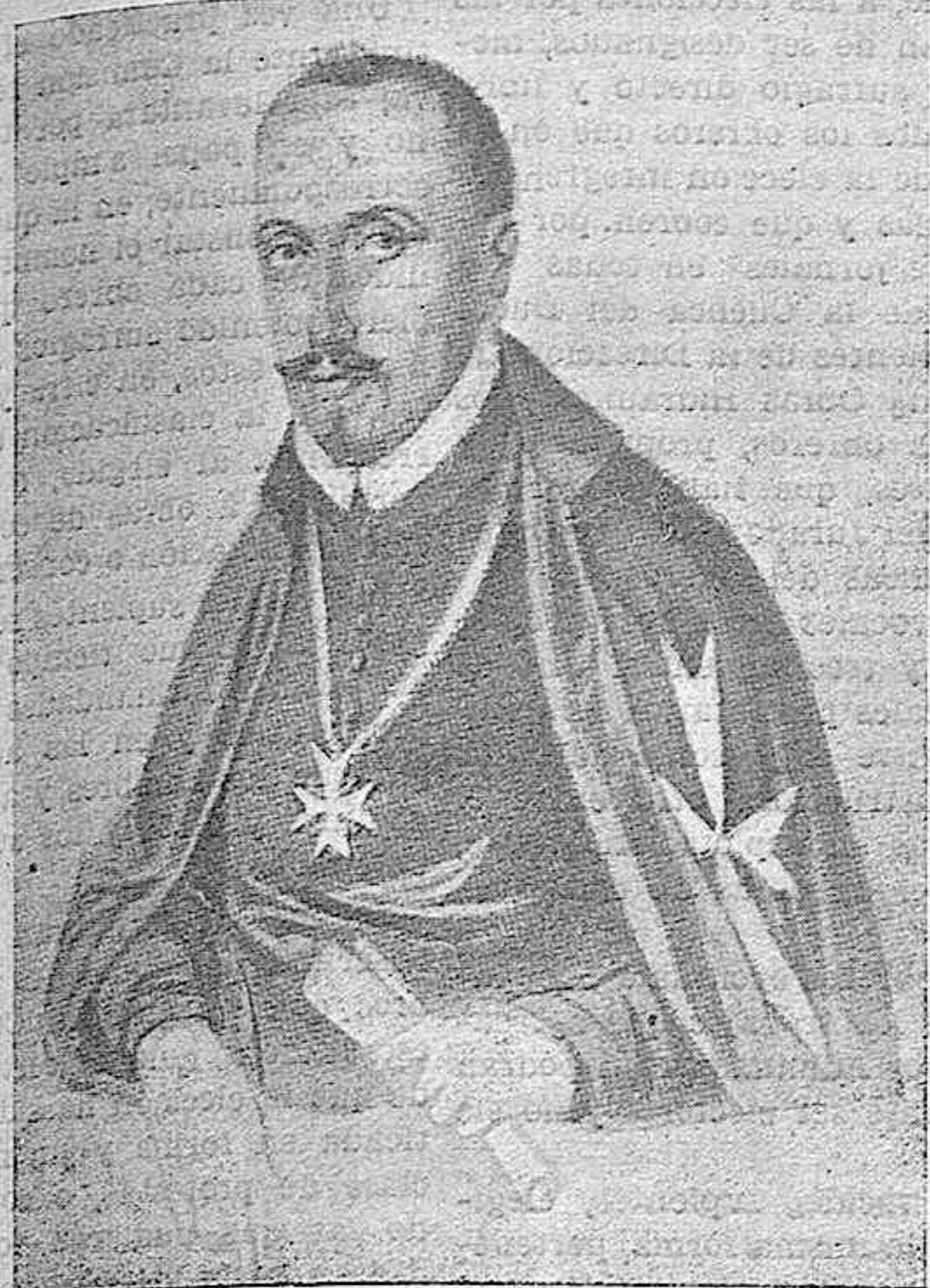
Lope de Vega, según un grabado del siglo pasado