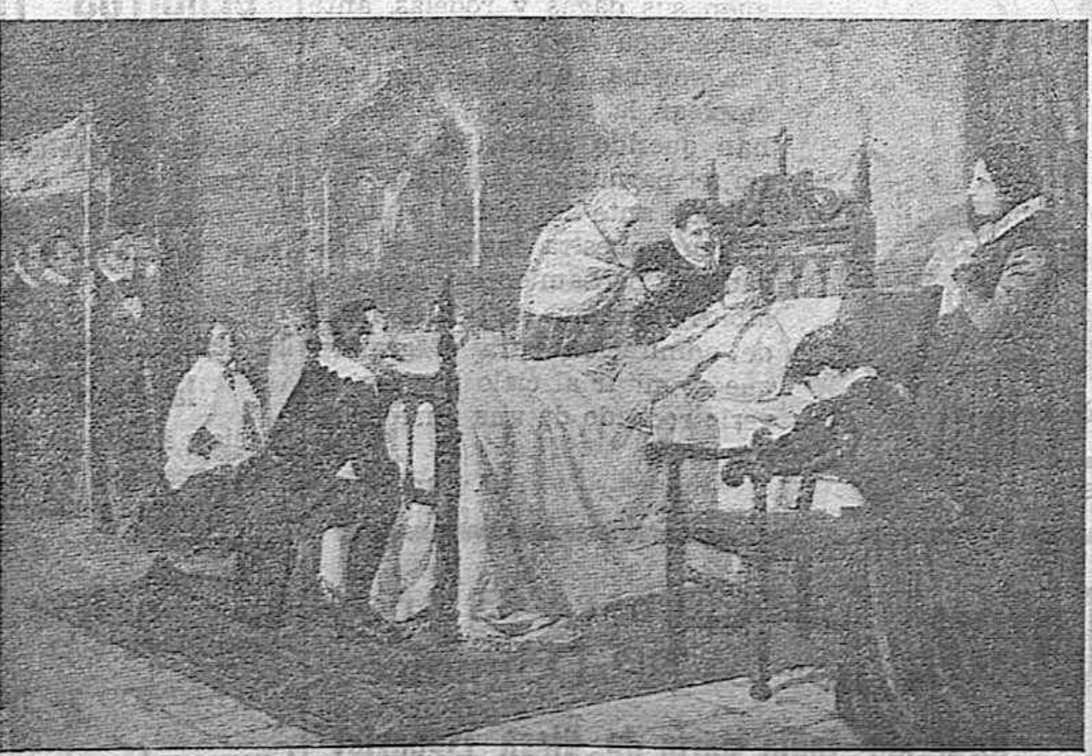
La muerte de Lope de Vega