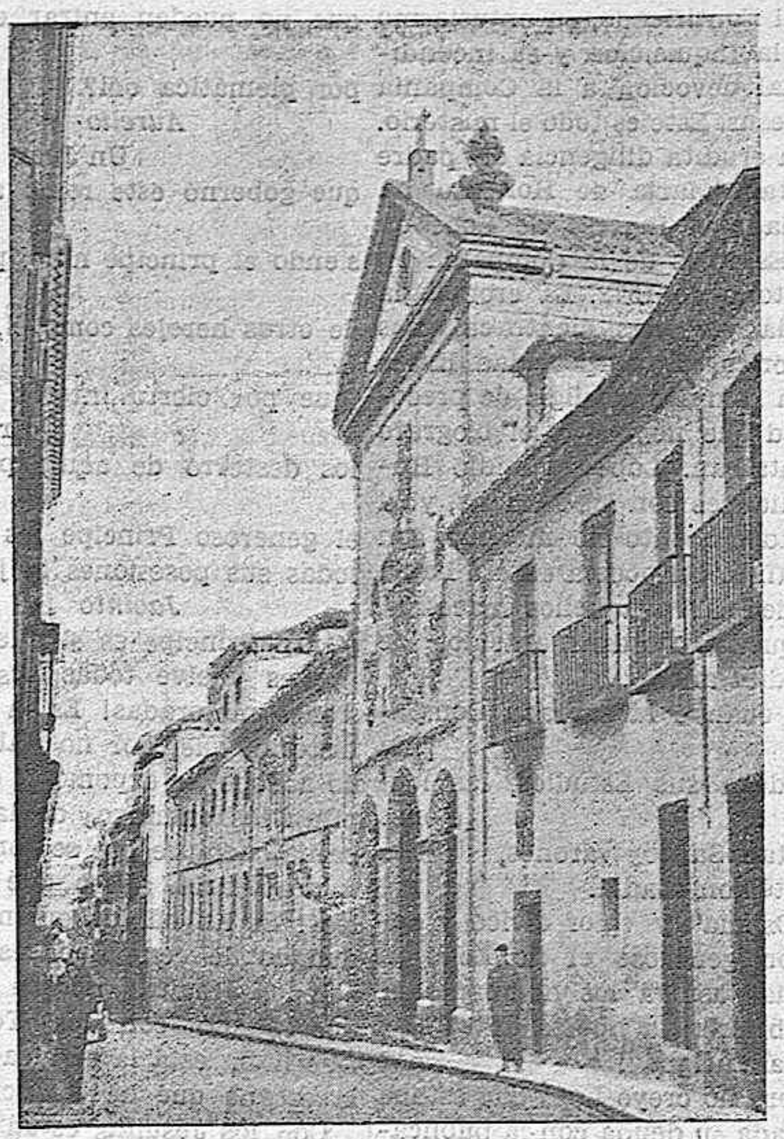
Iglesia y convento de las Trinitarias de Madrid, en donde está enterrada Sor Marcela, la hija de Lope de Vega

Como nota final, hemos de señalar que su siglo le admiró principalmente como escritor dramático, refulgiendo, por decirlo así, al brillo de sus composiciones escénicas en todas las demás que brotaban de su esplendoroso e inagotable nudo. De modo que no se le hubiera creído tan grande, no hubiera llegado a alzarse como un ídolo a la veneración y asombro de los sabios, de los eruditos y de la muchedumbre, si no hubiese sido la personificación más verdadera y exacta del espíritu, de la filosofía, de las ideas y hasta de los vicios del siglo en que dominó. De aquí, por una parte, sus inimitables perfecciones, su sencillez y donosura natural, y, por otra, su audacia, sus lanceos, sus desaciertos y dolorosas incertidumbres. Sus obras, pues, duran y durarán entre nosotros como grandiosos monumentos de epo-