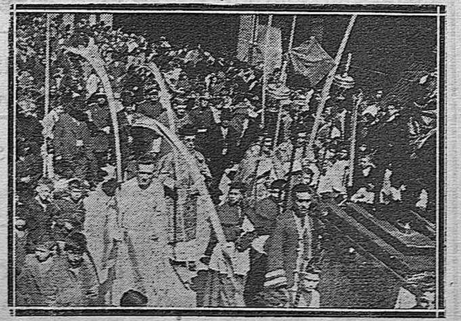
Autoridades eclesiásticas y gubernativas, en la procesión de las Palmas