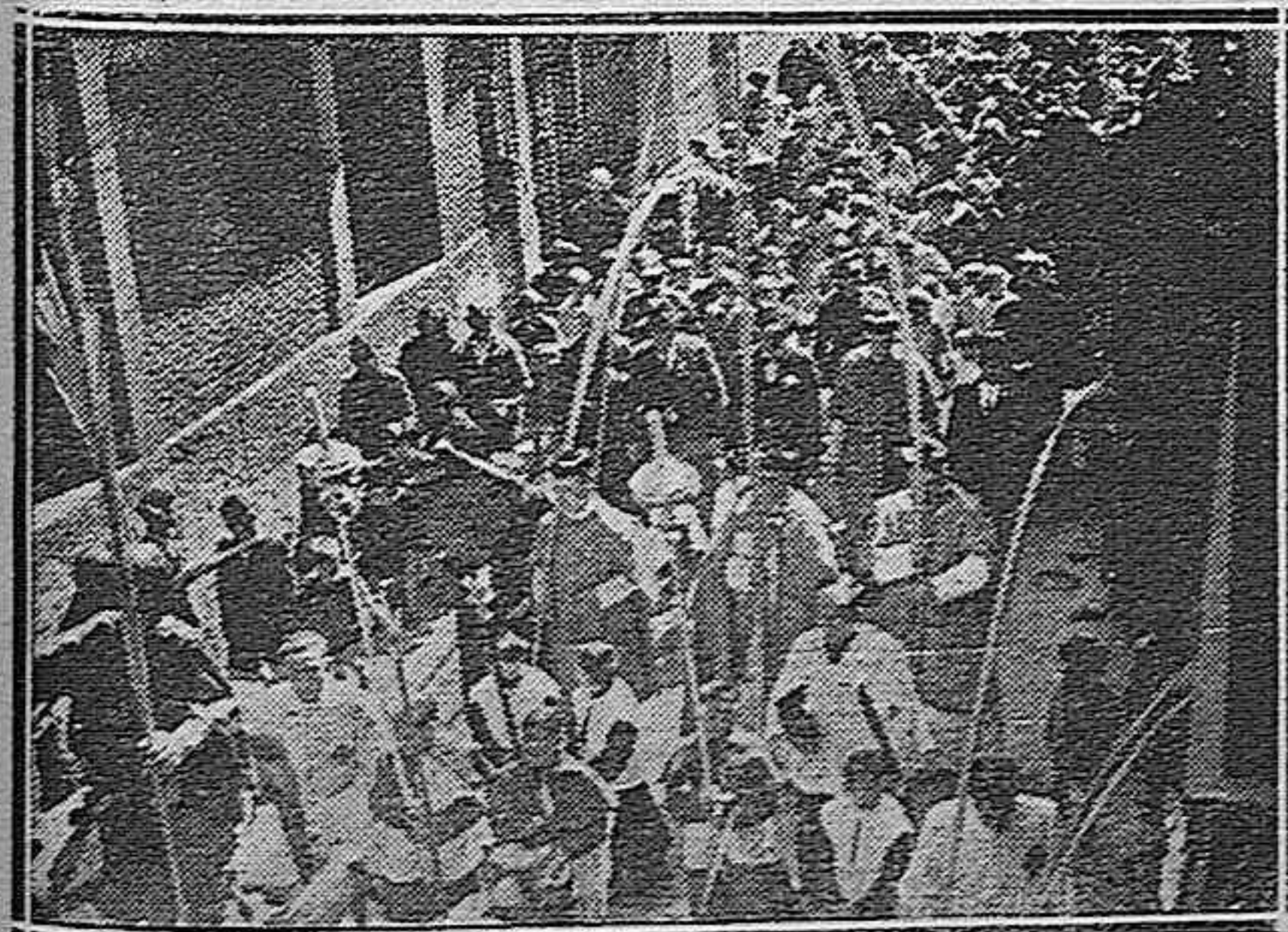
La procesión de Ramos, en la calle Menéndez Pelayo