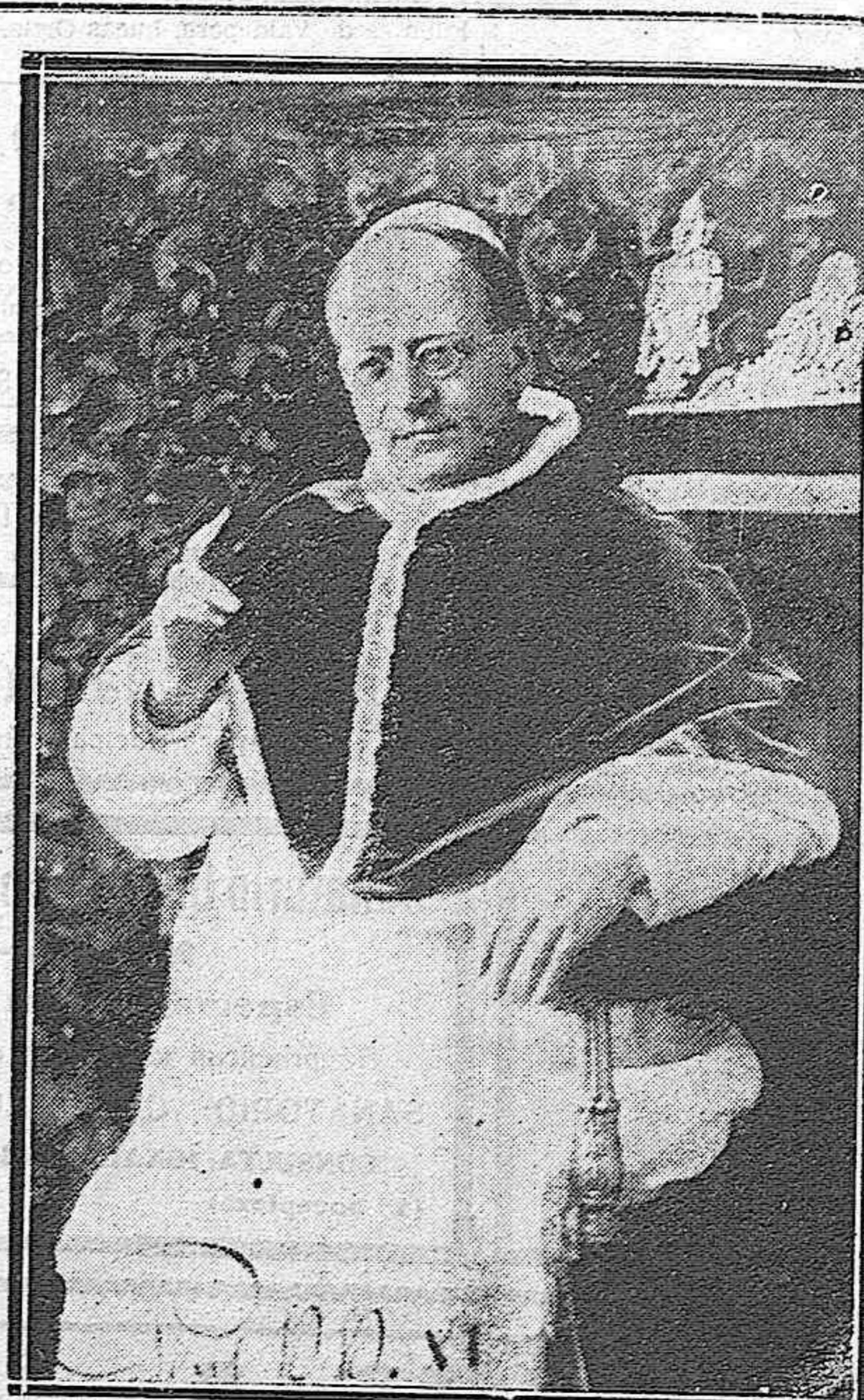
Hoy se ha celebrado, en todo el mundo católico, el «Día del Papa». La venerable figura de Su Santidad Pío XI honra hoy las columnas de EL DÍA DE PALENCIA, que se complace, una vez más, en hacer pública manifestación de su ferviente adhesión al augusto magisterio de la Iglesia Católica.