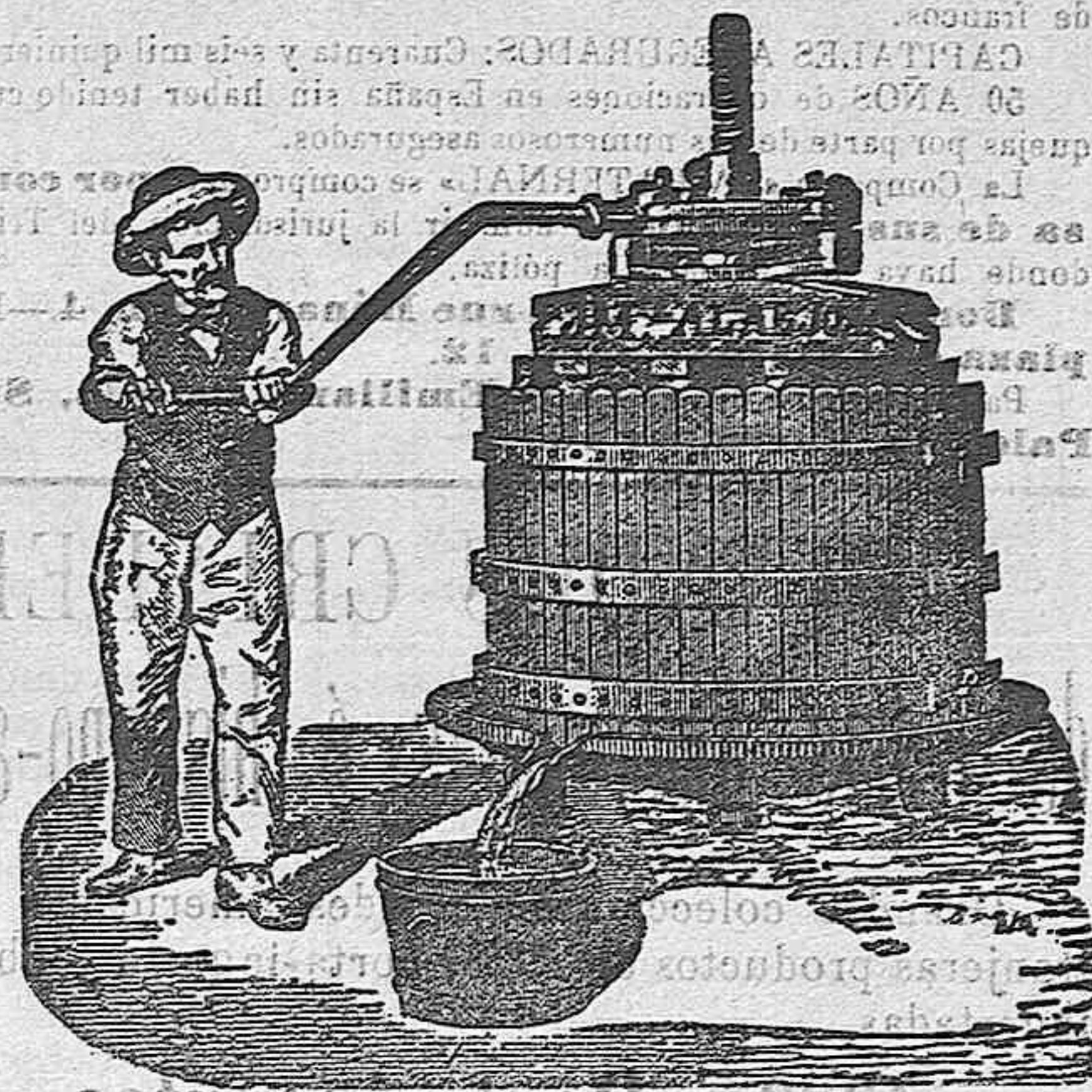
PRESA DE UVA