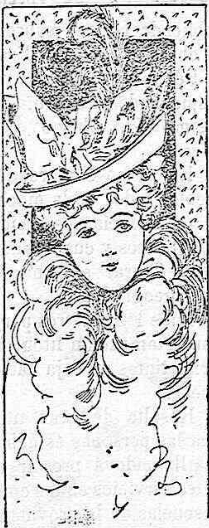
Sombrero para señorita

Modelos exclusivos para nuestras lectoras, de los grandes almacenes de EL SIGLO, Barcelona.