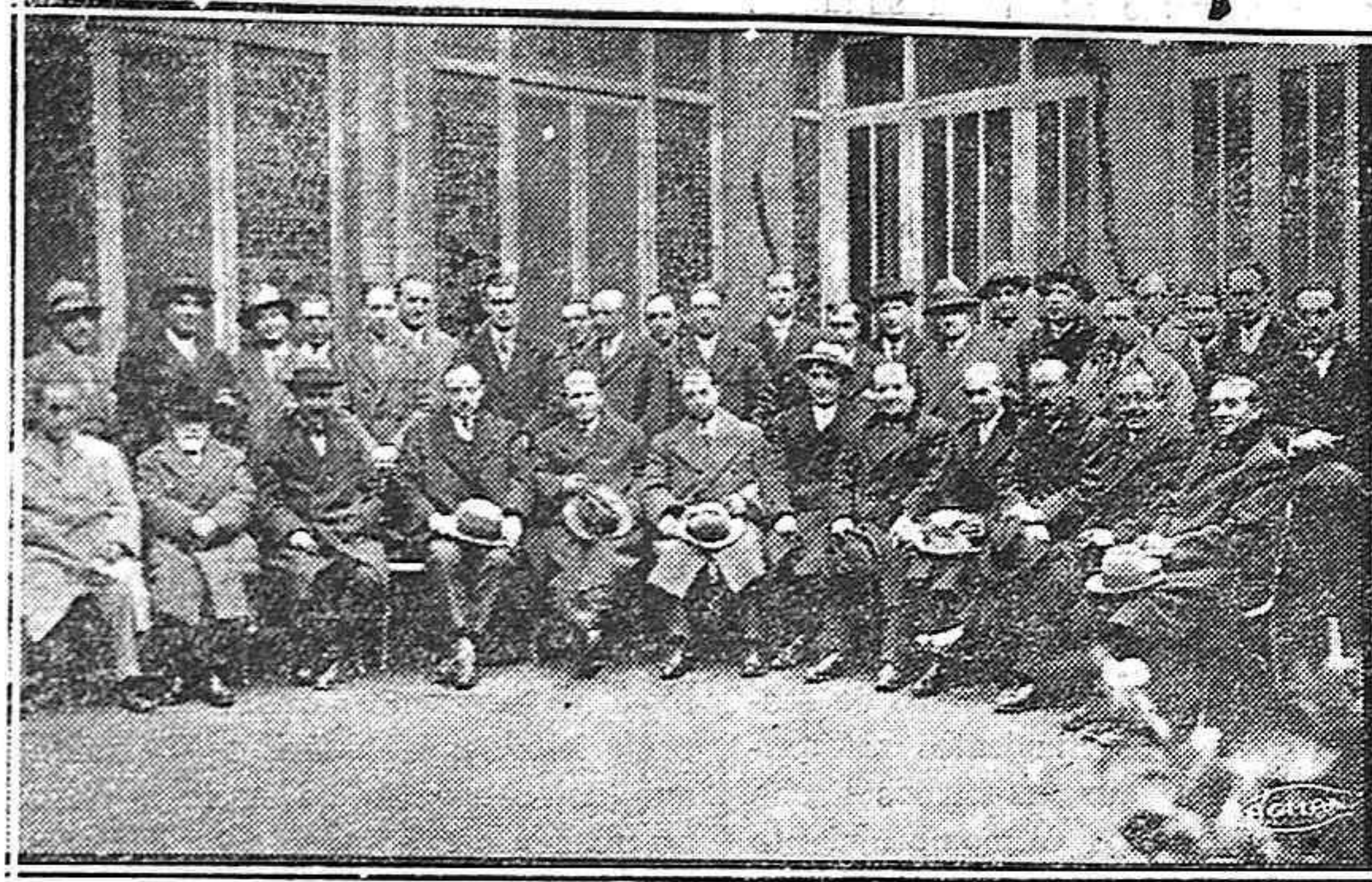
DE LA ASAMBLEA MÉDICA.—Señores que asistieron al banquete de homenaje al Sr. Garriga.

ríos, dándoles a las furbas los consuelos de bienaventuranzas salvadoras; cuando después clavaba en los espíritus