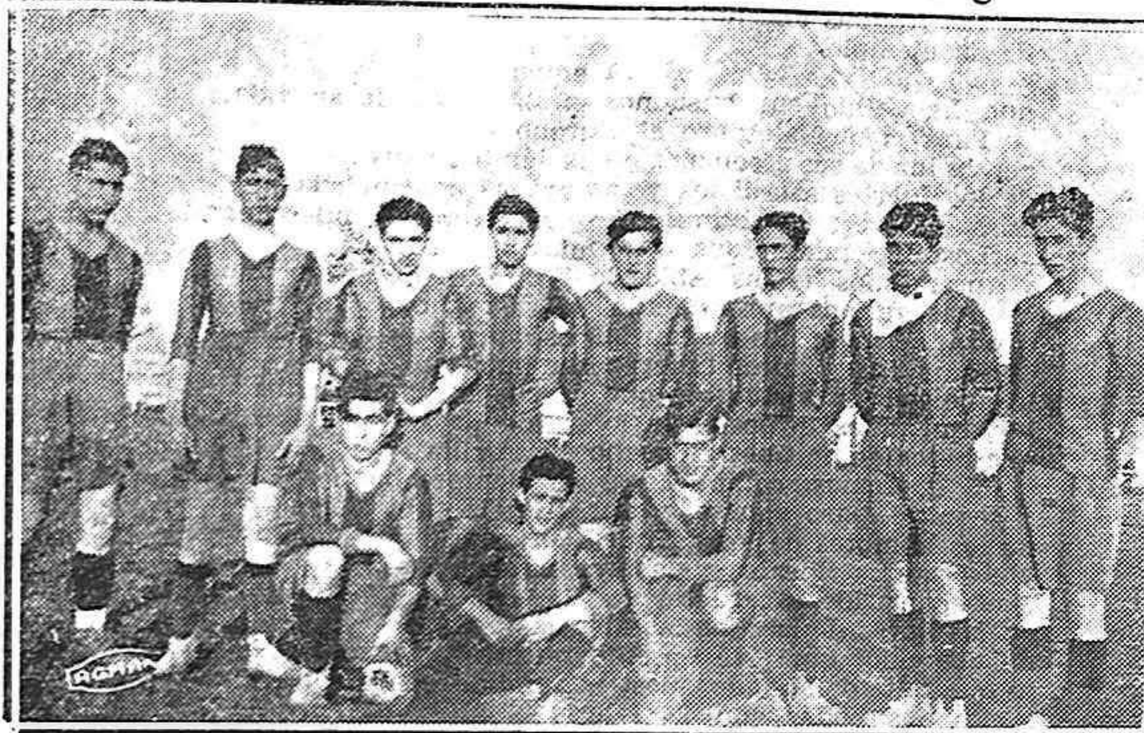
El 11 Europeo, que fué derrotado ayer en nuestro campo de deportes.

De nuevo insiste "Palencia" en acosar la portería contraria. En uno de estos avances centra Joselin, con la precisión