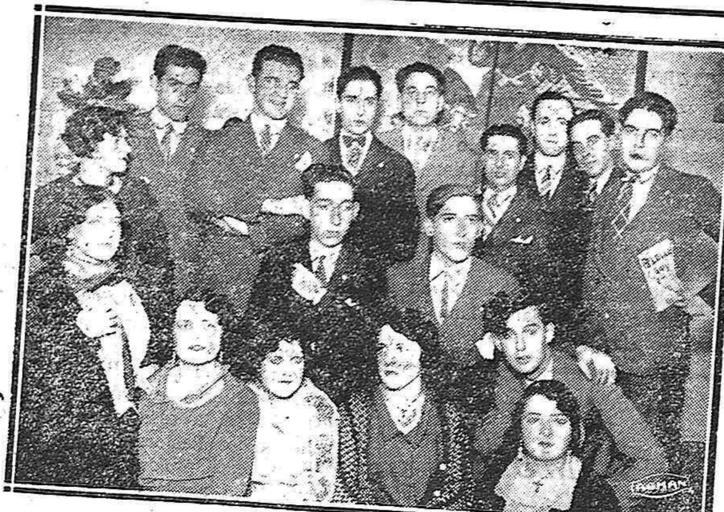
Grupo de entusiastas muchachos que componen el cuadro artístico de la Coral, que debutará mañana.