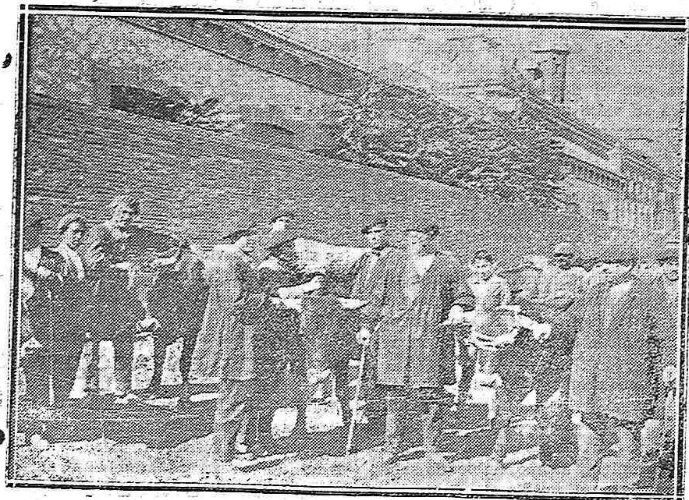
Del mercado de ganados en el Velódromo.—Vacas y toros son vendidos como simples corderillos pacíficos.

Dicha Real orden dice que el Real decreto es exclusivo a los propietarios agrícolas con arreglo a las disposiciones vigentes.