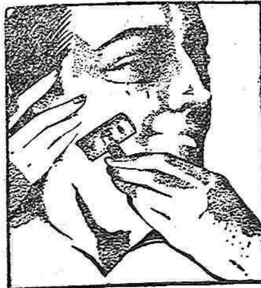
Una rápida pasada y listo para el día

LA PERSONALIDAD es un factor esencial en todos los órdenes de la vida. Para todos los que descuellan, el afeitado diario es tan importante como cualquier otro detalle de la higiene personal. ¿Es blanda su barba o dura? Use hojas Gillette legítimas y obtendrá un afeitado rápido y suave.