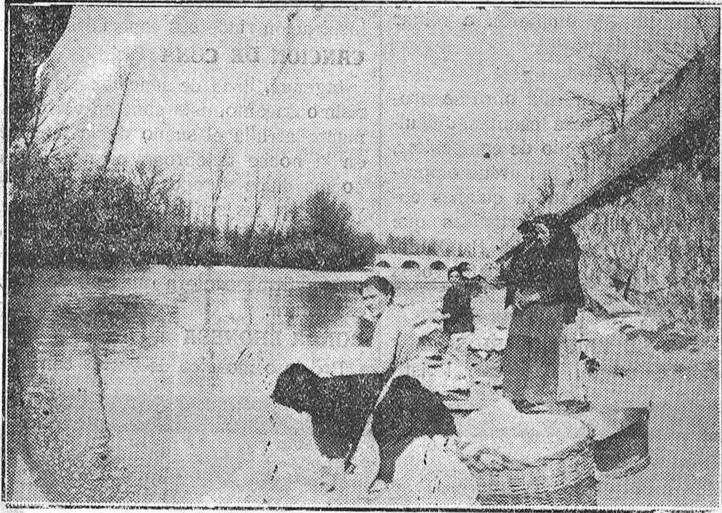
Escenas del río.—Las lavanderas se apresuran a madrugar en estas deliciosas mañanas de primavera

Y dos palabras, en fin: los labradores que acudieron a la última asamblea ce-