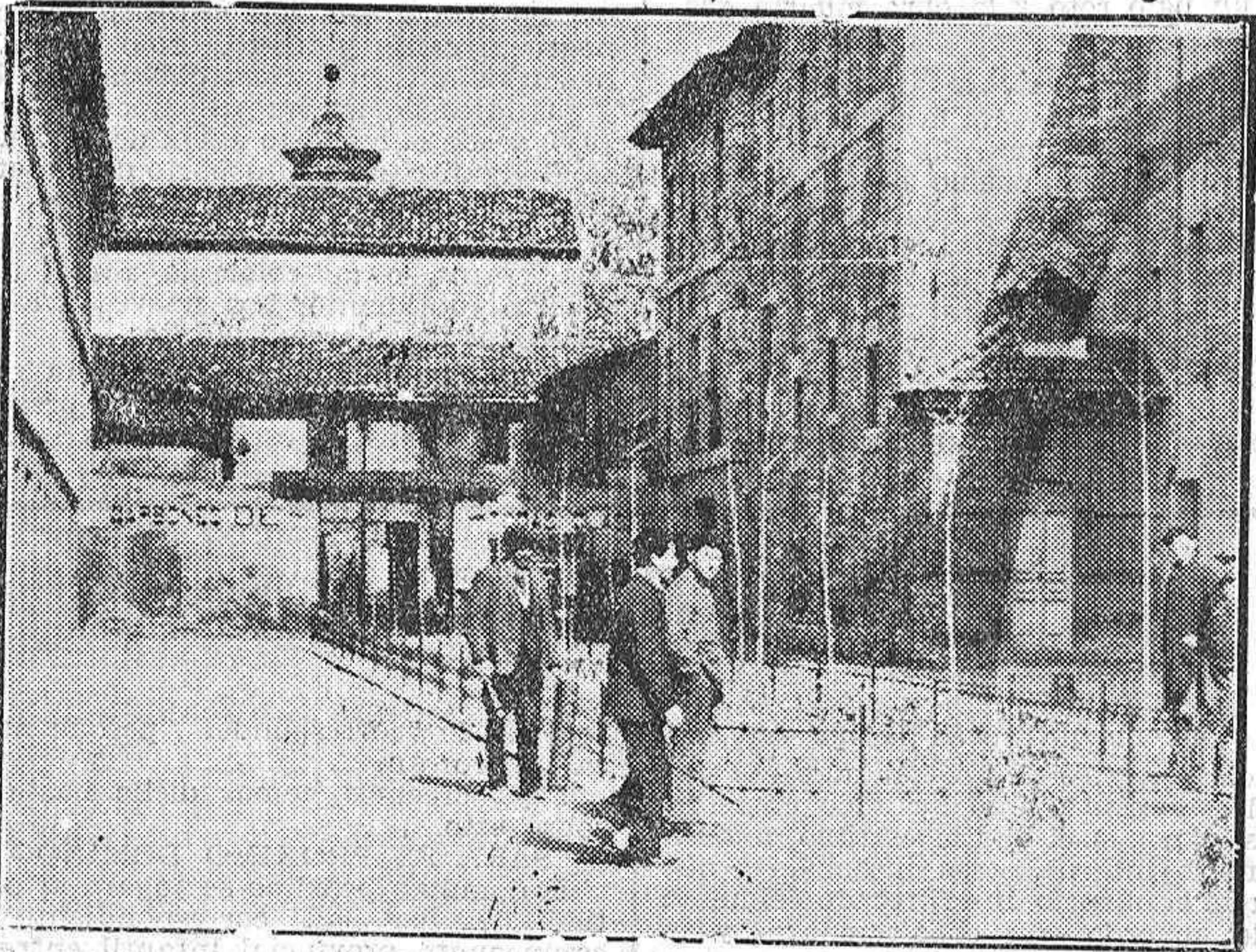
Las reformas urbanas.—Un rincón que fué feo, y que el Ayuntamiento se esfuerza en embellecer

En dicha Exposición, España tendrá un pabellón, en el que estén representadas todas las actividades de nuestra nación.