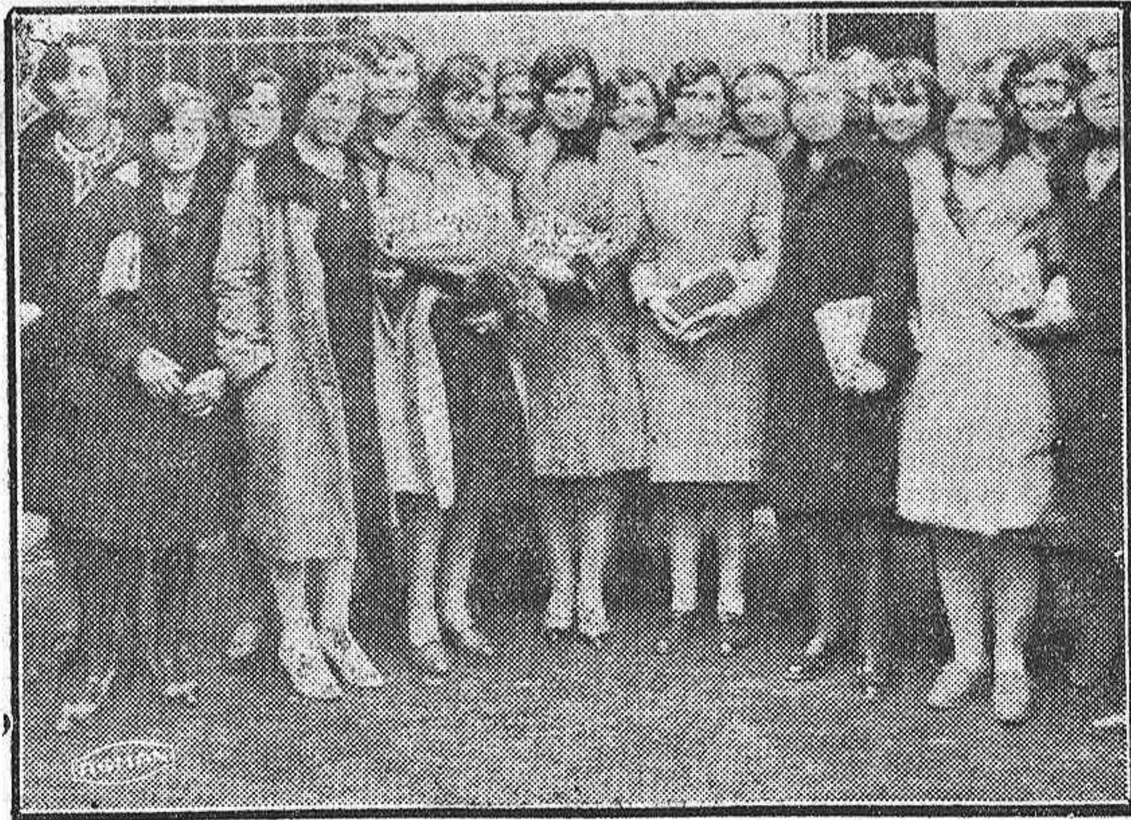
Un numeroso grupo de normalistas de 4.º año, que significan el «cielón» de la Normal; casi nuda.

El presidente del Sindicato Agrícola Regional de Carrión de los Condes, Cristóbal Fuentes y VALDES