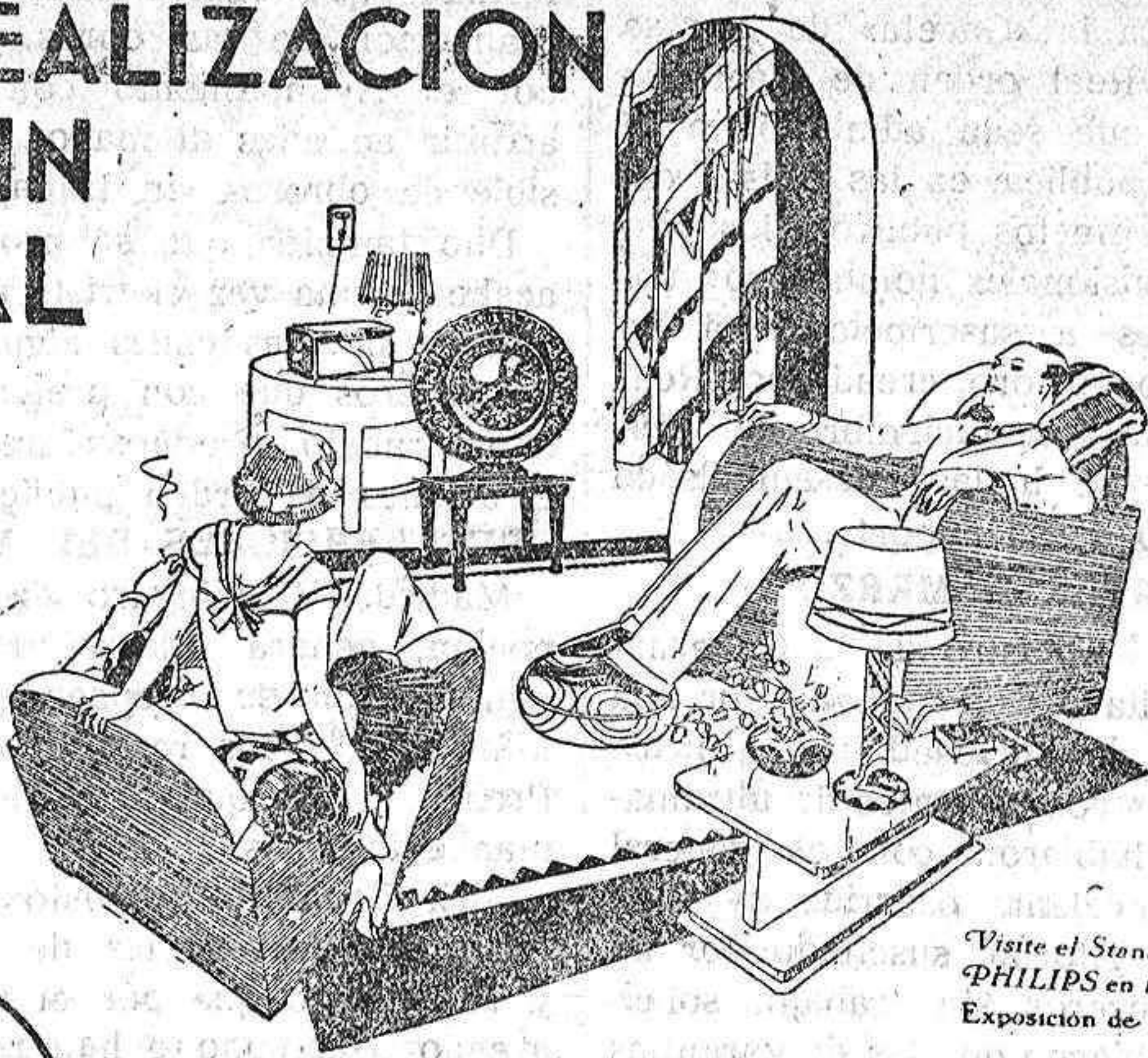
Visite el Stand PHILIPS en la Exposición de Sevilla