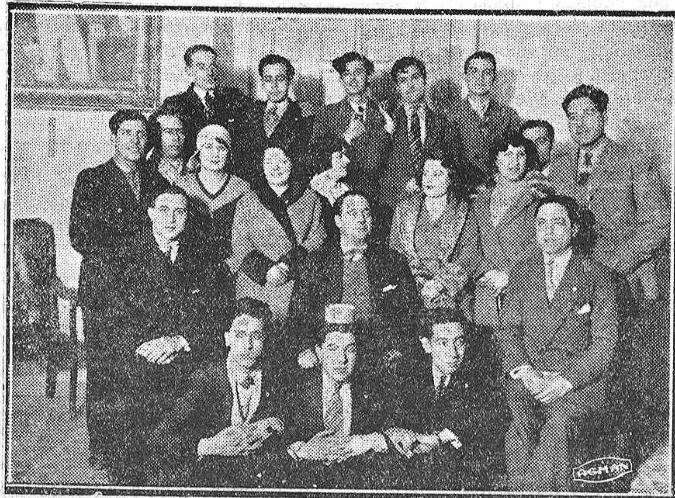
El elemento artístico que tomará parte en la representación de «La Calesera», a beneficio de la Asociación de la Prensa.

Y cuales, en estos momentos, la situación auténtica del campo? La fuerza mayor de España; la riqueza mayor de la nación; la población más densa