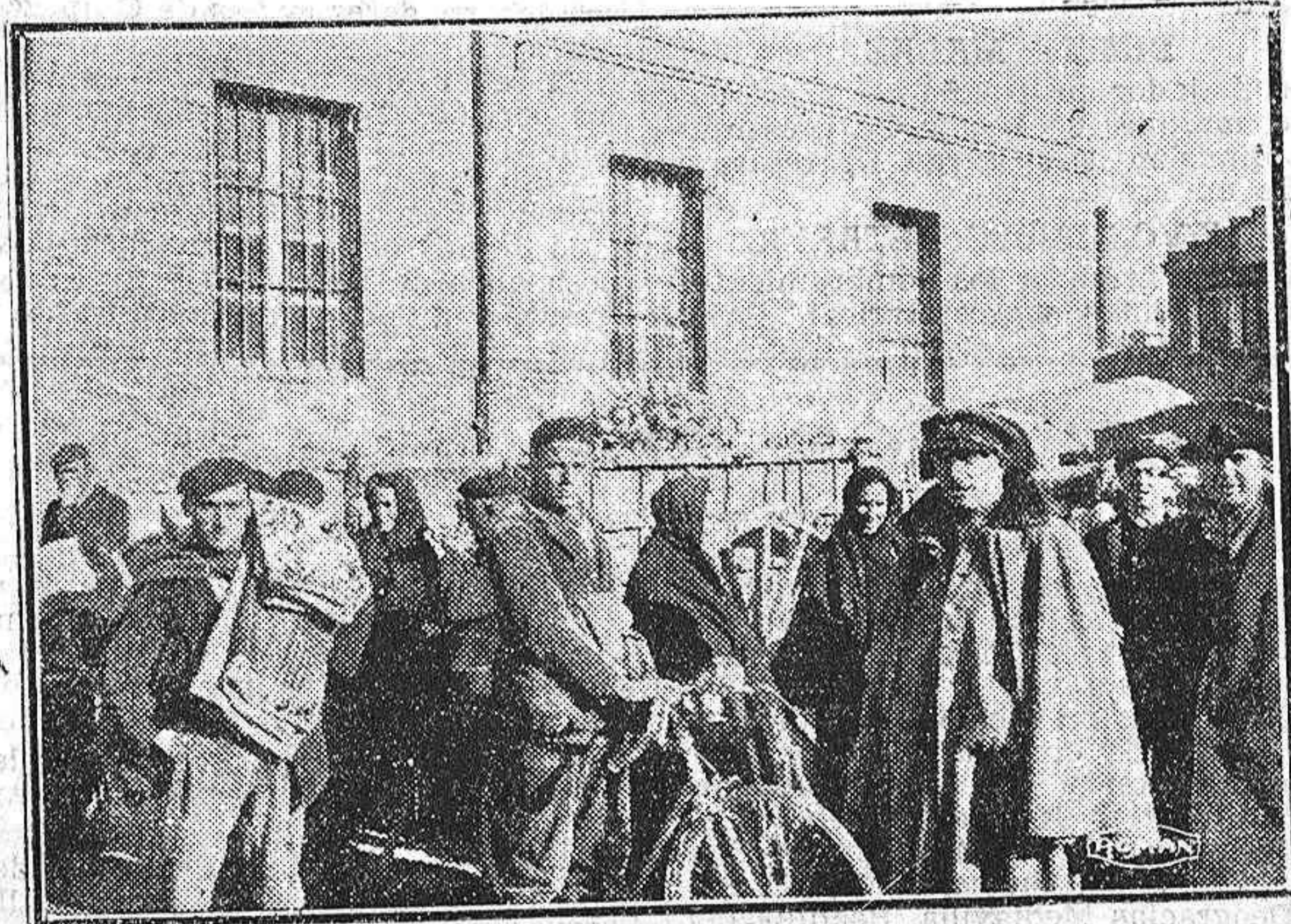
Del mercado de ayer. Una plaza grande, y un mercado mucho mayor que hace imposible el tránsito.

—No, únicamente el alcalde y siete concejales de la ciudad de Carrión de los Condes han presentado la renun-