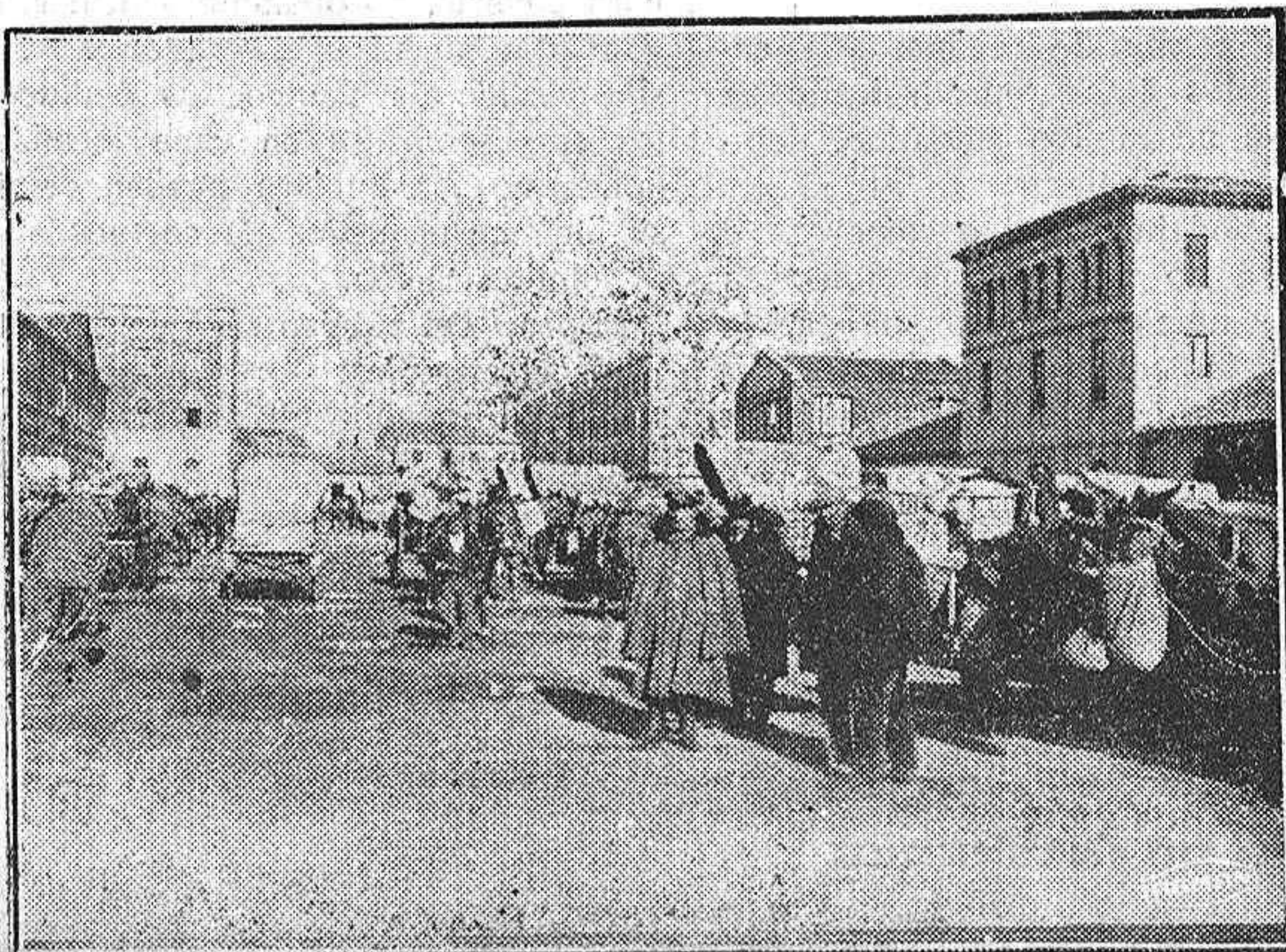
Aspecto que ofrecía el mercado de ayer en la plaza de Abilio Calderón, a primera hora de la mañana.

ra...? A qué procedimientos se apelaba en el siglo diez y siete para dar frialdad a la bebida? En el convite del