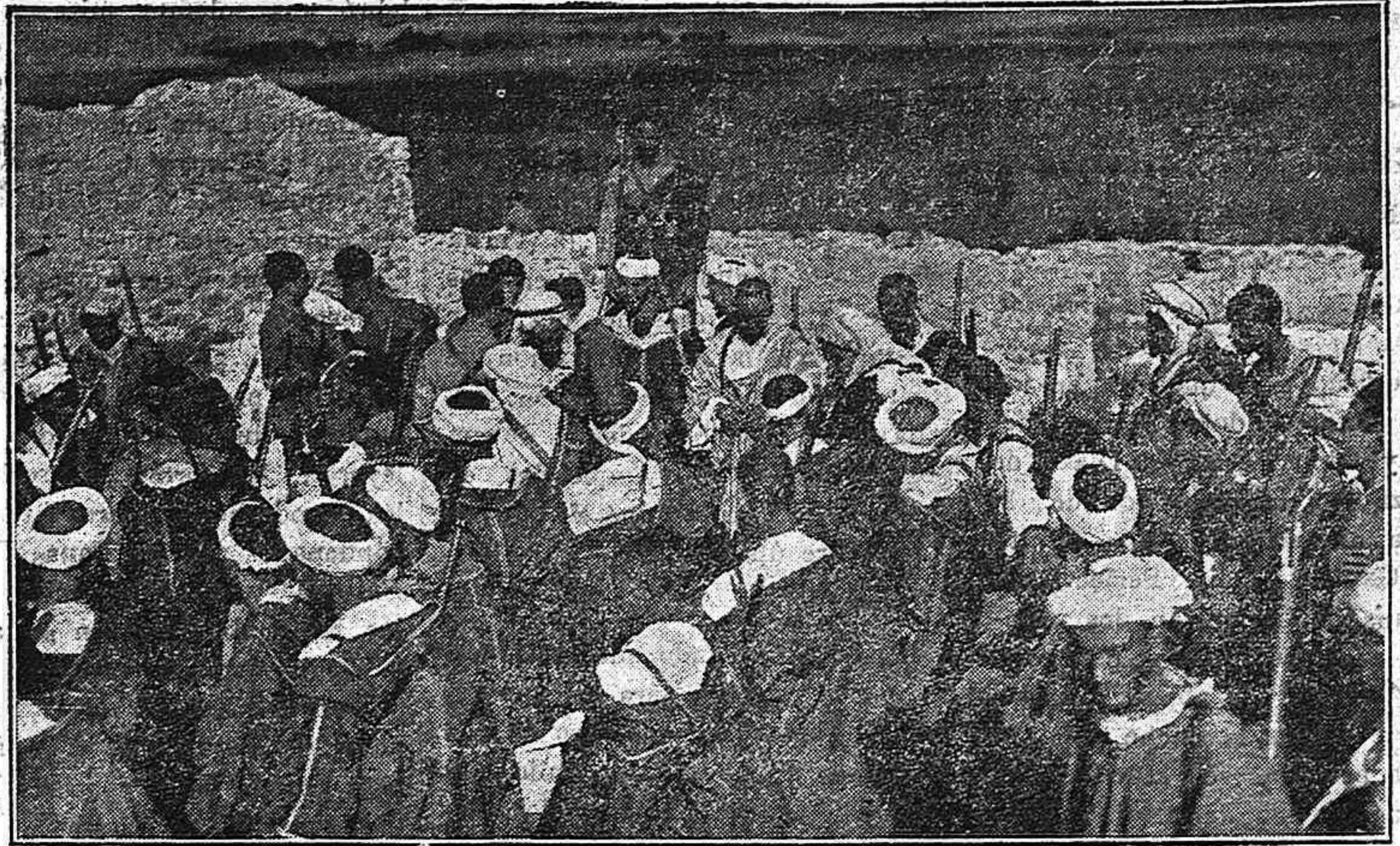
Los harqueños de Varela y Solimán que ocupan la vanguardia de la posición de Morro Nuevo.