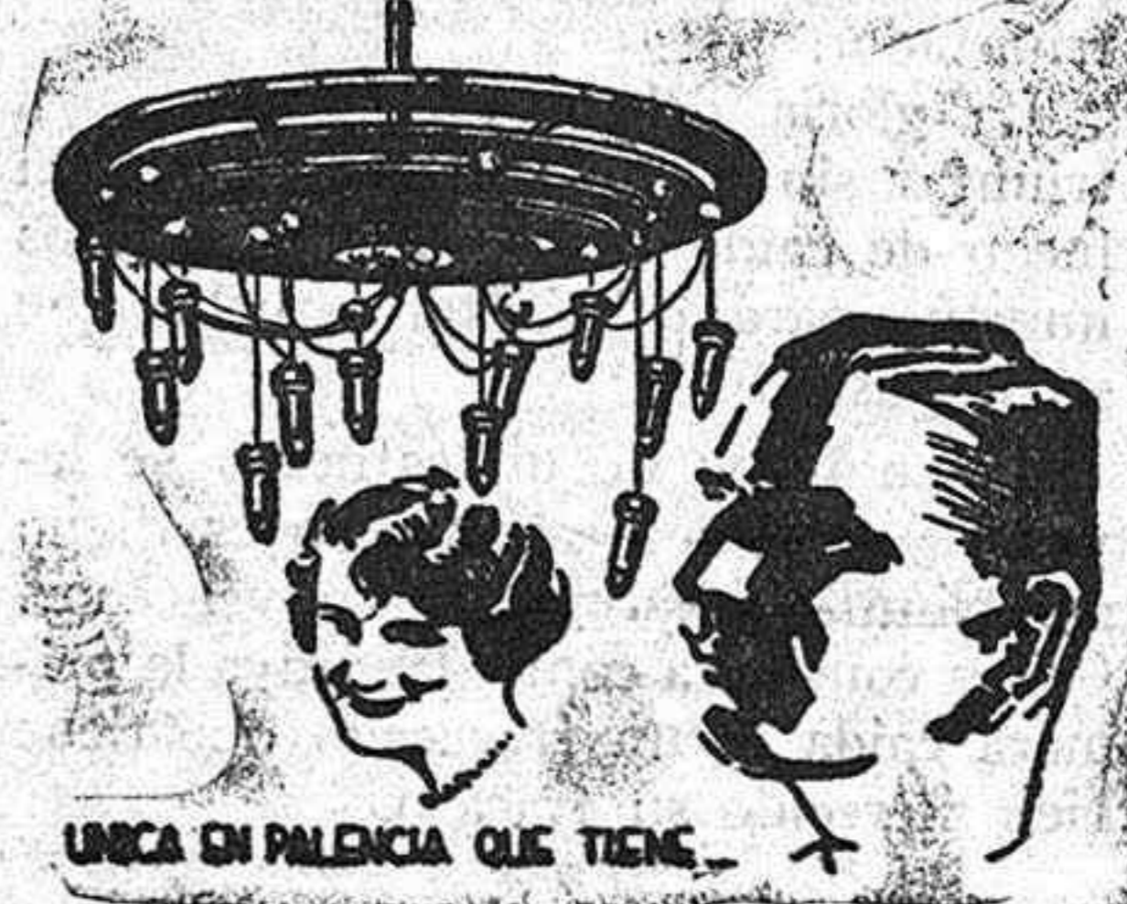
UNICA EN PALENCIA QUE TIENE...

GRAN PELUQUERIA DE SEÑORAS Y CABALLEROS CASA SANTA CRUZ