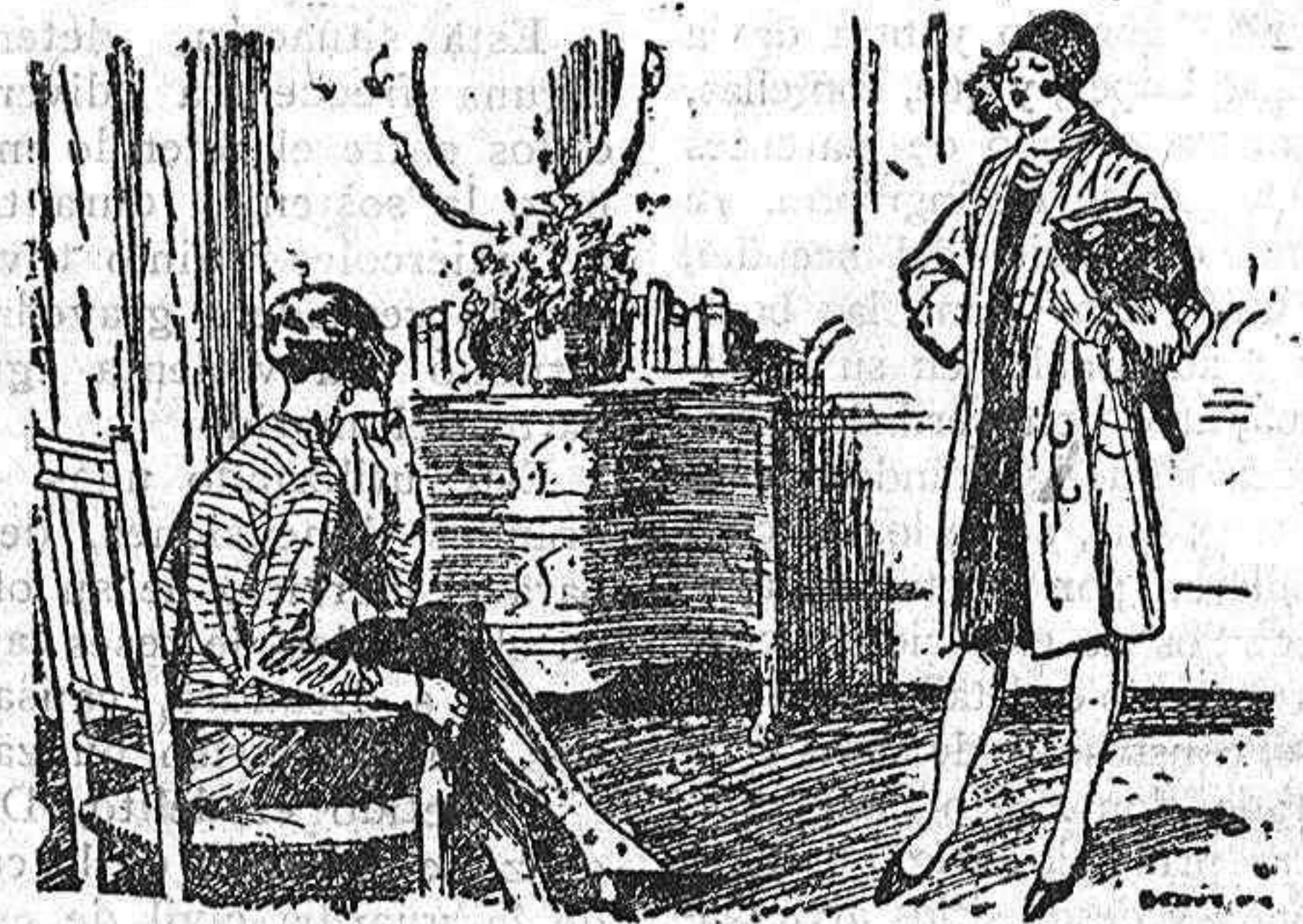
—Cómo! ¿Estás bebiendo y perteneces a una Sociedad antialcohólica?