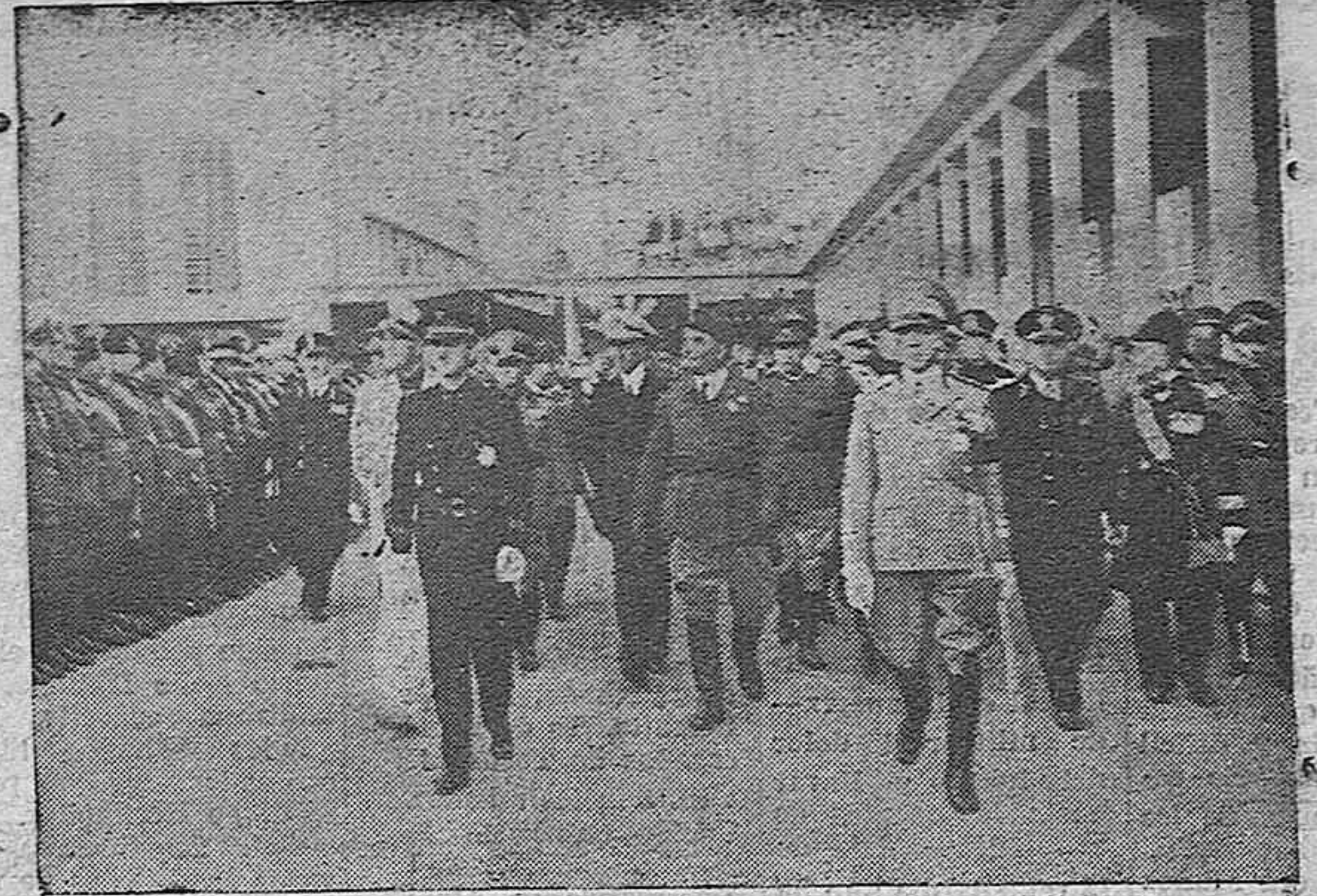
ROMA.—El ministro señor Serrano Suñer, acompañado del Duce, del Conde Ciano y del general Gámbara, al descender del monumento a Víctor Manuel, después de rendir homenaje ante el altar de la Patria.