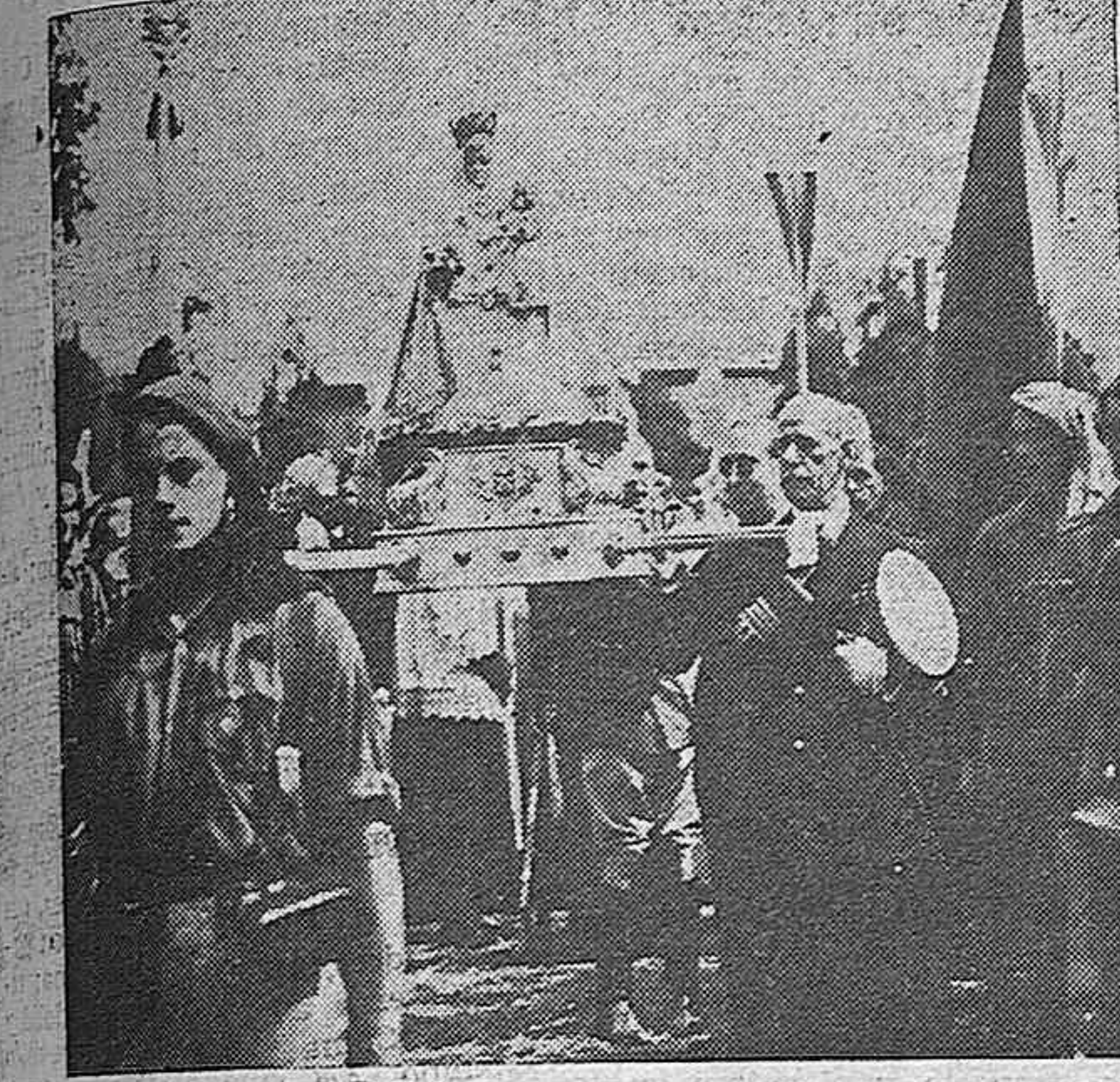
La Virgen de Covadonga

Londres, 16 (5,15 t).—Parece que Inglaterra abrirá un nuevo crédito a la China dentro de muy poco tiempo. Así lo dice en su emisión de hoy el "Financial News".