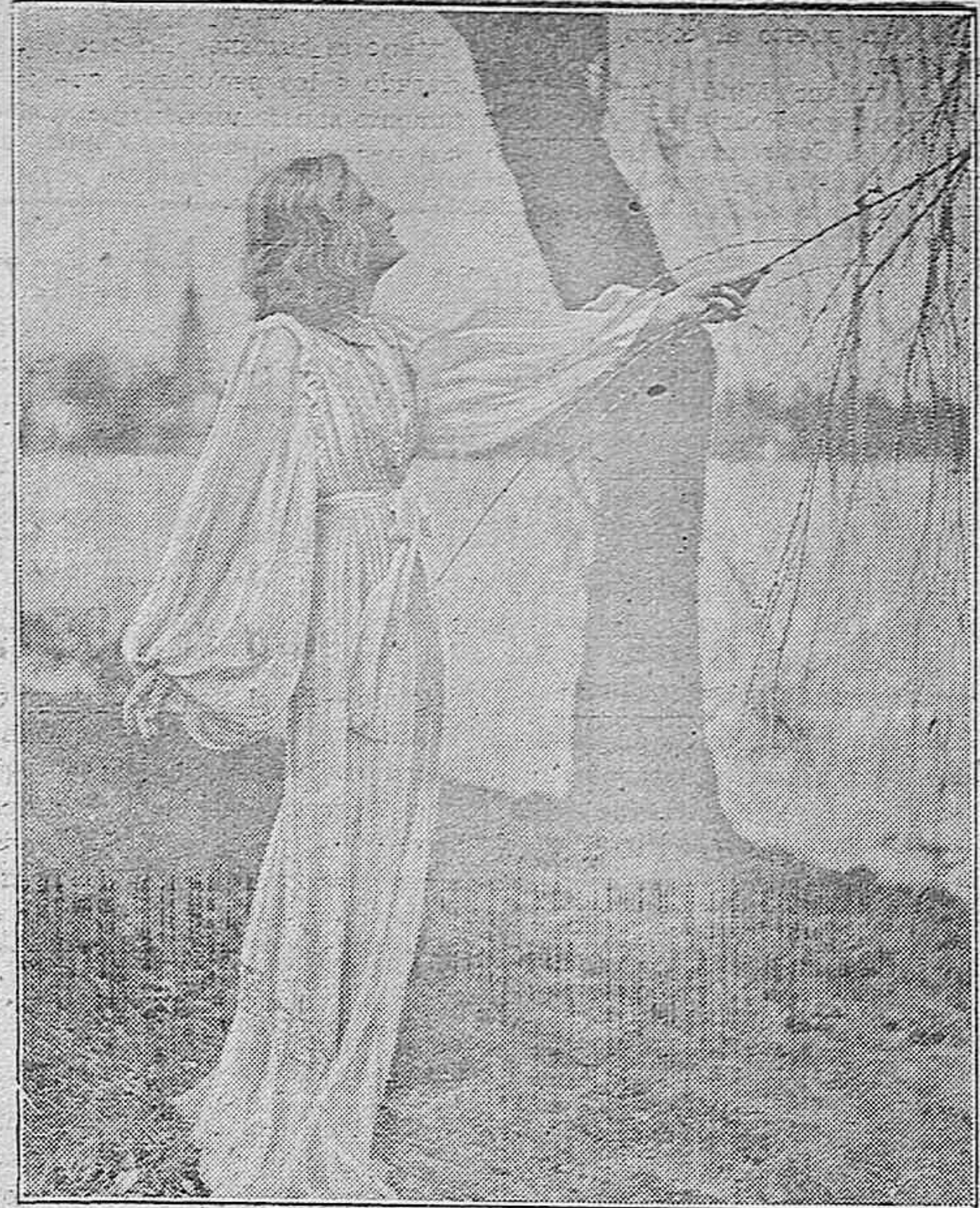
Una escena de la producción de Karl-Ritter, de la "Ufa". Pour le Mérite.

de volar. Durante la Gran Guerra se le ofreció la ocasión de verificar sus ensueños infantiles. Como piloto fué premiado con las decoraciones de la más alta categoría.