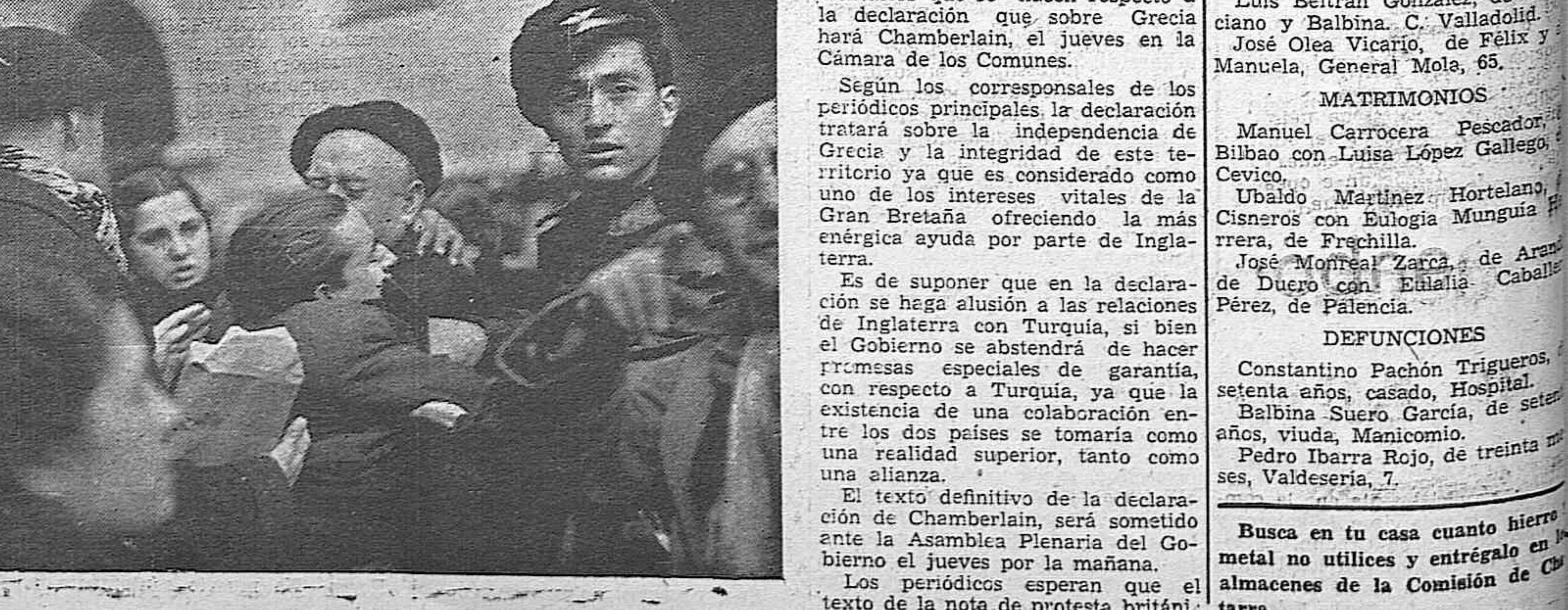
MADRID.—Momento emocionante en que uno de los presos, al salir del cautiverio, se encuentra con un pariente, al que abraza efusivamente.