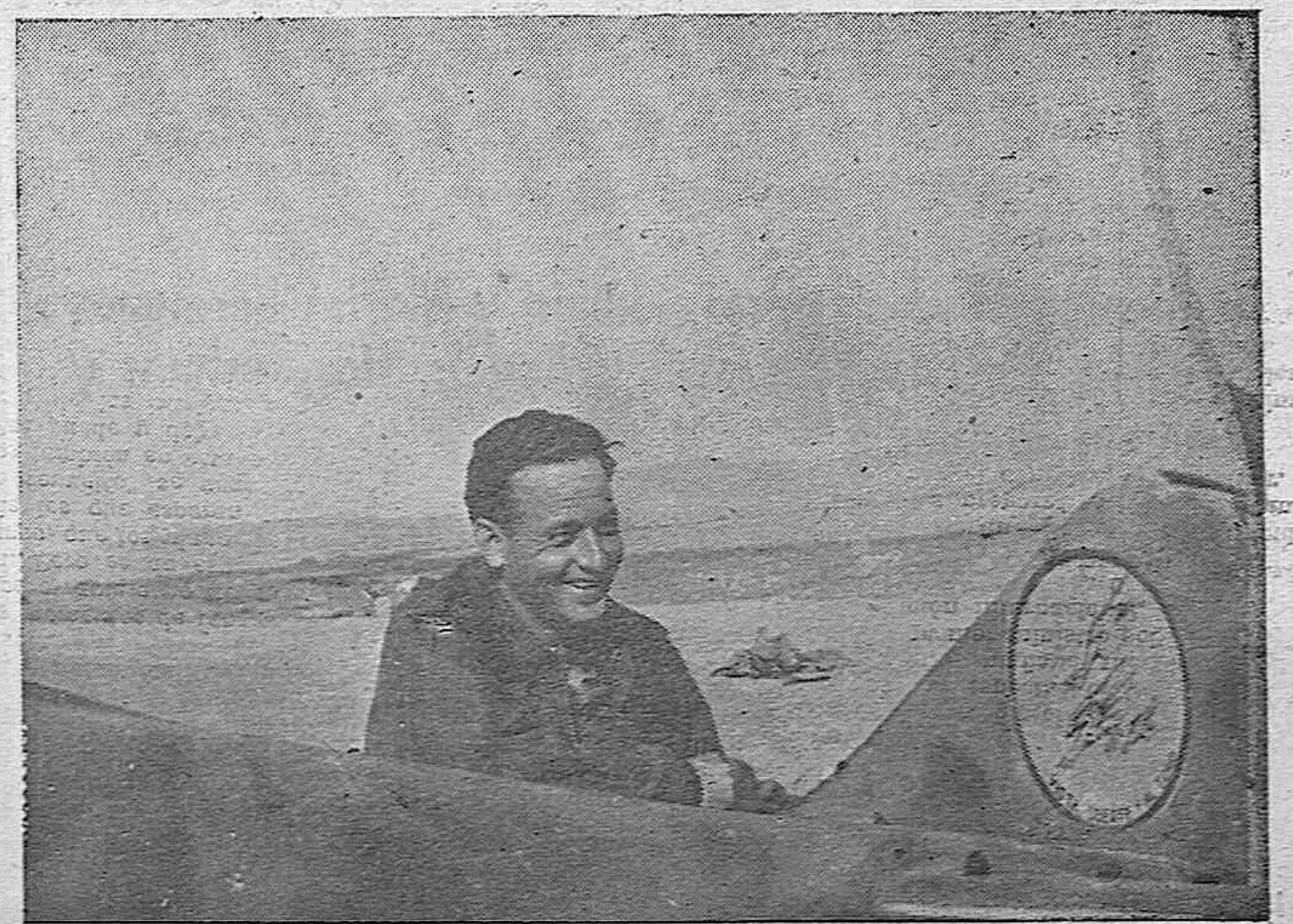
MADRID.—El laureado comandante García Morato sonríe satisfecho junto a su aparato después de uno de los numerosos combates en fueron abatidos varios aviones rojos.