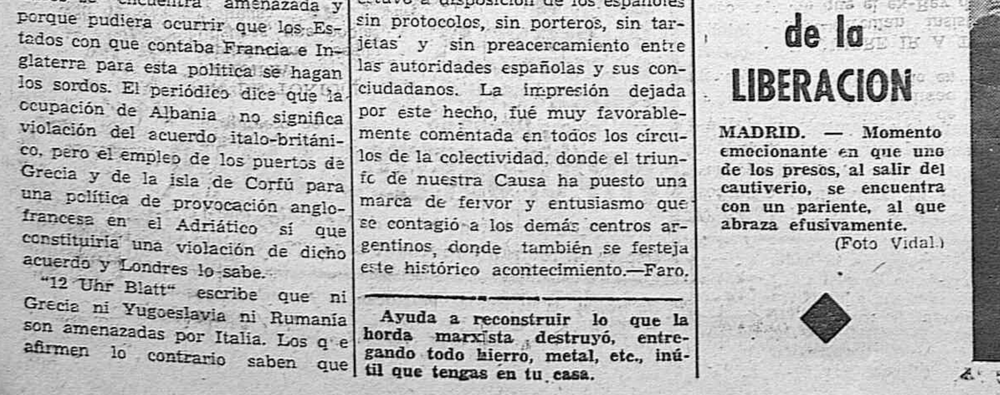
MADRID.—Momento emocionante en que uno de los presos, al salir del cautiverio, se encuentra con un pariente, al que abraza efusivamente.