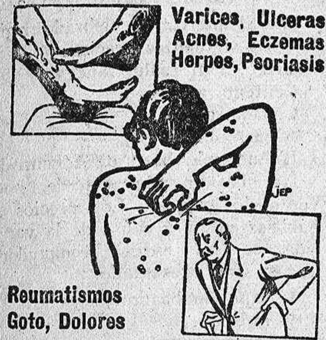
Varices, Ulceras, Acnes, Eczemas, Herpes, Psoriasis