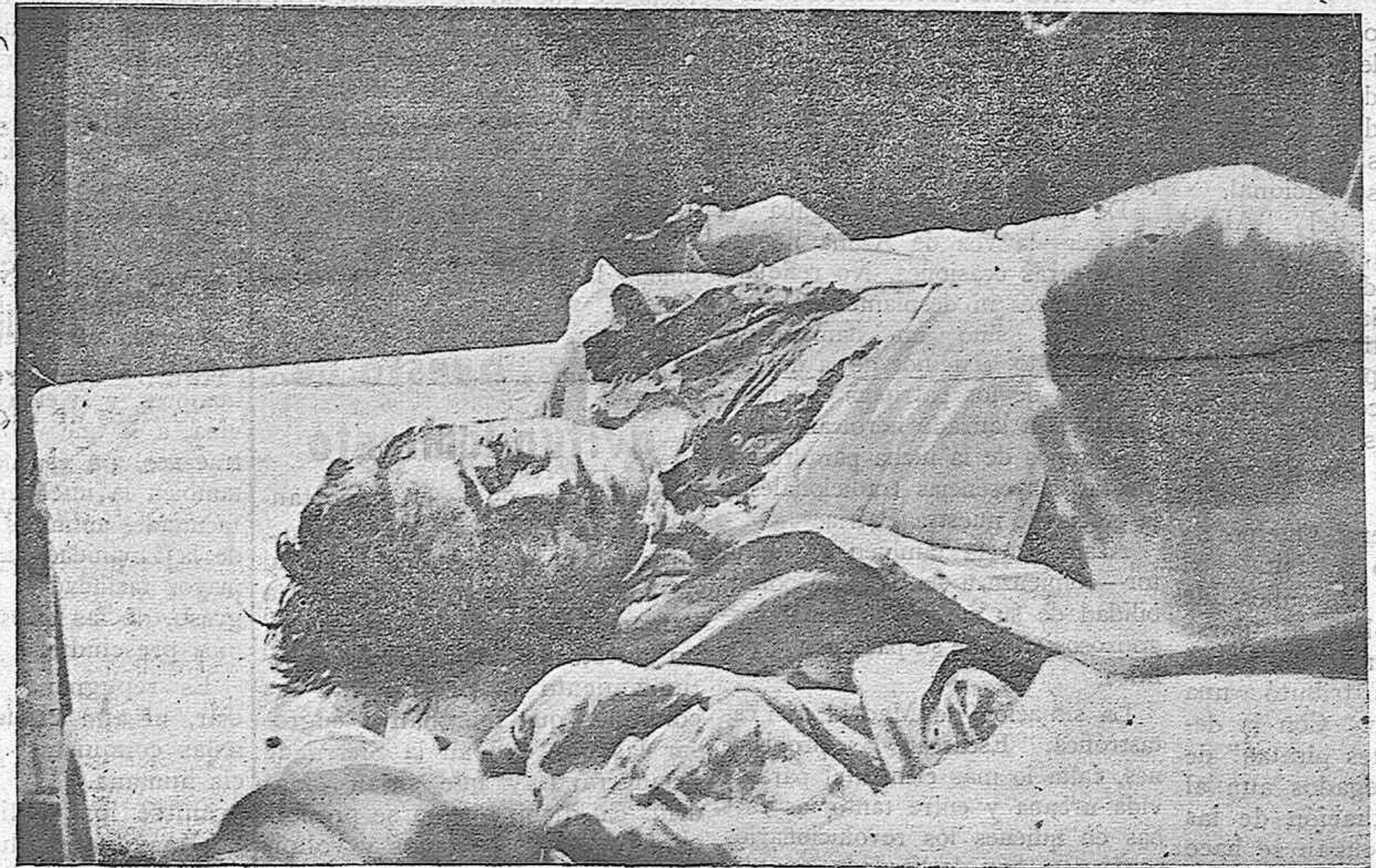
El cadáver de Calvo Sotelo