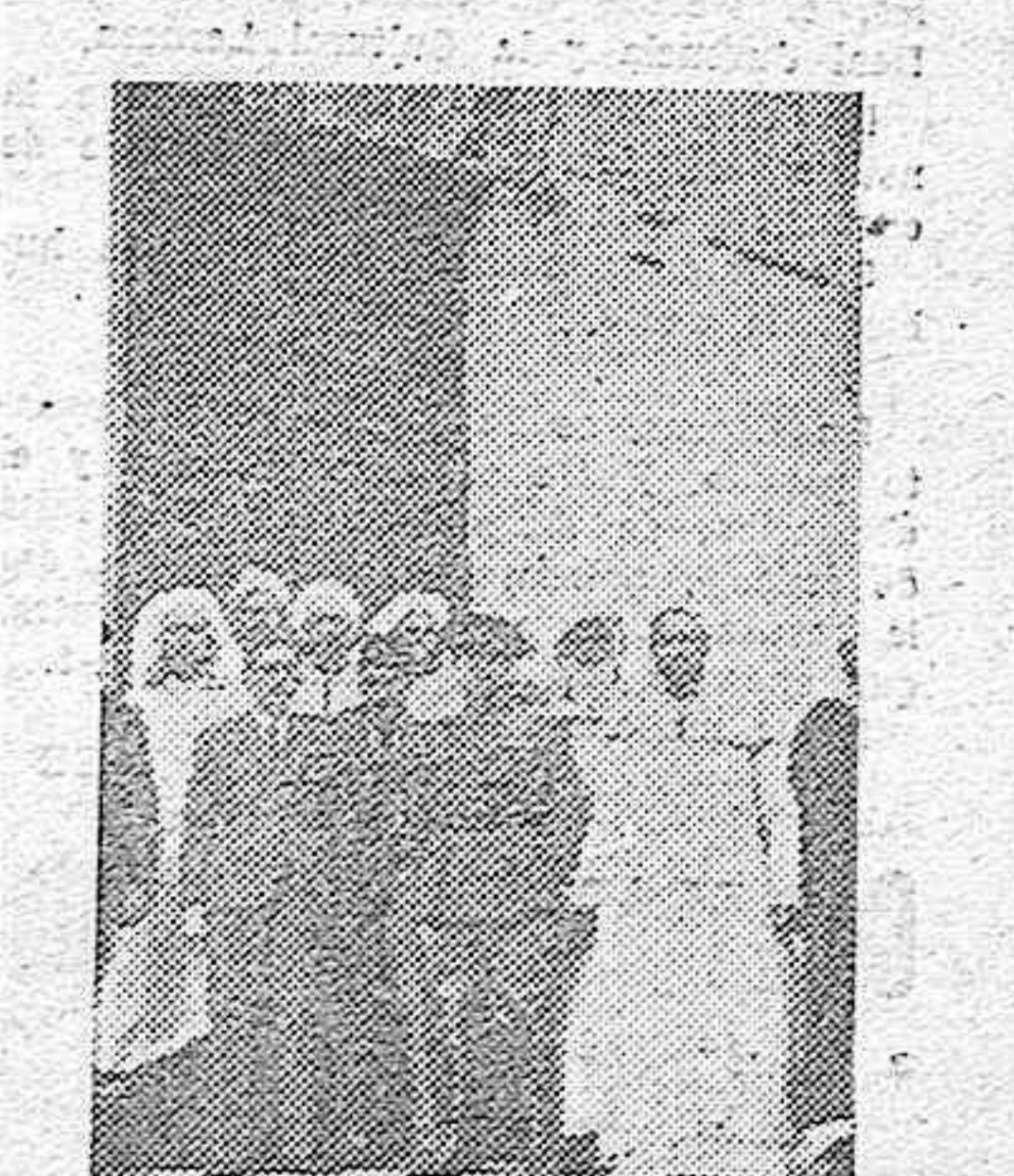
Los caídos marroquíes que, invitados por el Caudillo, asistieron a la feria de Sevilla, salen de visitar la Mezquita de Córdoba, acompañados del comandante Moreno Gordillo.