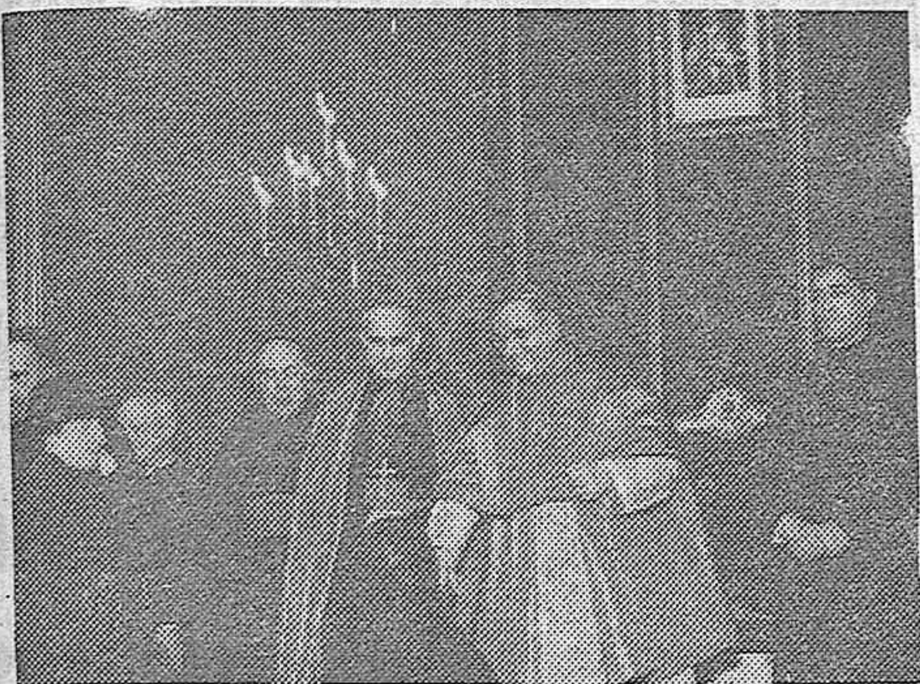
MONSEÑOR CIGOGNAR DA A BESAR SU MANO AL PUEBLO. QUE ACUDIO EL DIA 12 A LA NUNCIATURA DE MADRID PARA DAR TESTIMONIO DE SU ADHESION AL PONTIFICE. EN EL PRIMER ANIVERSARIO DE SU CORONACION