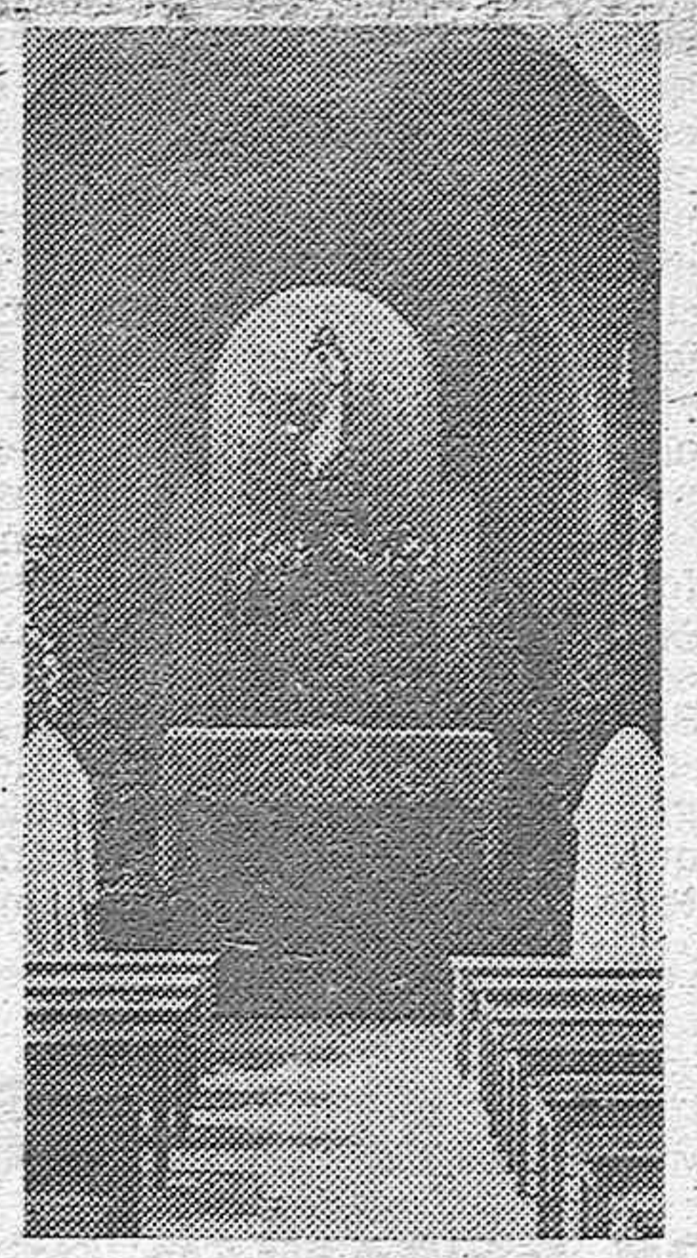
En el Colegio de Religiosas Concepcionistas de nuestra ciudad fué inaugurada el domingo la capilla, que recoge el grabado.