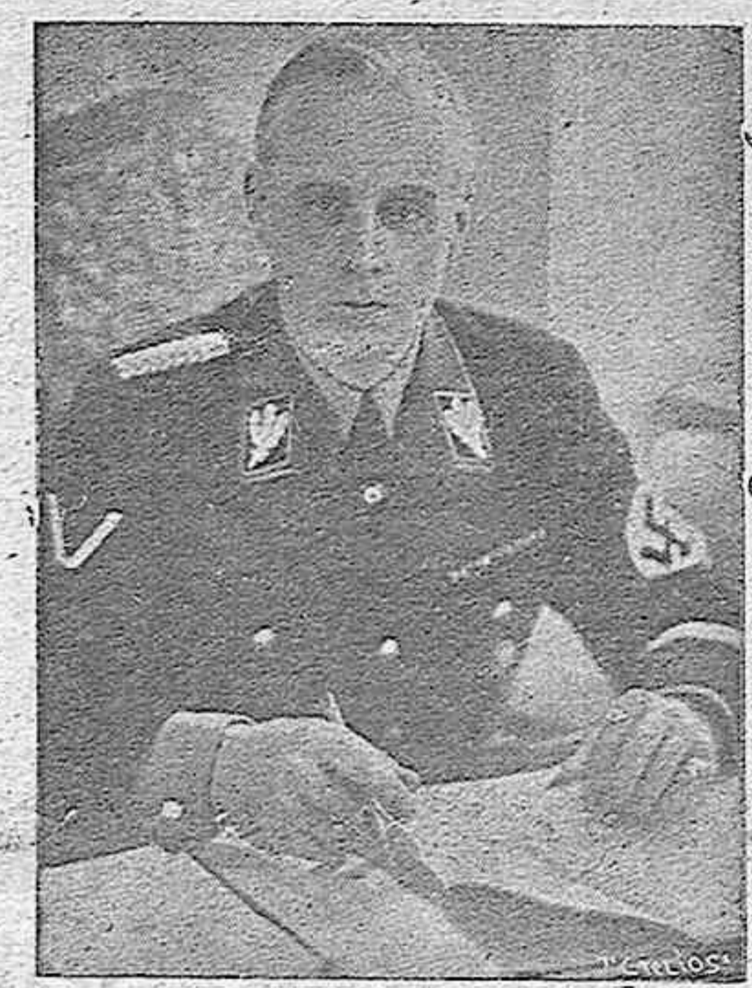
ROMA, 8.—Se anuncia que mañana llegará a Roma, procedente de Berlín, el ministro de Negocios Extranjeros del Reich, Joachim von Ribbentrop. — EFE.

2.400 kilómetros de vuelo directo, efectuado por aviones ingleses de guerra Fueron desde Inglaterra a Polonia Occidental, regresando a Francia Ha sido el mayor de los efectuados en esta campaña por aparatos británicos