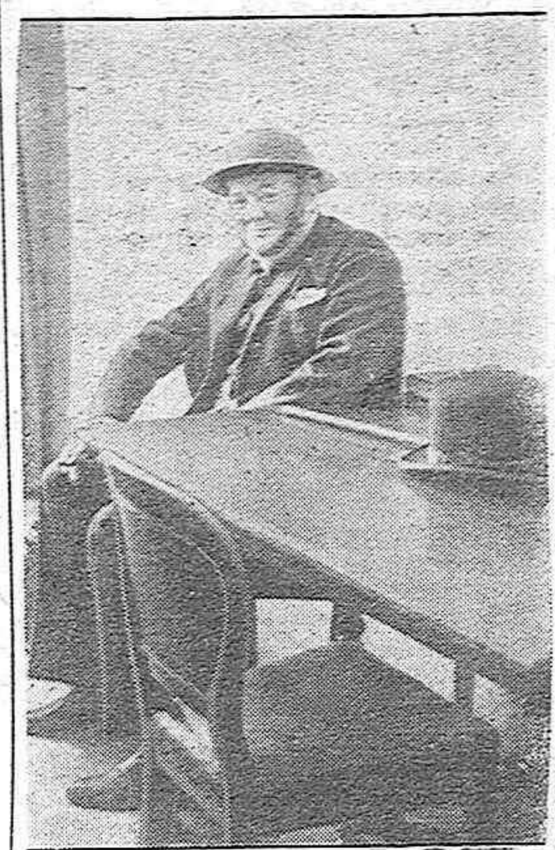
Mr. Churchill posa para la Prensa londinense con todo su atuendo de gran guerrero