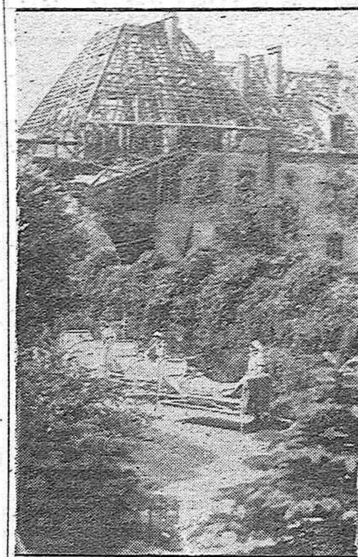
He aquí un hospital en los arrabales de Berlín, que sufrió grandes daños durante un ataque de la Aviación británica contra un barrio completamente civil.