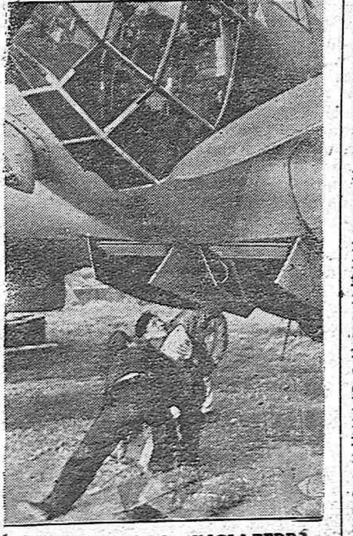
BOMBAS PARA INGLATERRA El cargar un aparato de bombardeo cuesta su trabajador

nuestro joven rey, mantened el orden y volved al trabajo. ¡Viva Rumania! —EFE.