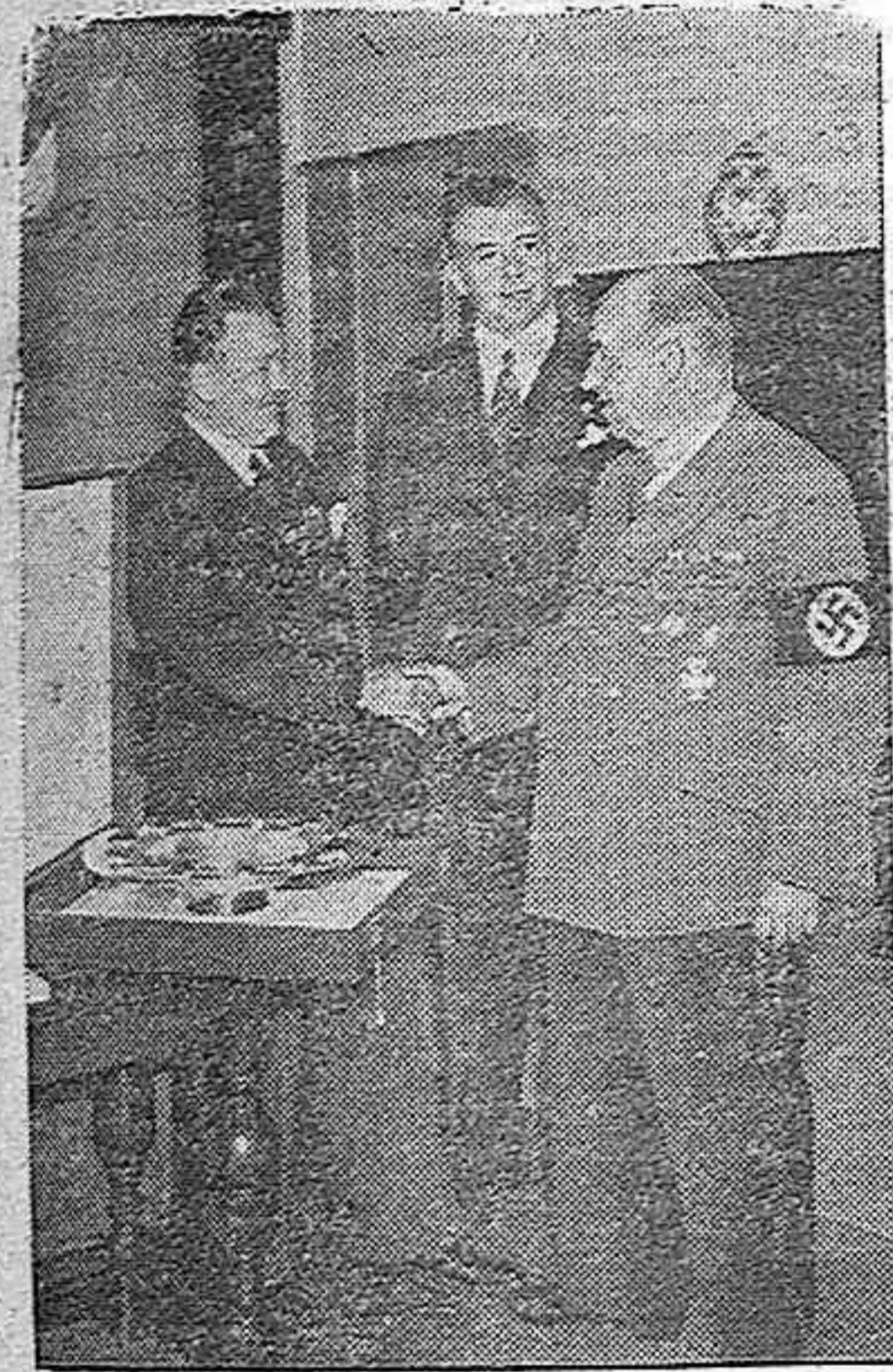
Funk, ministro de Economía del Reich (a la derecha), que acaba de cumplir cincuenta años.

Aparece en España un GLOBO de la defensa de Londres