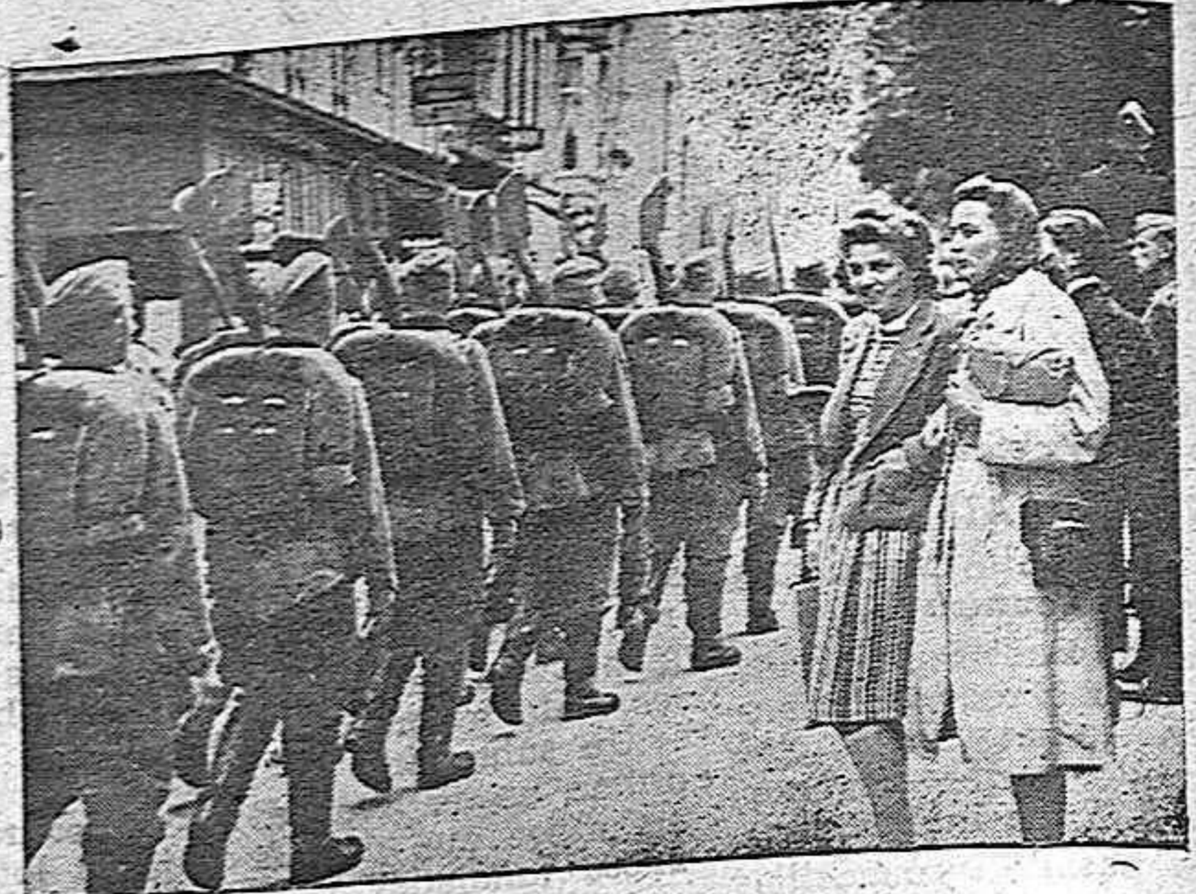
Centenas de obreros alemanes de trabajo en la zona de guerra. En la parte superior se ven a los soldados alemanes que escoltan a las mujeres de la zona de guerra. En la parte inferior se ven a las mujeres que filan por las calles de la zona de guerra.