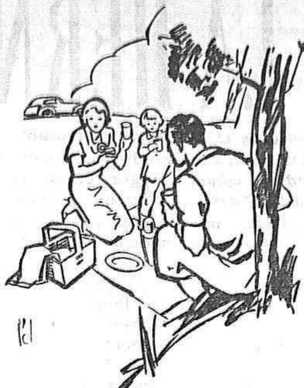
Pida hoy mismo a Sociedad Nestlé, (Sección L. 54) Via Leuchana, 41, Barcelona, un ejemplar gratuito del magnífico folleto ilustrado "Recetas La Lechera".