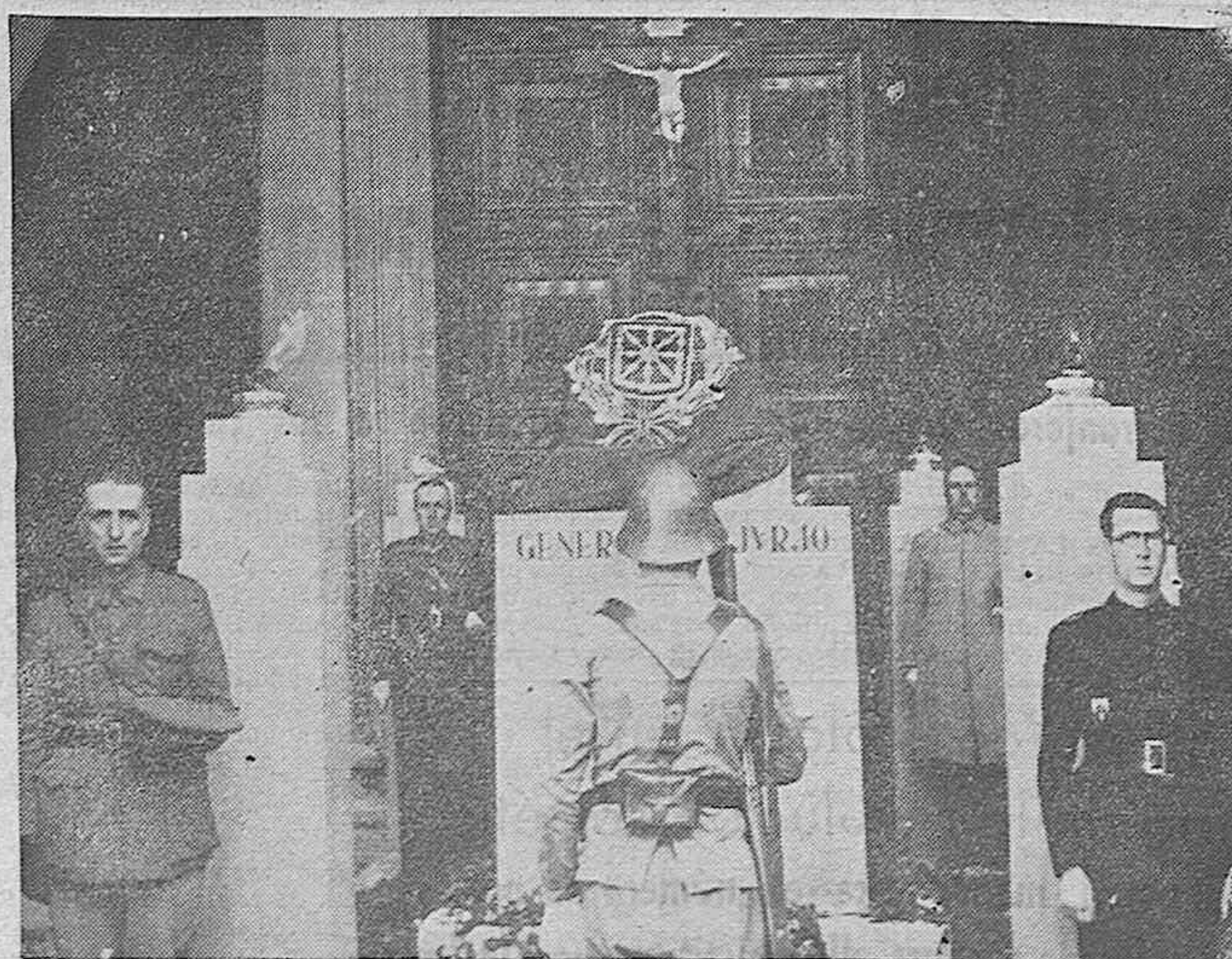
PAMPLONA.—El cadáver del general Sanjurjo en el catafalco levantado en el atrio de la Catedral de Pamplona