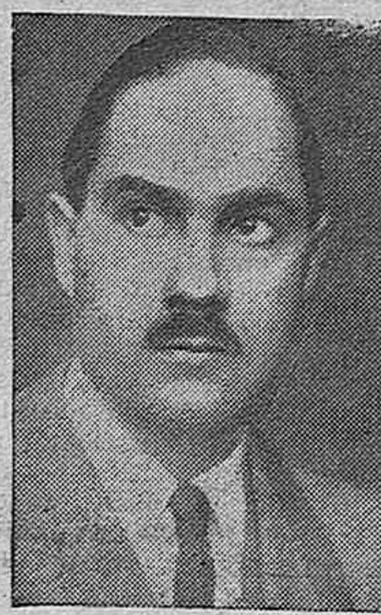
Alessandro Pavolini, nuevo ministro de la Cultura Popular de Italia