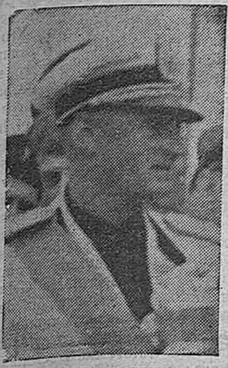
Ector Muti, ex legionario de España, nombrado ministro secretario general del partido