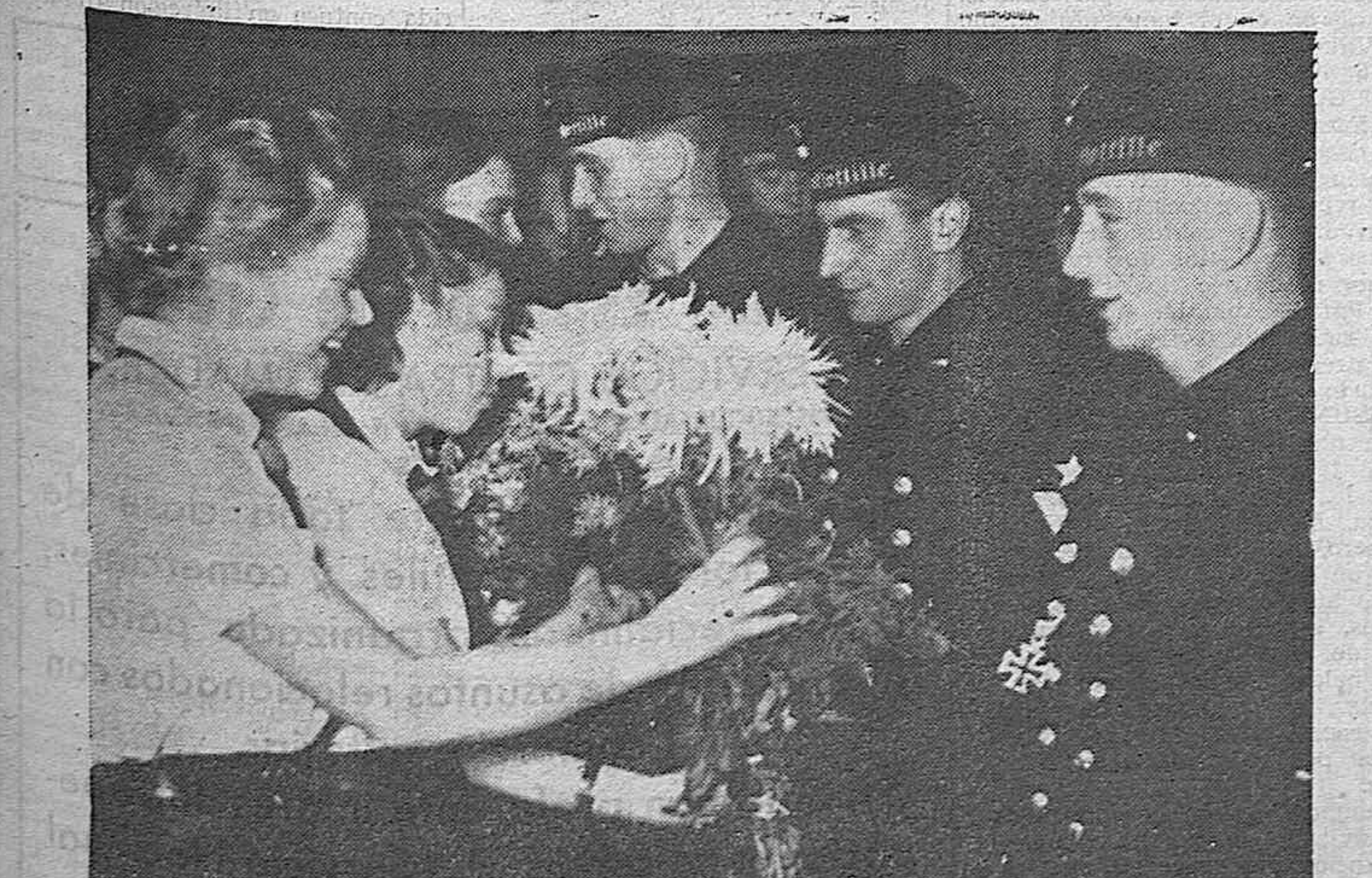
Los tripulantes del submarino alemán que consiguió introducirse en Scapa Flow y torpedear al "Royal Oak" y al "Repulse", son obsequiados con ramos de flores por las muchachas alemanas en Berlín

de los nombres será el Arzobispo de Nueva York. También se cree que Su Santidad nombrará un nuevo Cardenal español, elegido entre los Obispos que más persecución hayan sufrido durante la guerra.