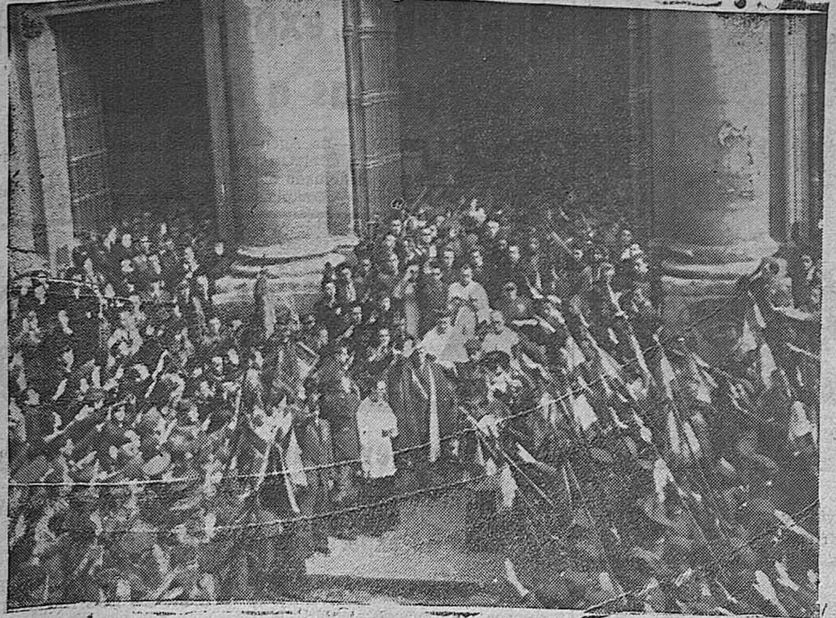
LA FIESTA DEL PATRÓN DE LOS CABALLEROS MUTILADOS EN MADRID.—El general Mihán Astray, el secretario general del partido y ministro sin cartera, el obispo de Madrid-Alcalá y otras autoridades, al salir de la Catedral

de acuerdo con el Gobierno de Londres, entonces está engañando al pueblo francés. Sin embargo, pudiera ser que el Gobierno de París estuviera