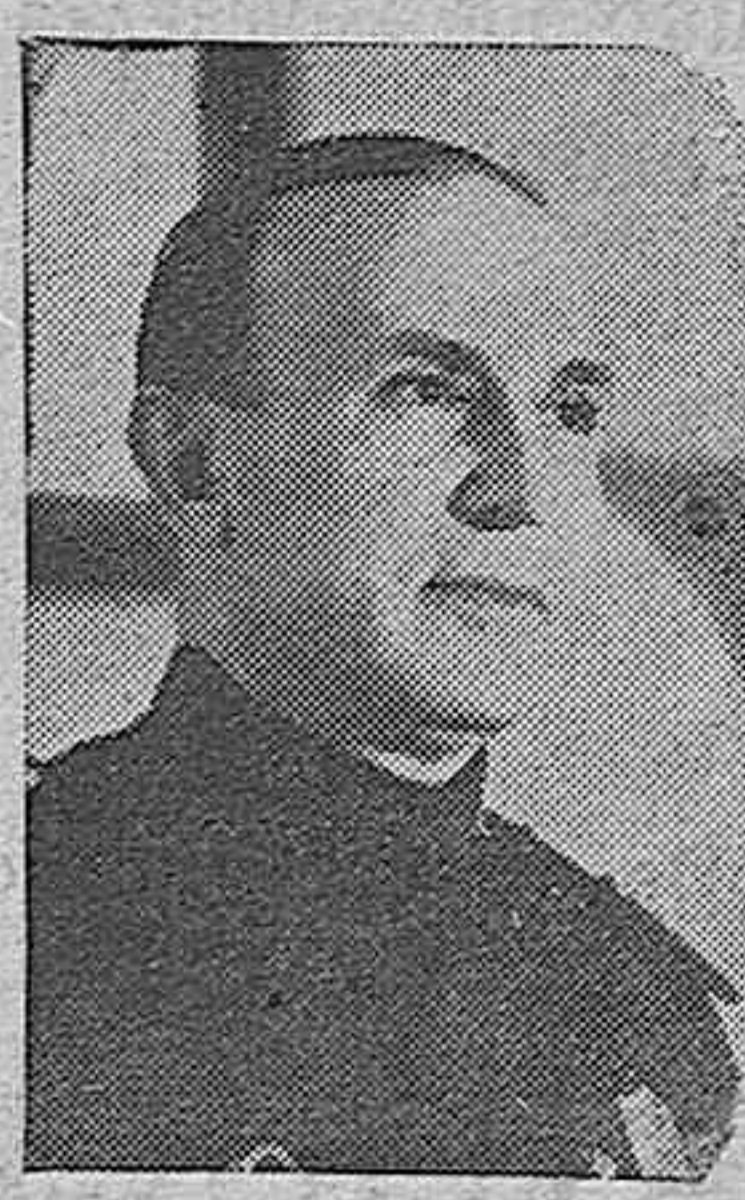
El conde Alfieri, cesado en el Ministerio de Cultura y nombrado embajador