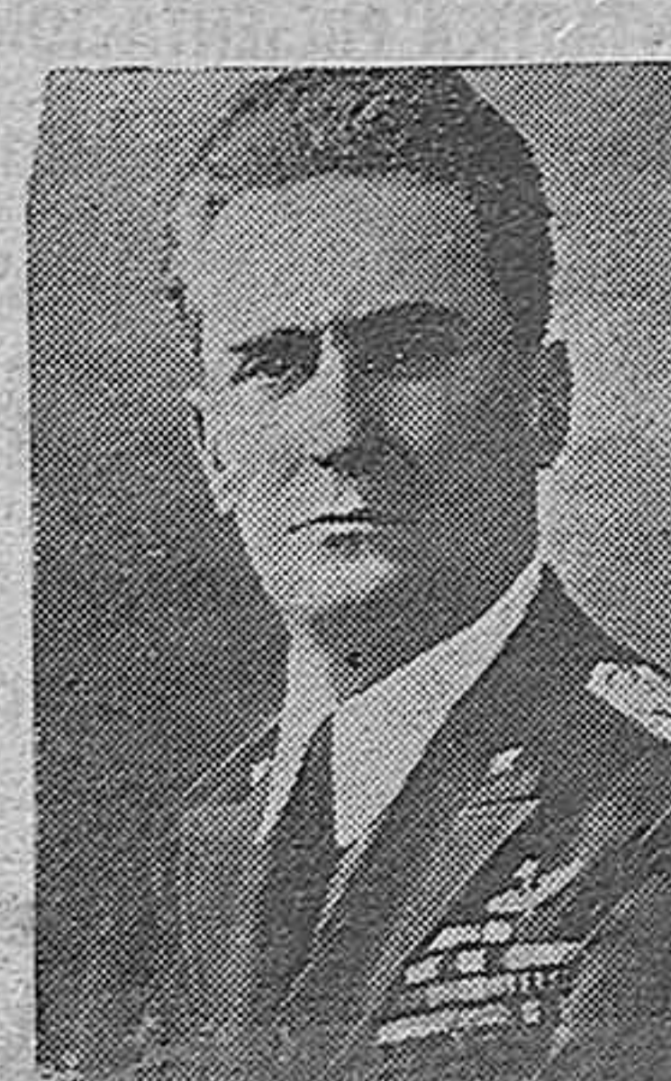
El mariscal Graziani, nombrado jefe del Estado Mayor General del Ejército italiano