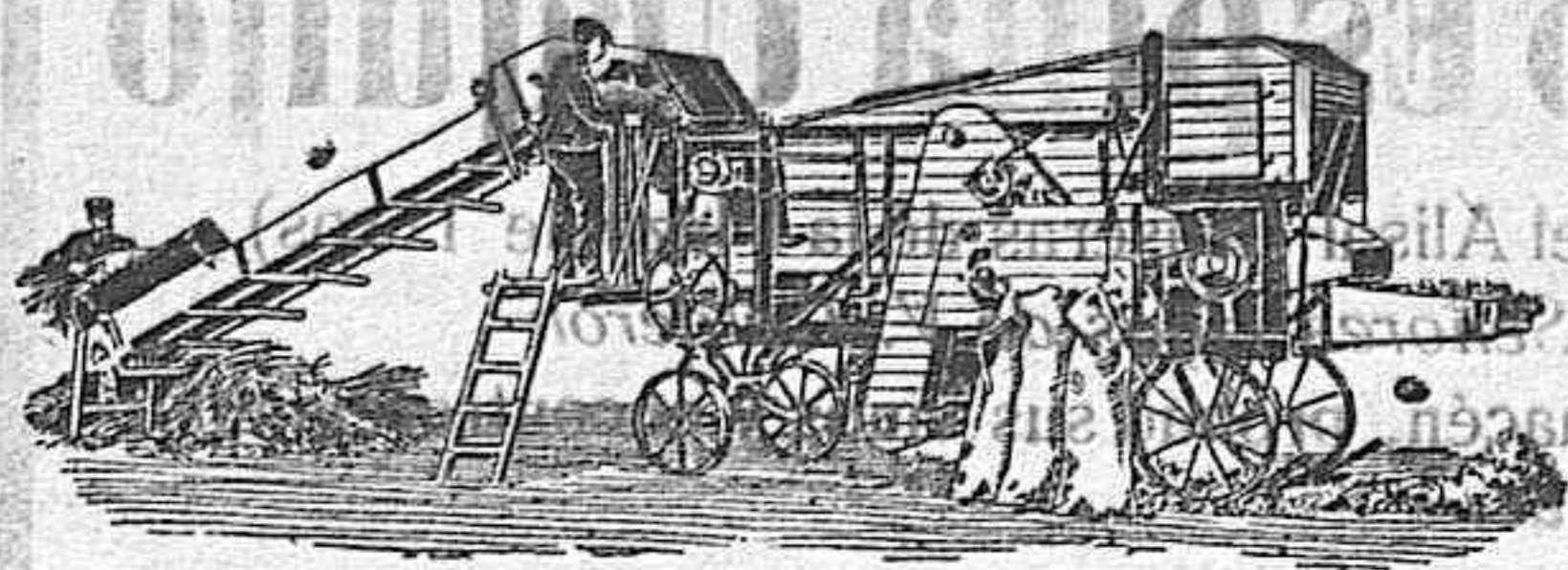
Trilladora «Triunfo Chica» con elevador de mies. Rendimiento diario de 90 a 120 fanegas de trigo diarias, según granazón

Trenes de trilla y arar para entrega inmediata