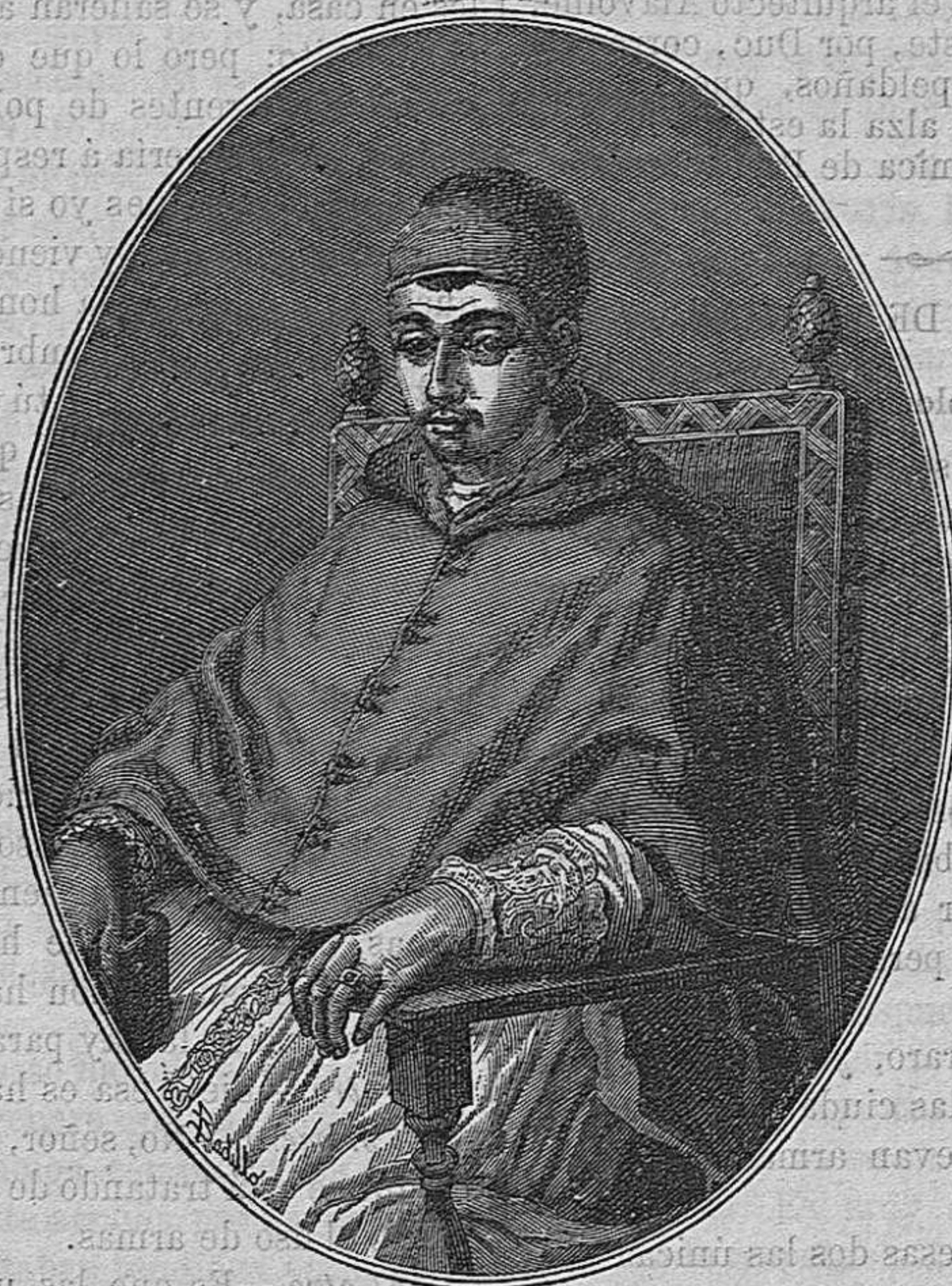
El Cardenal Don Gil Carrillo de Albornoz.

El conocido fundador del Colegio Español de Bolonia, cardenal Carrillo de Albornoz, nació en Cuenca en el año 1300. Muy joven aún, fué elegido arzobispo de Toledo, Hizo la guerra contra los moros, acudiendo al llamamiento del rey D. Alfonso XI; el cual le armó caballero, despues de la batalla de Tarifa. Pero al advenimiento de D. Pedro I, el Cruel , tuvo que emigrar; renunciando la Sede toledana. Se fué al lado del Papa Clemente VI, que entonces residía en Aviñon, y recibió de él grandes muestras de afecto; entre ellas, las de hacerle Cardenal y Obispo de Santa Sabina. Inocencio VI le envió más adelante como legado ad lantere y general del ejército pontificio; para someter á los turbulentos agitadores que habían ocupado varias ciudades de la Iglesia; muy especialmente Roma.