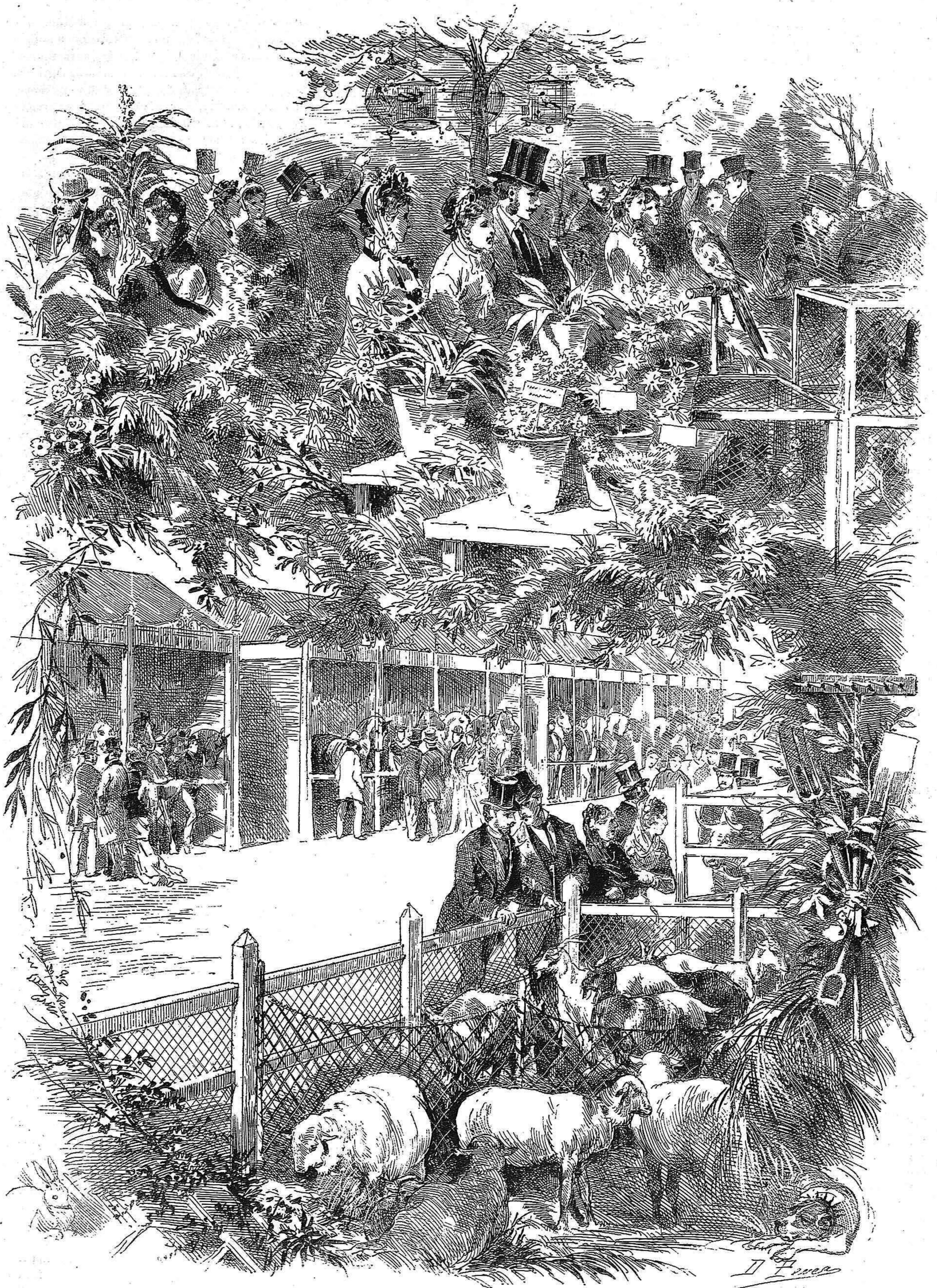
EXPOSICION DE AVES Y FLORES Y DE GANADOS, DE MADRID.