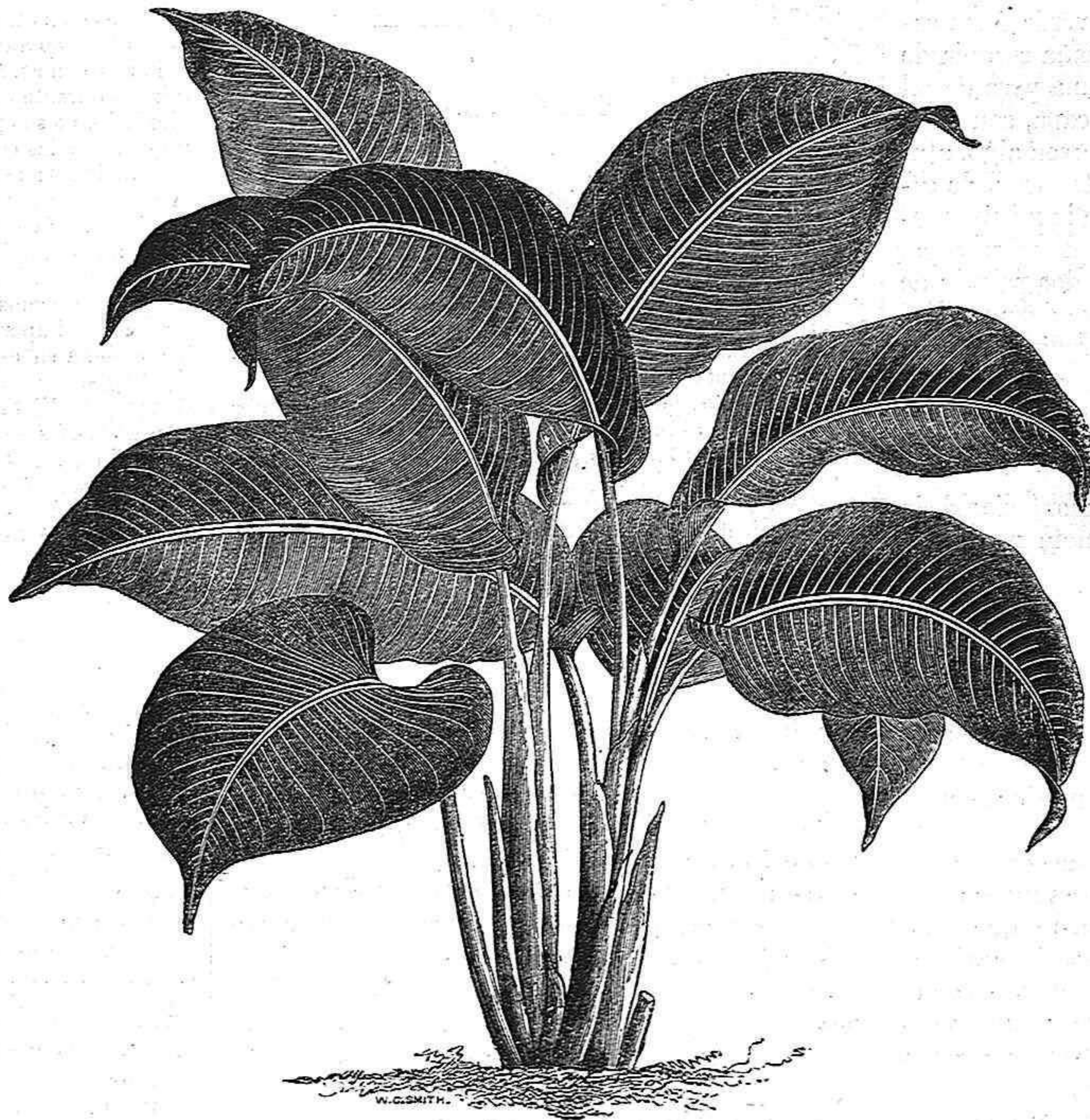
HELICONIA SEEMANNI (SCITAMINEAS).