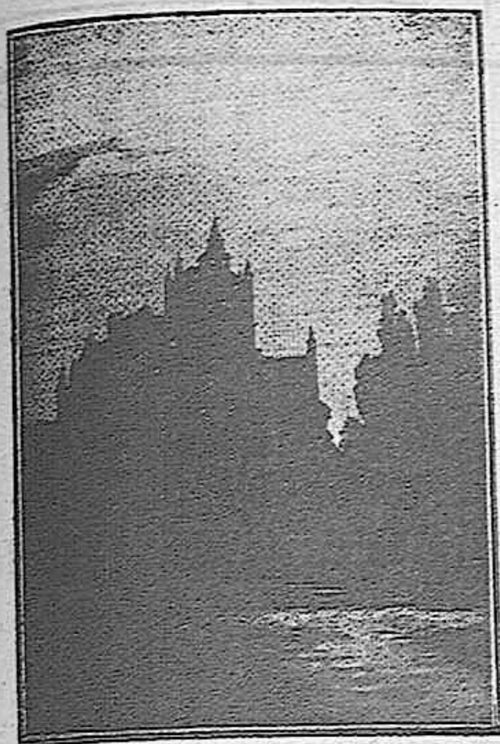
El Alcázar visto a la luz de la luna